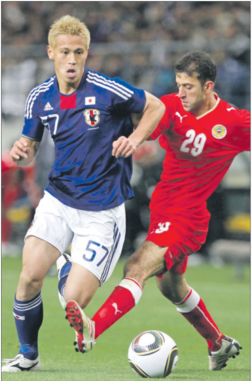
منتخب اليابان يتفوق تاريخيا على الحرة

تاريخه. ويتنظر أن ينتهج الأرجنتيني هيكتور كوبر، المدير الفني للمنتخب الأولي منذ 1988. أما المنتخب الإيراني، الفائز باللقب أعوام 1968 و1972 و1976، والذي حصل على المركز الثالث في النسخة الماضية عام 2019 بالإسراء، فسيسكون مهاجسه الوحيد بطاقة العبور لدور الثمانية للمرة الثامنة على التوالي، وبلغ المنتخب الإيراني للمرة الثامنة على التوالي الأدوار الإقصائية، لكنه خسر في أول دور من هذه الأدوار في 3 من آخر 4 نسخ، بما في ذلك خسارته في الوقت الإضافي أو ركلات الترجيح، وهذه المواجهة هي الثانية بين المنتخبين في كأس آسيا، وقد كانت