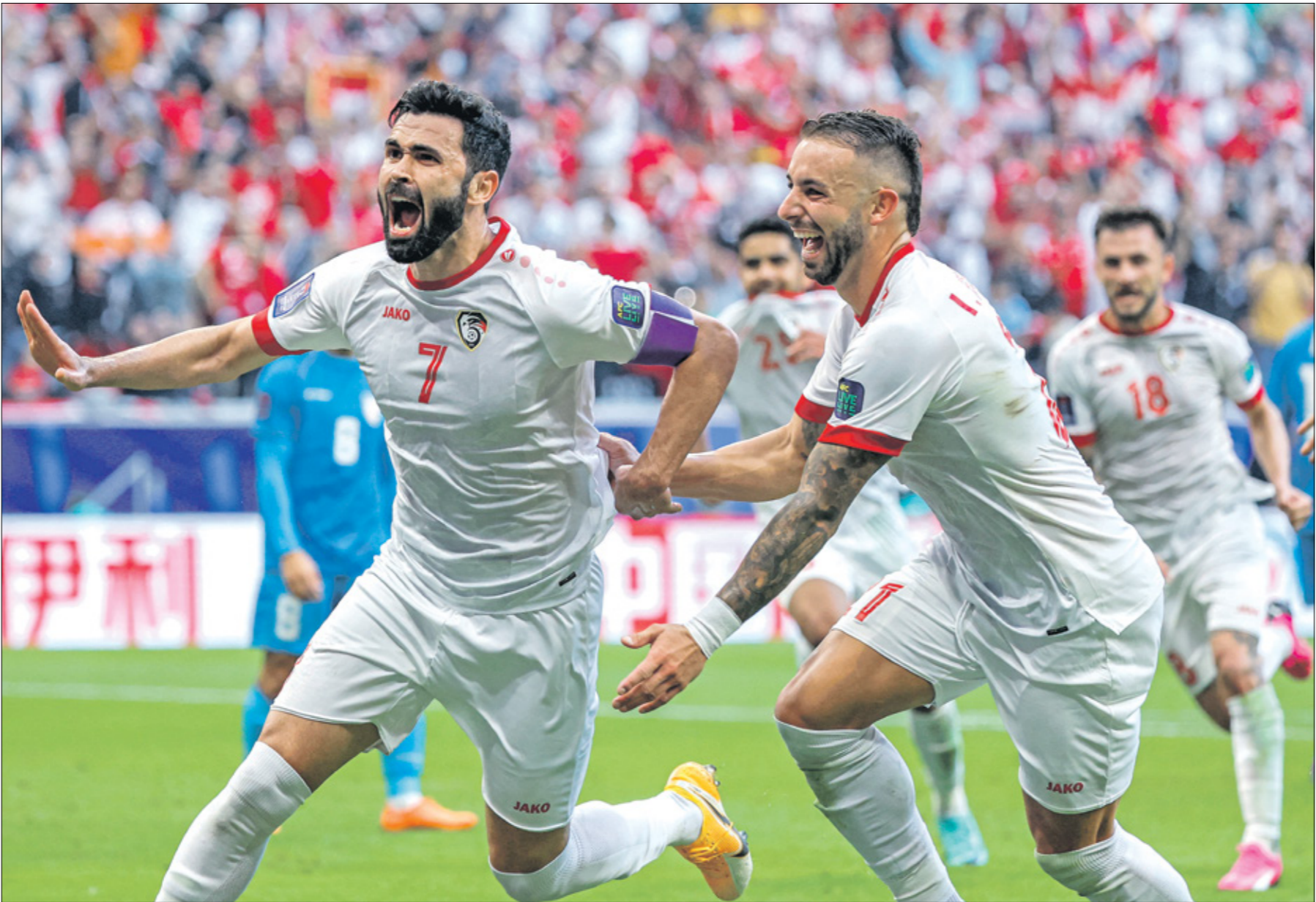
سورية تاهلت إلى الدور الثاني لأول مرة في تاريخها

المنتخبين السابقة الوحيدة في كأس آسيا، وذلك في قبل نهائي نسخة عام 2004. وفي لقاء آخر، يواجه المنتخب السوري نظيره الإيراني على استاد عبد الله بن خليفة لحساب الدور ثمن النهائي، وصعد المنتخب السوري ضمن أفضل 4 منتخبات احتلت المركز الثالث في المجموعات الست بحصوله على أربع نقاط من فوز وتعادل وهزيمة، حيث استهل مشواره بتعادل سلبي أمام أوزبكستان قبل هزيمته بهدف نظيف أمام المنتخب الأسترالي، قبل أن يتنجح في عبور المنتخب الهندي بهدف نظيف ويبلغ ثمن النهائي لأول مرة في