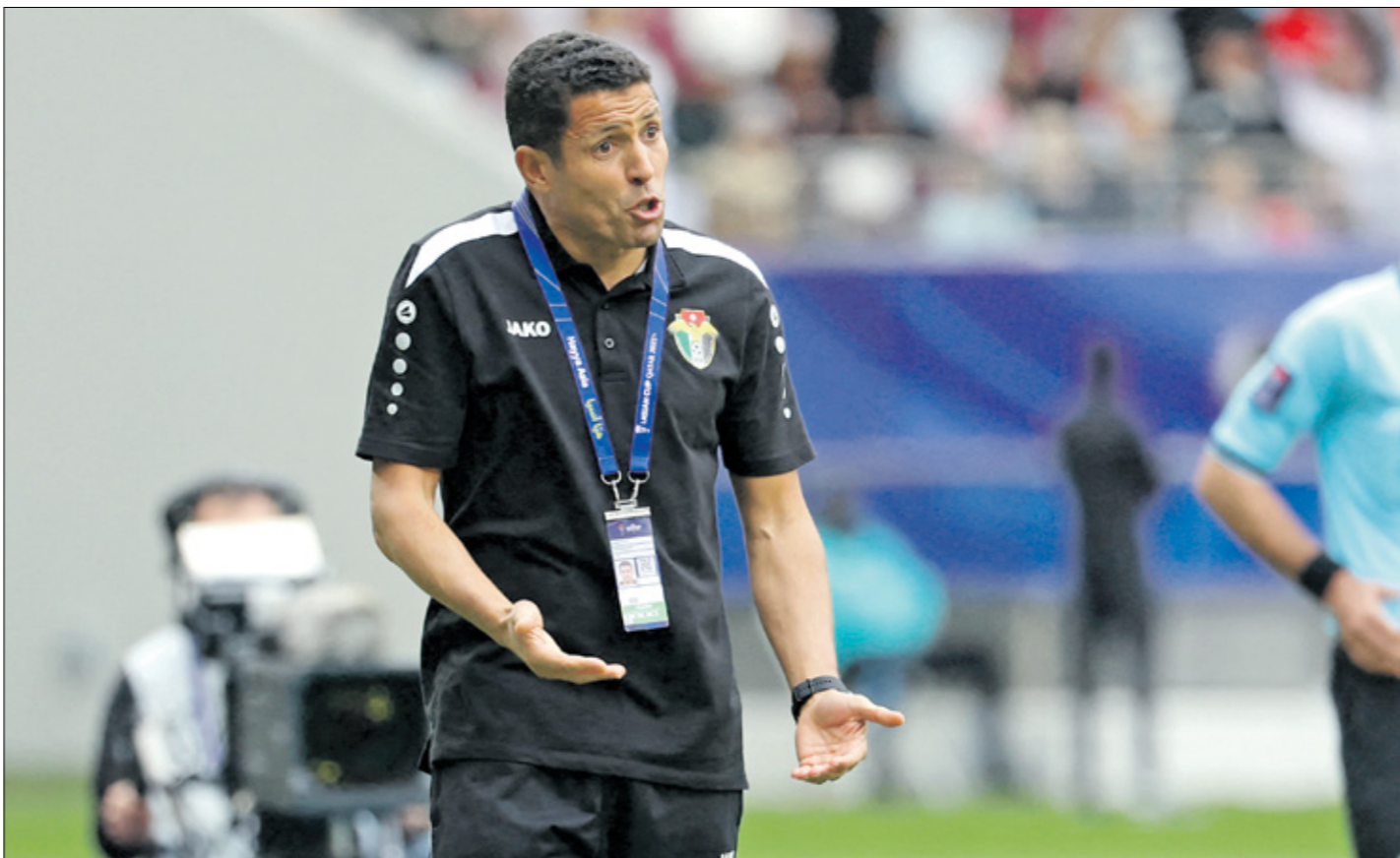
عمومة فاد الردت لدور الثمانية

كان المشهد أشد إيلاماً من وقع الخروج غير المستحق لمنتخبنا من البطولة الآسيوية، وما يمت لإعلام العراقي الأصلي المعروف بمواقفه المشرفة بأي صلة». وأضاف البيان من المؤتمر الصحافي، فيما ظهرت علامات التعجب على المدرب الإسباني، الذي بات في مرعى الانتقادات بعد هذه الهزيمة، وخرج معسكر «أسود الرافدين»، إضافة إلى ظهوره في لقاء صحافي مع برنامج «الجلس» في قناة الكاس القطرية، وفي وقت حساس قبل هذه المواجهة، لكن المدرب الإسباني رفض الإجابة عن السؤال، ليثار نقاش حاد بين مجموعة من الصحافيين والمدرب، الذي عبر