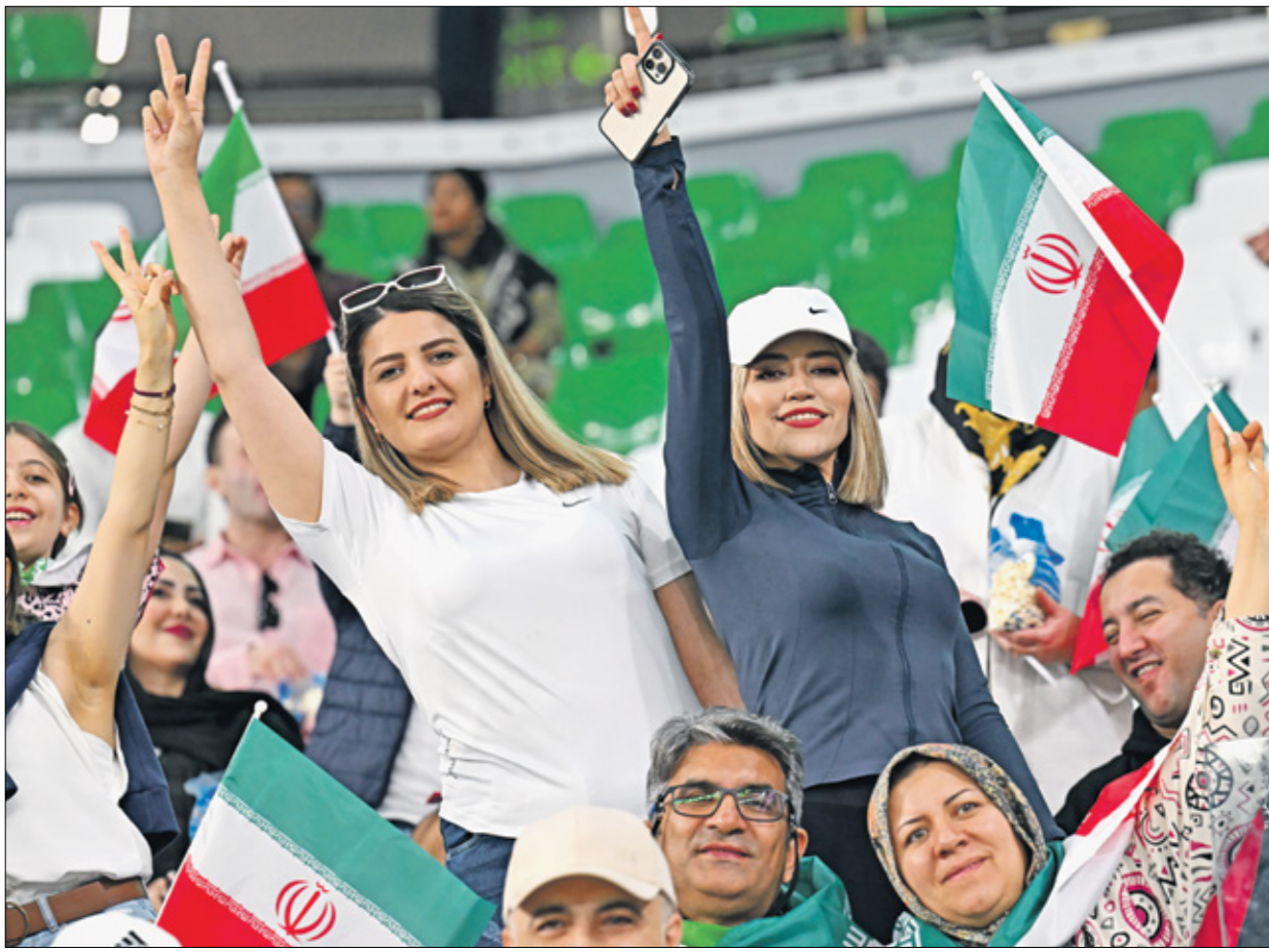
منتخب إيران يلفح هجمًا جماهيريًا كبيرًا

يلتقي المنتخب البحريني نظيره الياباني بحضور نجومه، في الدور ثمن النهائي لكأس آسيا 2023 لكرة القدم، ويعبر الفائز من المواجهة إلى الدور ربع النهائي، لملاقاة المنتصر من مباراة المنتخبين الإيراني والسوري المقررة في اليوم ذاته. ويتطلع المنتخب الياباني الأكثر تحويجا في البطولة بأربعة ألقاب، كان آخرها عام 2011 في الدوحة، إلى تجاوز المنتخب البحريني ومواصلة مشوار البحث عن العودة إلى منصة التتويج وتعويض خسارة المباراة النهائية في النسخة الماضية التي جرت في الإمارات عام 2019، أمام المنتخب القطري بهدف لثلاثة. بالمقابل، يأمل المنتخب البحريني إحداث مفاجأة مدوية بإقصاء أحد أبرز المرشحين للفوز باللقب، واستكمال المشوار نحو الدور المقبل، ومن ثم البحث عن رحلة اللقب الأول، علماً بأن أفضل نتائج المنتخب البحريني هي الوصول إلى الدور نصف النهائي واحتلال المركز الرابع في نسخة عام 2004 التي جرت في الصين، وكان المنتخب البحريني قد دون المفاجأة في الدور الأول عندما تصدر المجموعة الخامسة على حساب المنتخب الكوري الجنوبي، رغم خسارته في المباراة الأولى أمام هذا الأخر بهدف ثلاثة، لكنه حقق انتصارين على ماليزيا والأردن بالنتيجة نفسها ويهدف من دون