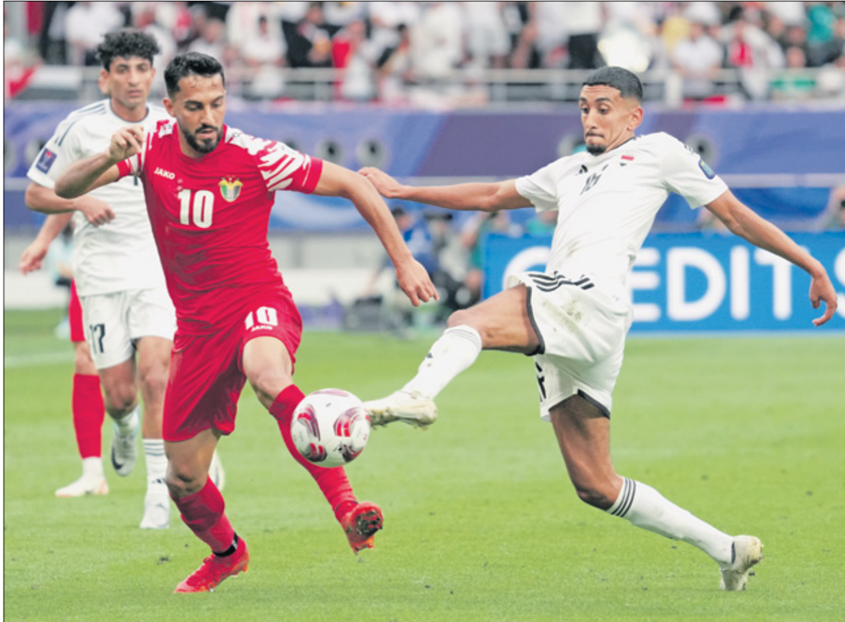
الملايكتان هجما مواجهة عميقة فلما