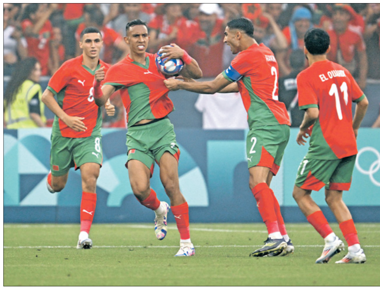
يسعى منتخب المغرب للتقدم مستوحى جيد والتأهل

قمة المغرب والعراق: معركة لتأهل وصل المنتخبان المغربي والعراقي إلى الجولة الثالثة والأخيرة من دور المجموعات وفي رصيدهما ثلاث نقاط واحتلا المركزين الثالث والرابع في المجموعة ولكن بفارق الأهداف فقط عن الأول والثاني، إذ تتصدر