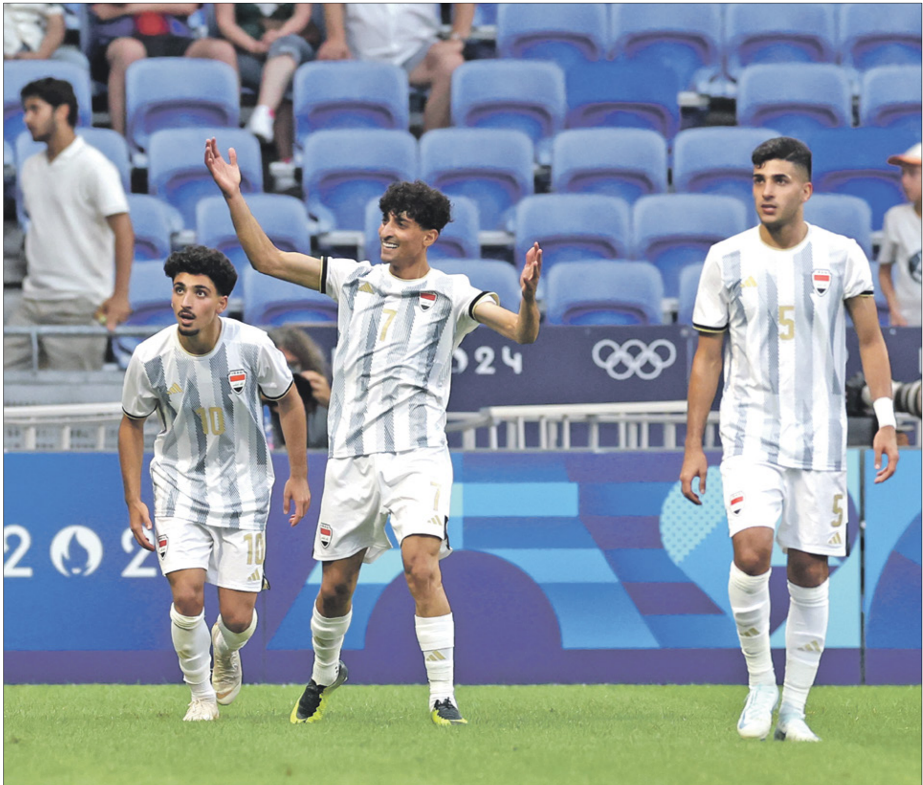
يحتاج منتخب العراق للفوز من أجل رفع حظوظ التأهل

أوزبكستان الرابع (صفر نقطة)، وسيلعب منتخب مصر مواجهة من العيار الثقيل أمام منتخب إسبانيا، ويحتاج للفوز بـ3 نقاط، أو التعادل (نقطة واحدة)، لضمان التأهل، بعيداً عن نتيجة المباراة