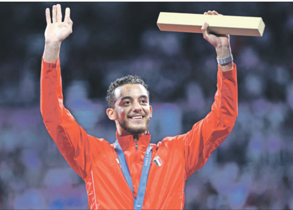
السيد حسم البرونزية على حساب المجري أندراسفي

حصد السباح الفرنسي الشاب ليون مارشان الميدالية الذهبية الأولمبية الأولى له، بعد أن فاز بسباح 400 متر متنوع في أولمبياد باريس 2024، وهي الميدالية الذهبية الثالثة للدولة المنظمة، وتعد هذه الخطوة الأولى في الحلم الذي يسعى خلفه صاحب الـ22 عاماً، وهو أن يكون خليفة أسطورة السباحة في العالم سابقاً، الأميركي مايكل فليس، ونجح مارشان في إنهاء السباق خلال 4 دقائق وثمانيتين و95 جزءاً من الألف من الثانية، بينما جاء الياباني تومويوكي ماتسوشيتا في المركز الثاني؛ الميدالية الفضية، بفارق 5,67 ثوان، ثم الأميركي كارسون فوستر، الميدالية البرونزية، بعد دقائق 8 وثمانين و66 جزءاً من الألف من الثانية.