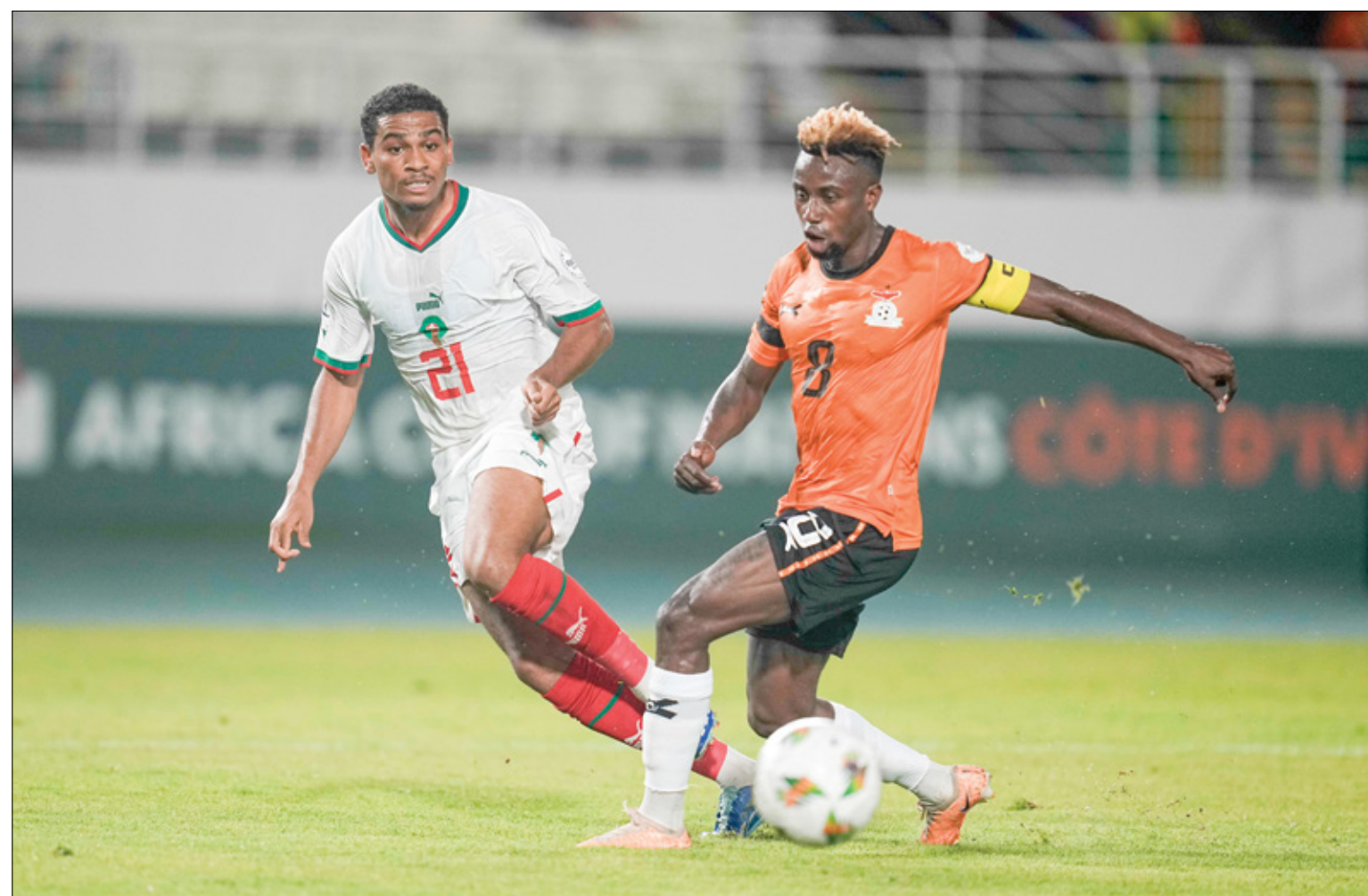
يواجه المغرب منافسه منتخب جنوب أفريقيا