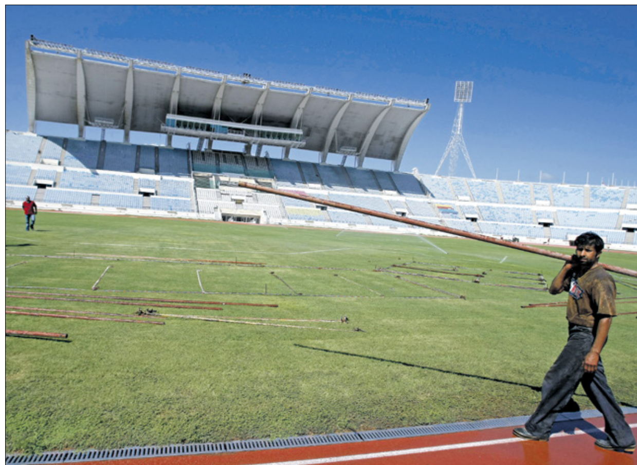
لا يملك لبنان ملعباً عالياً واحداً (فادرا على استضافة المباريات)

كرة السلة لم يعتمد يوماً على دعم وزارة الشباب والرياضة، وتطور لعبة السلة في لبنان لم يكن يوماً بسبب اهتمام الدولة ومستوى الاحتراف وإفادة المنتخب، وهنا بالنسبة كان الاتجاه في السنوات الماضية سلبياً إلى جلي لاعبين من الخارج، ربما لم ينجح منهم كثر، لكن في نهاية الأمر بات هذا الأمر سائداً في جميع منتخبات العالم، لبنان المشكلة تكمن في ميكنة الرياضة بشكل عام وكرة القدم بشكل خاص، ستبقى اللعبة على حالها وسيبقى المستوى متواضعاً طالما أن الدولة بشكل عام لا تولي أهمية لهذا القطاع تحديداً، فنتاج