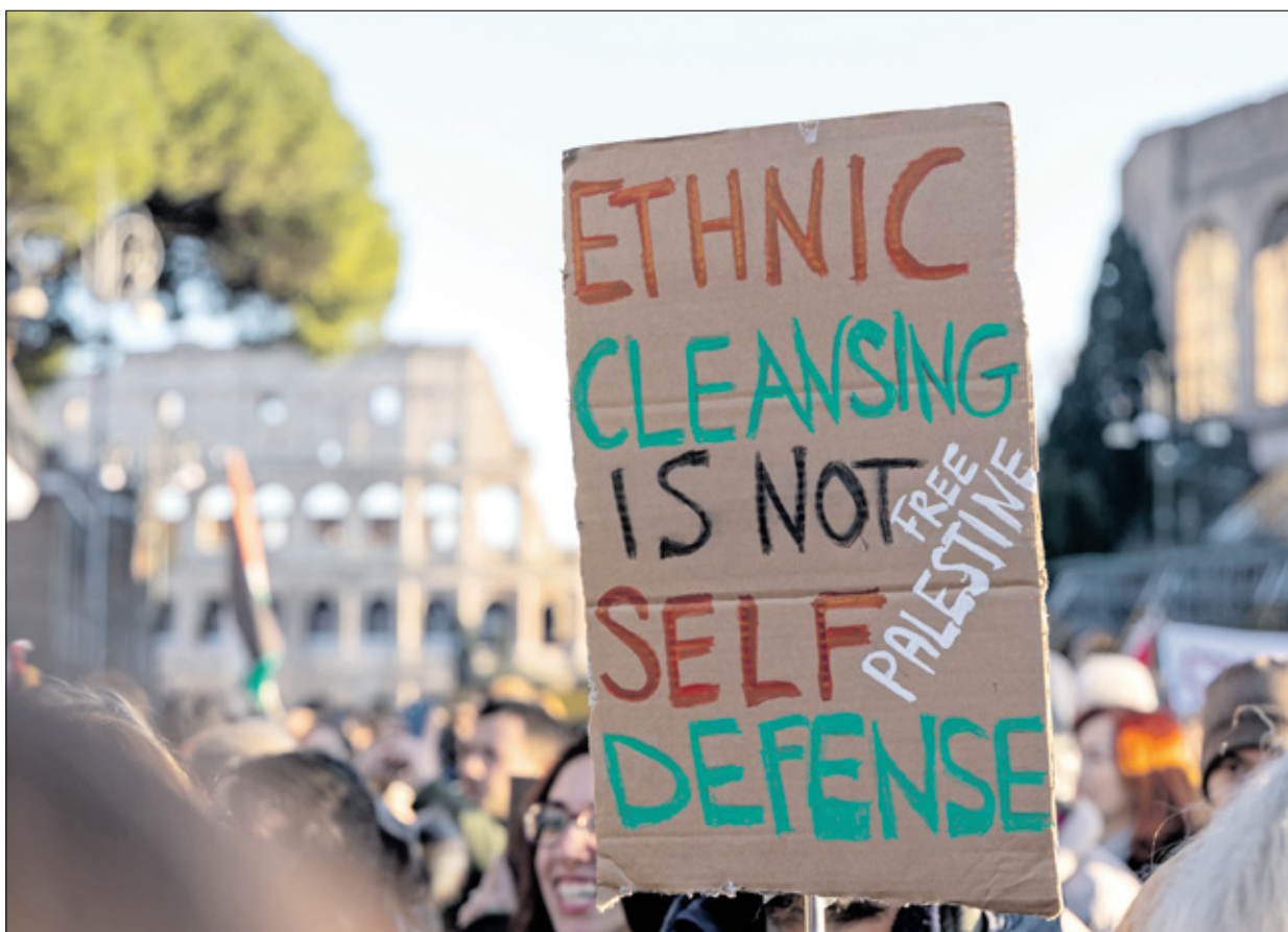
مظاهرات في روما يرفعون المنة كتب عليها «الطهر العرقي ليس جماعاً عن الناس» 13 كانون الثاني/ يناير 2024