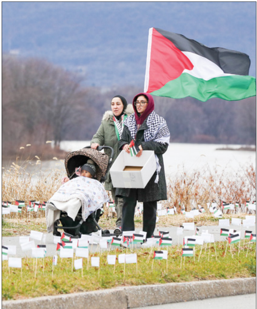
فني بنسلفانيا

ريم ياسر «الزخرفة التجميعة: عشرة قرون من الفن الإسلامي»، هو عنوان المعرض الذي أعلن عنه متحف فريك في مدينة بيتسبرغ بالولايات المتحدة الأميركية. متحف فريك بيتسبرغ أحد أهم المتاحف الفنية في ولاية بنسلفانيا، وأسسته هيلين فريك، في عام 1969، وهي ابنة قلب صناعة الفحم الأميركي. الراحل هنري كلاي فريك، المعرض الذي كان المتحف قد أعلن عنه قبل أشهر، يسيطر الضوء على الفنون الإسلامية الدقيقة، كالآواني الخزفية والزجاجية الملونة والمزخرفة وأعمال الفسيفساء، إلى جانب الزخارف المعدنية والأسلحة والنسيج، وغيرها من الفنون المرتبطة بعناصر الحياة اليومية في العالم العربي والإسلامي. تشمل الأعمال التي يضمها المعرض قطعاً فنية من إيران ومصر والهند وسورية وتركيا. يستحضر المعرض، بحسب الديان المنشور على موقع المتحف، التاريخ الفني الفني للعالم الإسلامي، كمسودج للحجرات الإنسانية المهمة التي تتجاوز العوايق والحدود. كان مقرها لهذا المعرض أن يفتتح في الرابع من نوفمبر/تشرين الثاني الماضي، قبل أن تعلن إدارة المتحف تأجيل الموعد إلى شهر أغسطس/ آب المقبل، في بيان صدر قبل موعد الافتتاح بأسبوعين تقريباً. كانت اللوائح التي أعلنتها إدارة المتحف، ورا تأجيل المعرض تتعلق بإعادة جدولة الأنشطة خلال هذا الموسم، من دون ذكر السبب، ولكن لم تضح أيام قليلة على إعلان التأجيل، حتى اكتشف الفناني الحقيقي من وراءه. في لقاء أجرته إحدى