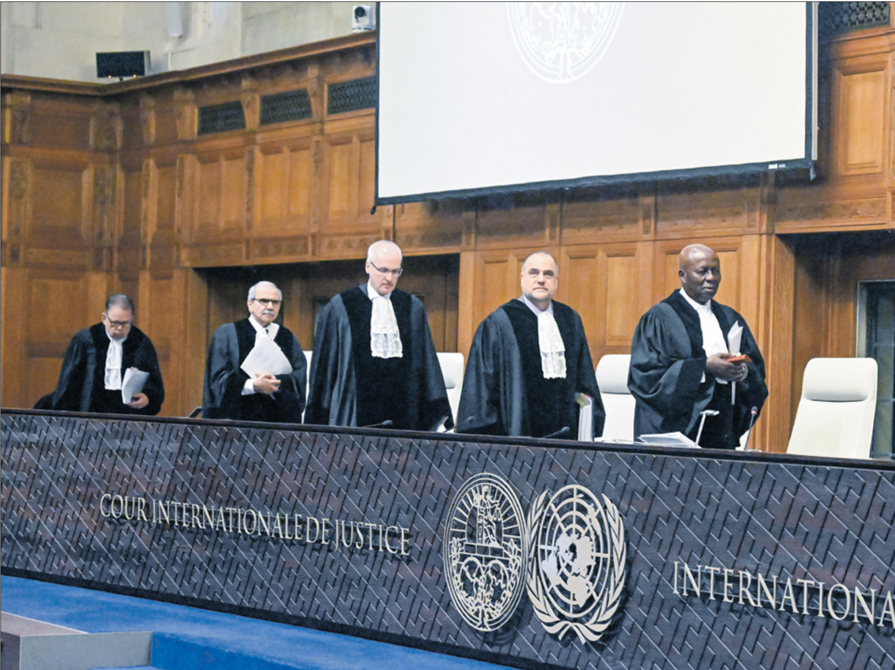
قضاة المحكمة خلال جلسة الاستماع لدفاع اسراييل، 12 اياريل الحالي

ويبدأ «دفاع» دولة الاحتلال في لهاي يرتبكا أمام قوة حجج جنوب افريقيا، في الاتهام الأول من نوعه لإسرائيل أمام محكمة العدل الدولية، وهي اية عملية قضائية في العالم، ويحسب «نيويورك تايمز»، فإن الأوامر السرية التي سمحت حكومة الاحتلال بالكشف عنها، تقول إنها تدحض تهمة الإبادة، ويبدل ذلك، تظهر «المجهود» التي تبذله إسرائيل لتقليل عدد الوفيات بين المدنيين في غزة، جزاء عملياتها العسكرية. وقالت الصحفية التي اطعت على نسخ من الوثائق، إن معظم دعوى جنوب افريقيا تركز على تصريحات «نارية» لسؤولين