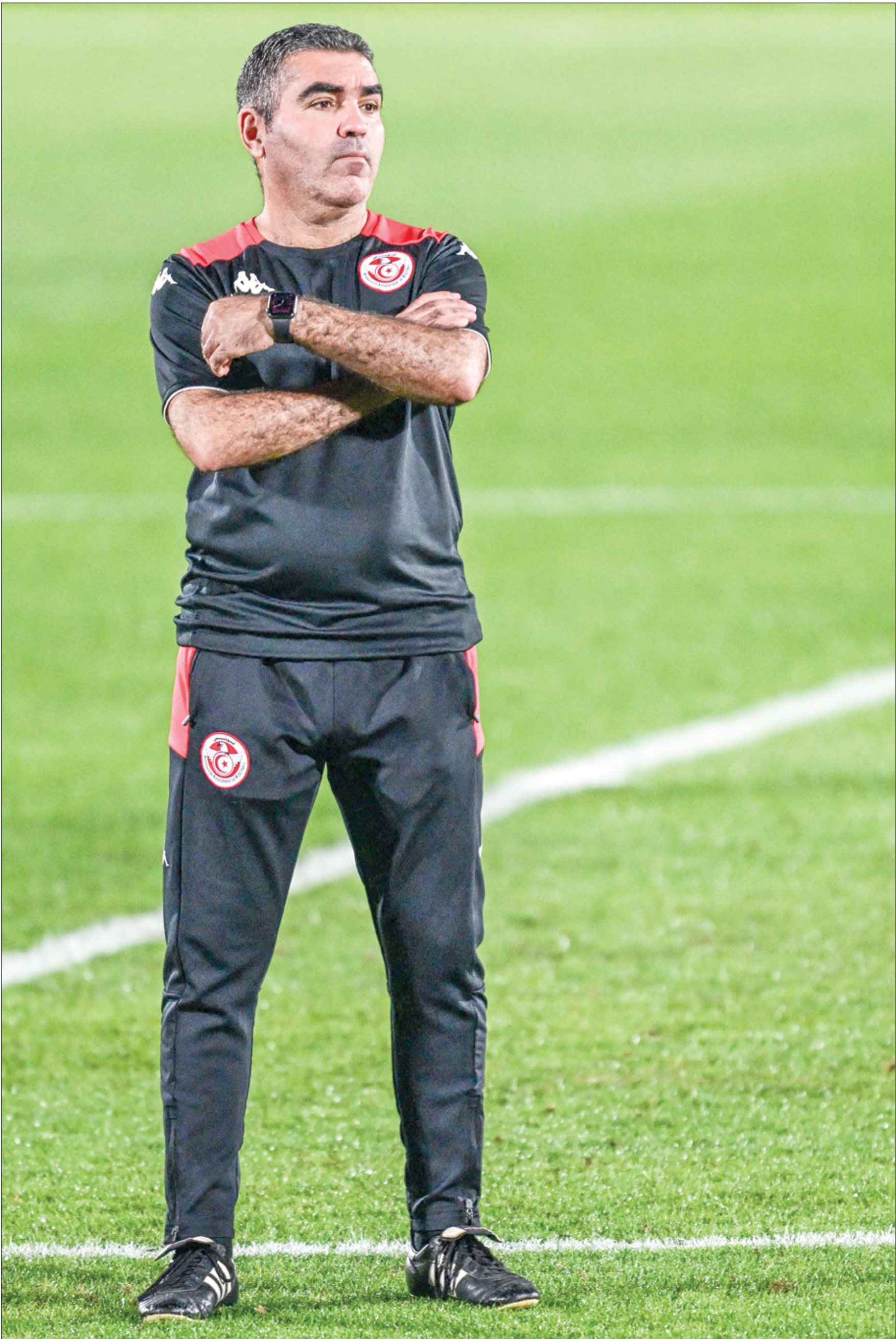
التهل رحلة جلال القادري بعد ترحيله كأس العالم 2022 وكأس آسيا 2023

تولى المدرب الأرجنتيني ريكاردو غاريكا تدريب تشيلي، وذلك وفقاً لما ذكرته مصادر مقربة من الاتحاد التشيلي للوكالة الإسبانية. وسخلف المدرب (65 سنة)، الذي كان يرب منتخب بيرو، في المنصب الأرجنتيني أيضاً إوارو بيريزو، الذي استقال في شهر نوفمبر/ تشرين الثاني الماضي بعد انتهاء المبارات التي تعادلت فيها تشيلي أمام منتخب باراغواي بدون أهداف في التصفيات المؤهلة لنوديال 2026.