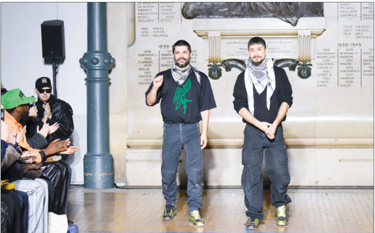
طالباً يوهف بإعلان النار فيه غزة

عُلقَت لوحة كتب عليها: «صامدون هنا رغم الألم نغني ونشيد الأشعار». يأمل هذا الفنان أن يعلو صوت الموسيقى على في صوت آلات الحرب، وأن تكون أغانيه بمثابة فسحة ومتنفس لكل من اتعبه صوت أزيز الطائرات، وسط الخراب وبين خيام النزوح، يلهو بعض الأطفال مستعرضين هواياتهم ومهاراتهم في عدد من الأنشطة الرياضية، مثل الباركور الشهيرة في غزة. مهارت تدربوا عليها وطوروها خلال الحصار، وإن يمارسونها في ضيق المساحات مع أقل الإمكانيات، تتلمكهم الفرح لحظات قبل أن يتملكهم الحزن لأشهر، ينتظرون دقائق الهدوء للعودة إلى اللعب ويمامون في كل لحظة لا تصف فيها أن تكون هي أطول لحظة. يُعزي الغزيون أنفسهم بأنفسهم، ولهم في هذا النزاع وسيلة للتواسة والاستمرار في الحياة. فرغم كل الظروف، يواجه الناس آلة الموت الإسرائيلية بكل ما أوتوا من قوة، مواجهة ينتصر فيها الفرح أوقاتاً قصيرة قد لا تدوم، مثل