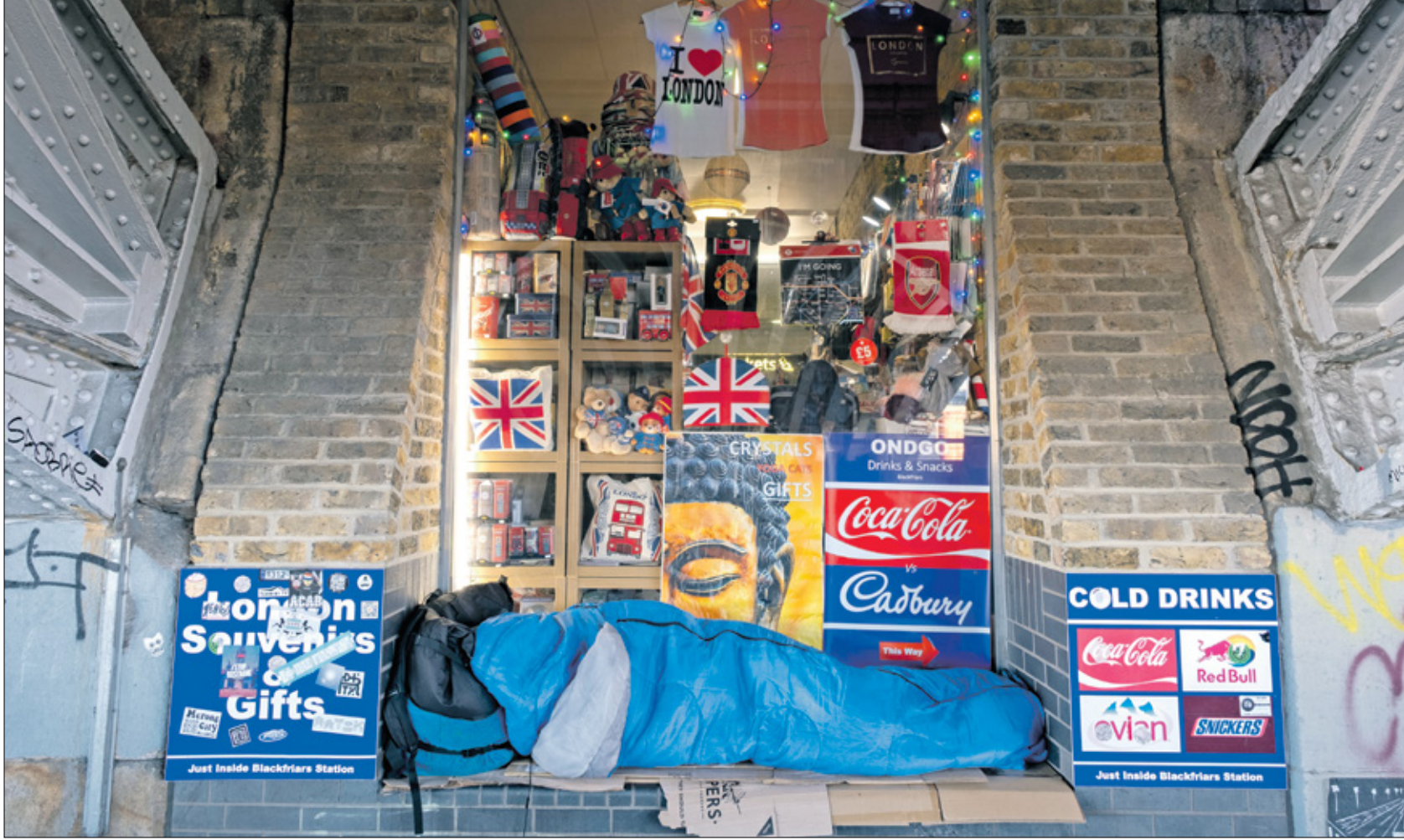
يمكن أن تؤدي نزلات البرد والتهابات الجهاز التنفسي إلى الأرق

يمثل الأرق إحدى أكثر المشاكل الطبية شيوعاً، ويمكن أن يؤثر على الأشخاص في أي عمر ومن أي جنس. ولكن احتمال ظهوره أكبر عند الأفراد في سن البلوغ، وعند النساء