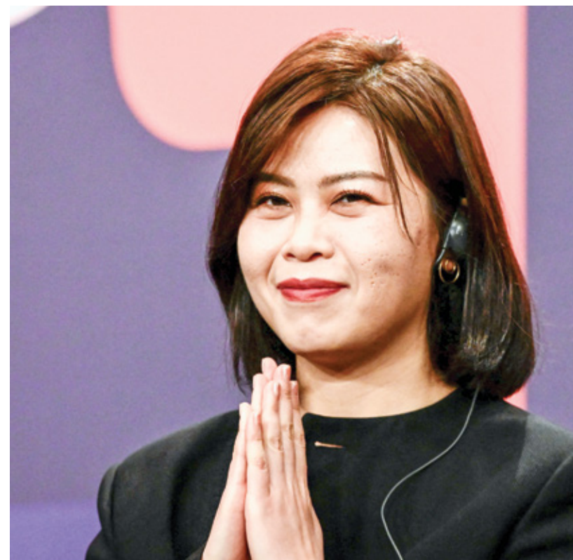
المخرجة الصينية هان شواي، قبله «صبرا»، توفيت شهرت في فرنسا (رأس)

امراتان، جورجينة وصينية، وجدتان جميلتان، تكدان لكسب رزقهما، وتعاملان بعداء من محيطهما. إحداهما عزباء والثانية متزوّجة من عدو. فالتان، تحبهما الكاميرا. إحداهما تسكن قرية، والأخرى تسكن مدينة عملاقة، في الحالتين، اخترقت المغتلة مزاج الشخصية التي أدتها، وحملت الفيلم على كتفها في 90 دقيقة، بكفاءة هذا الاختراق العميق لمعيش النساء يُصنّف فلماً ضمن سينما المرأة. غرّض الفيلمان في مسابقة الأفلام الطويلة، في الدورة ال16 (13، 18 نوفمبر/ تشرين الثاني 2023) للمهرجان الدولي لفيلم المرأة بسلا» (المغرب). الجورجينة امرأة عزباء (إيكا تشانغفينشي)، تبلغ 48 عاماً، وتعيش أول قصة حب، في اللغة Blackbird، Blackberry، إيلين نافازياتي (2022)، تدبر دكاناً في قرية معزولة مبنية. استخدمت المخرجة كادرات عامة، تظهر فضاء واسعاً لتكون رباتية الزين عمرة. هناك، ينشل القويون بمشاكل جيرانهم، أكثر من مشاركتهم كانت موضوعاً لنكات جاراتها وتعلقاتها. جارات بلعن ورق الشدة، ويُعلقن هنّ الأخريات المنعمة أرخص تسليمة، النساء هنّ الحجم اليومي، الرجال جاسون في المقاهي». ترفغ صورتي أيتها وشغفها، في بيتها، يوماً واحداً كل أسبوع، أي اليوم الذي ربما يزورانها فيه. تشعر بحت أول وأخير، إنه حت الخريف الأخير لسائق شاحنة عابر. هل تستغمره، أم تُصدده؟ من يتشبع يحصل على جائزة، وتوزيع، فحاه، بيروها والدها وشغفها، حين عرف أنها وقعت في الحب، فحاه لتوزيعها، فيلماً بإيقاع بطيء، هذه سينما المخرج المؤلف، إيقاع بطيء، لكنه غير ممل،