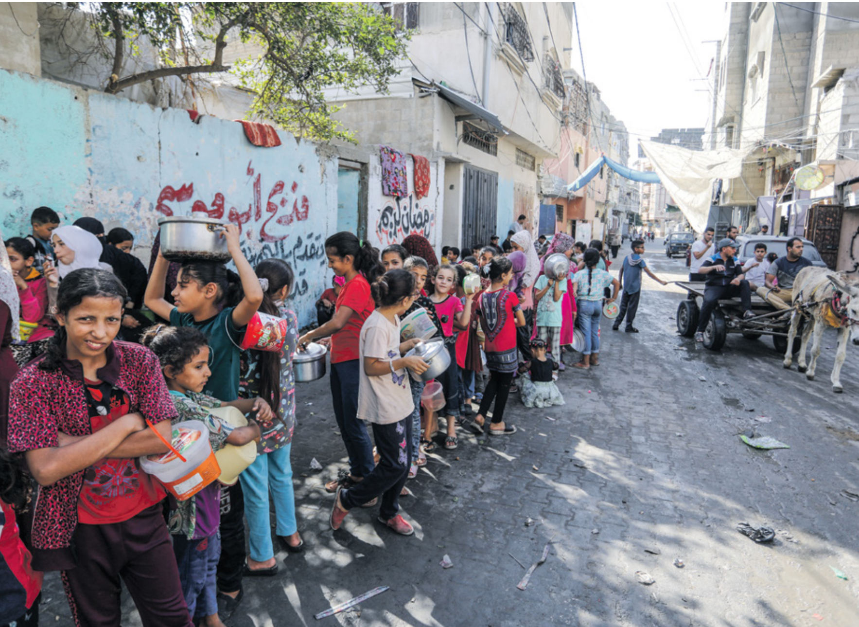
طوابير الجوع في غزة

وتعد تدمير المحاصيل الزراعية من المتغيرات الكارثية للعدوان الإسرائيلي المتواصل على قطاع غزة منذ قرابة 4 شهور خلفاً تصاعد ضحايا نهج التجويع الإسرائيلي لسكان قطاع غزة، لا سيما في صفوف الأطفال والمسنين، وذلك كل ذلك عدم تمكن المزارعين الإسرائيليين غير الخوفاً للأراضي الزراعية على طول الشريط الشرقي، والتي تنتج مكونات السلة الغذائية المتكاملة لقطاع غزة، والذي كان يحاول طيلة السنوات الماضية الاكتفاء ذاتياً من المحاصيل الزراعية كافة، وتسويق وتصدير بعض منها إلى الضفة الغربية ودول الخارج. ومن ضمن الأمراض العديدة الأساسية التي باتت تواجه القطاع الزراعي، والمزارعين، انقطاع الماء اللازم لمحاصيلهم