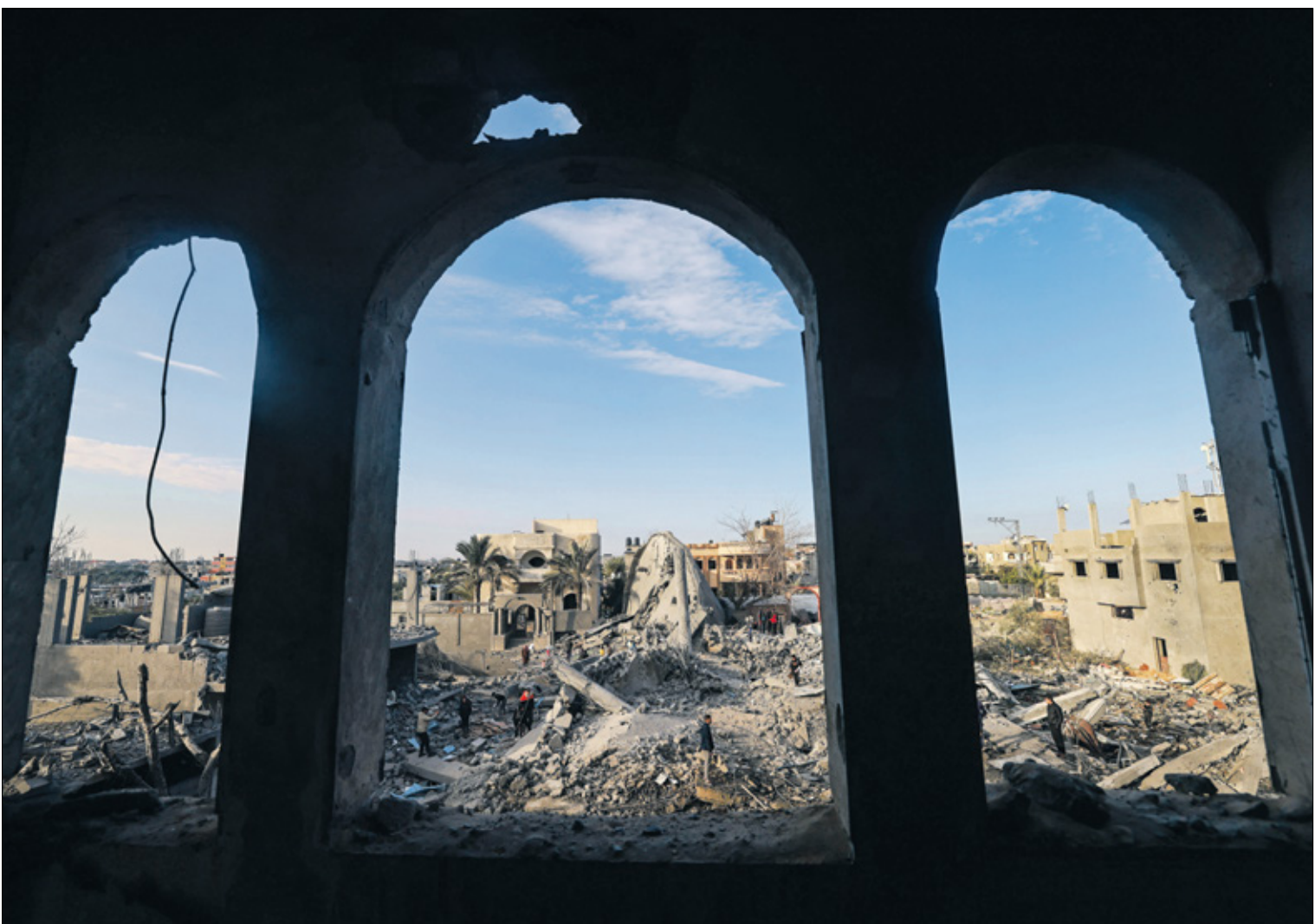
من رهب جنوب غزة، 25 كانون الثاني/ يناير 2024