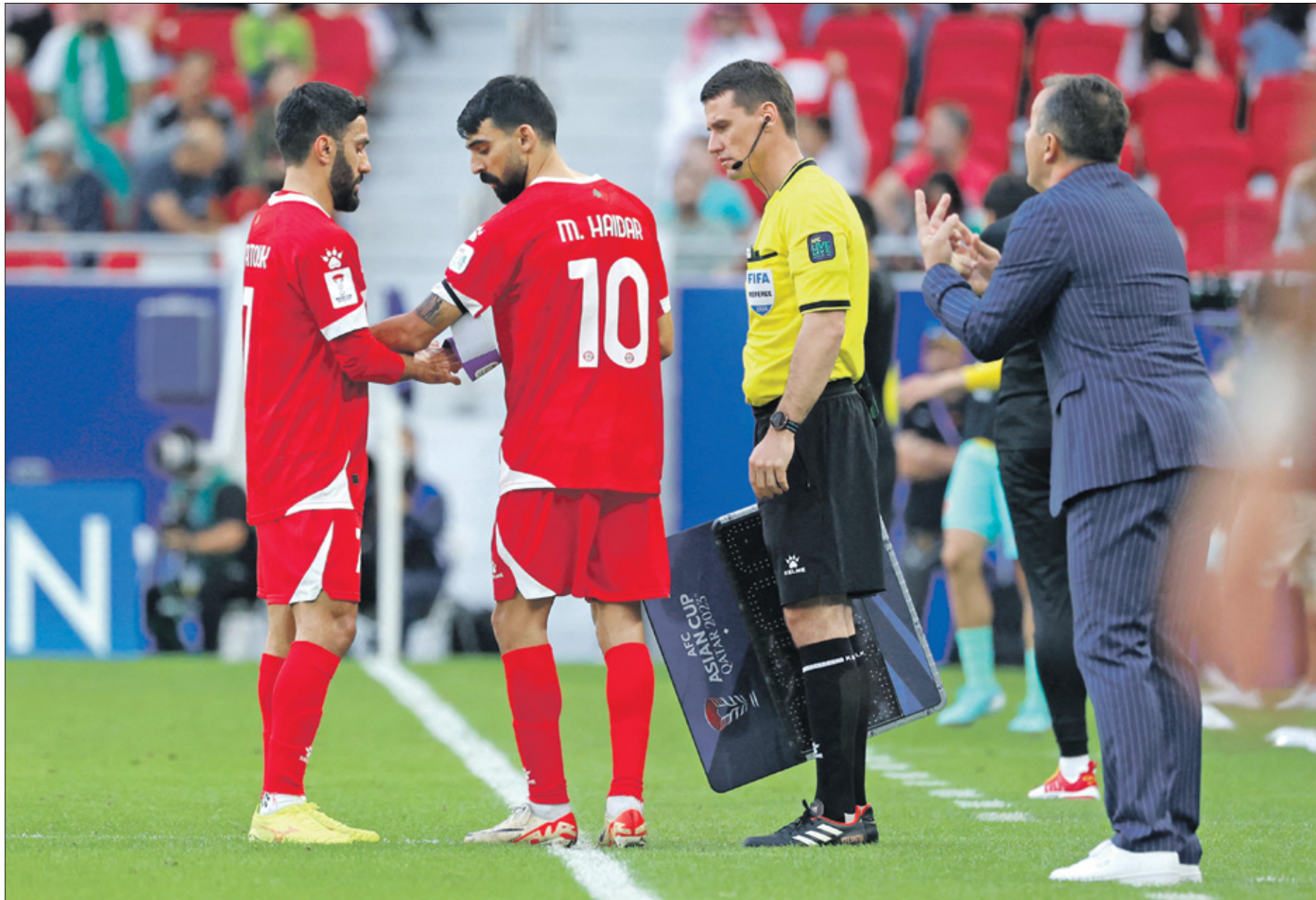
ملك لبنان احلح المركز الأخير في مجموعته بخسارتين وتعادل

وأوزبكستان وحتى فينتام، بعيداً عن خرج منهم ومن بقي في المنافسات لن نتجها هنا للمقارنت مع دول أخرى وسجورة تعيش ظروفاً صعبة، فحتى تبدأ الحل عليك التفكير فيما لديك وفيما