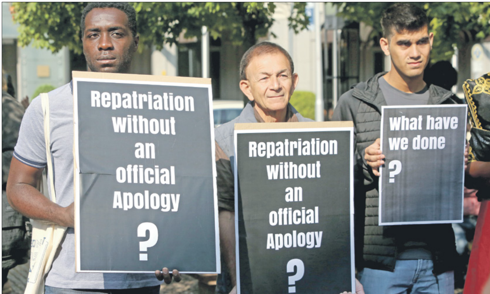
محتاطون ألمانيا المتعرض للناصبين عن الإبادة التي ارتكبتها هناك بين 1904 و1906.

غير أن ألمانيا اعتبرت أن اعترافها بالجريمة لا يفتح الطريق لأي طلب تعويض قانوني، وأن الأروال التي مدفعتها لناميبيا ليست تعويضات على أساس قانوني، الأمر الذي أعاق التوصل إلى اتفاق رسمي بين الحكومتين الألمانية والناميبية، يتيح طي صفحة الإبادة الجماعية بحق الهيريرو