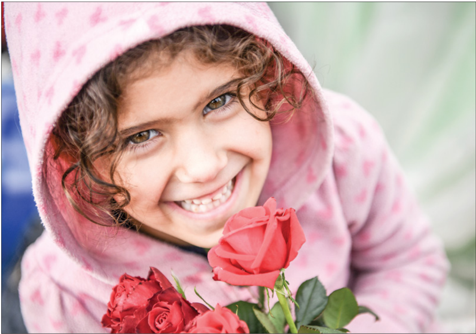
فهد واحد محبات ربح (بعد زقوت / الصور)

يقول مؤسس شركة الأزياء الألمانية GmbH، الفنان القفا الأحد الماضي خطاباً تضامنياً مع فلسطين خلال عرضهما في أسبوع الموضة في باريس، إن زملاءهما في قطاع الأزياء تحسّون التضامن علناً مع حرب إسرائيل على غزة. وعندما سُئل عن رد فعل قطاع الأزياء تجاه العدوان على قطاع غزة، حيث استشهد أكثر من 25 ألف فلسطيني، قال بنجامين هوسبي وسرحات إيشيك: «نعم، لقد كان صمناً مطبقاً»، أوضح المتحدثان موقع ميلد إيسيت أي: «نعمل إن لدينا خلفاء عدة خلف الفنون على السواء، أعترفت باركر في هذا البيان بأن تصريحها قد أعطى انطباعاً خاطئاً تماماً، وقوض الثقة في الأنشطة التي يقمها متحف فريك. كما أعترفت مديرة المتحف إن هذا الأمر يعد فرصة للتعلم من الأخطاء، معربة عن أملها في استعادة الثقة المفقودة نتيجة لهذا القرار الخاطئ.