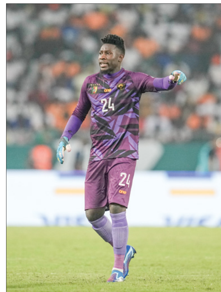
أونانا سيفتح على مفاعد بداءه منتخب الكاميرون

عاد حارس الرمي أندريه أونانا إلى إثارة المشاكل في منتخب الكاميرون، الذي ضمن التأهل إلى دور الـ 16 في بطولة كأس أمم أفريقيا، المغامة حالياً في ساحك العاج، عقب الفوز الصعب على غامبيا بثلاثة أهداف مقابل هدفين. وبحسب موقع «أفريقيا سبورتنس» المتخصص في أخبار القارة السمراء، فإن أونانا أثار المشاكل مرة أخرى في منتخب الكاميرون، بعدما حاول الضغط على الجهاز الفني من أجل ضمان منافسات الجولة الثالثة والأخيرة من مرحلة المجموعات في بطولة كأس أمم أفريقيا لكرة القدم. وتابع أن أندريه أونانا دخل في مشكلة أخرى مع صامويل إيتو رئيس الاتحاد الكاميروني لكرة القدم، بعدما حاول التدخل في عمل الجهاز الفني لمنتخب «الأسود الغير مروض»، ما جعل الأمور تتفاقم بين جميع الأطراف وأوضح بالفول إن صامويل إيتو وجه رسالة مباشرة إلى أندريه أونانا بأنه سيكون جالسا على مفاعد البدلاء، خلال المواجهات القادمة، بعدما جرى الاتفاق بين جميع لاعبي منتخب الكاميرون، على أن المكان الأساسي في حراسة الرمي يعود إلى فابريس أوندا، الذي يتفاهم بشكل جيد مع المدافعين، ولديه الخبرة في قيادة الدفاع بالإنارة إلى سونغ، لا يريد منه أندريه أونانا أي فرصة خلال المباراة القادمة لمنتخب الكاميرون في دور الـ 16، لأن مكانه الوحيد، هو الجلوس على مفاعد البدلاء ومتابعة اللقاء فقط.