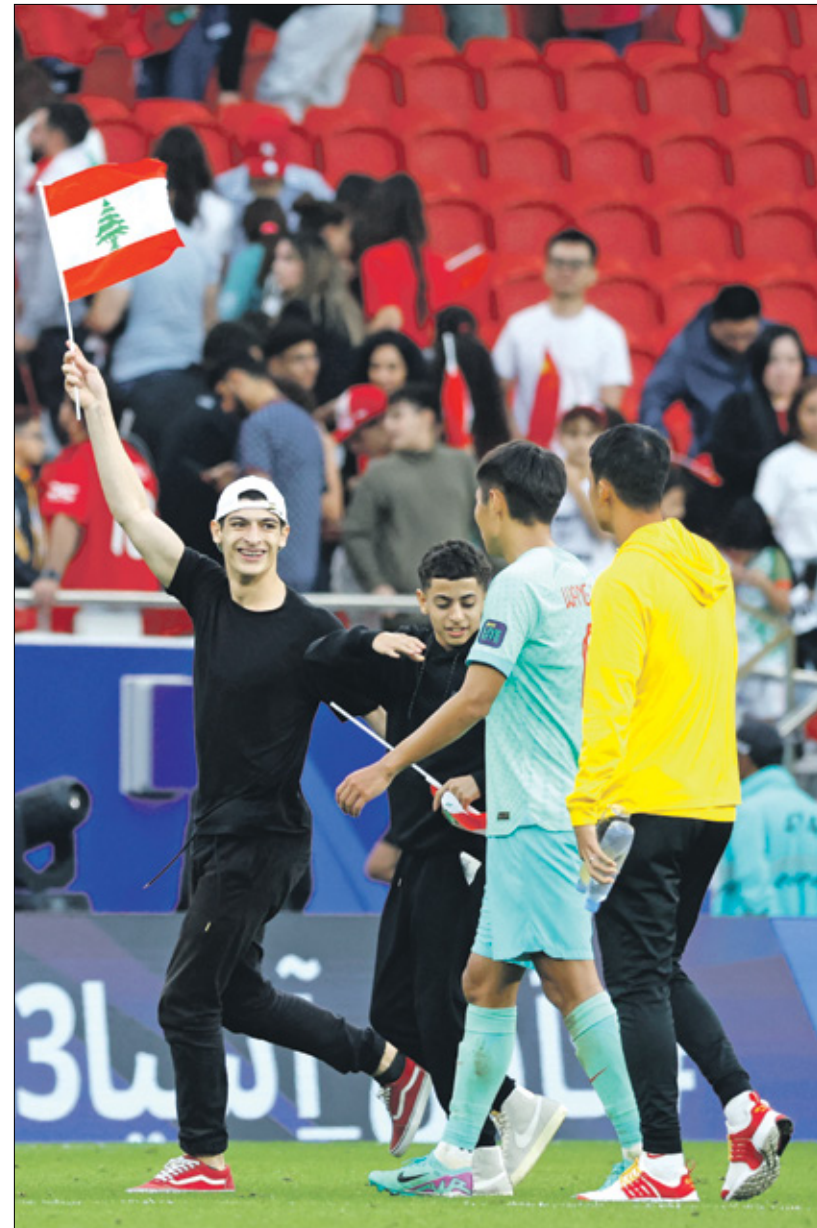
ملك سعيش الجيك القادم نفس معاناة الجيك الحالي كرويا؟

موصدة الأبواب، تحدد معايير كل مباراة باهواء غير مفهومة، وكان مباراة كرة قدم تستشعل فتنة داخل البلاد، ثم يأتي اللاعب الذي ينافس في دوري ضعيف المستوى فنبتا بحضور عشرات المشجعين للعب أمام الآلاف في الخارج من أبناء الوطن أو حتى الخصم والأمر الذي لن تكون متعاداً عليه سيشكل رهبة وخوفاً لتسبب من اللاعبين وارتباكاً للبعض بسبب الضغط، لا سيما الشباب منهم، تنتقل إلى الدوري المحلي الذي يعاني بحكم الظروف الصعبة للاعب وعدم قدرة اللاعبين حقيقة على التطور، ما بات يدفع من رواتب قد لا يكون