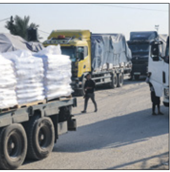
طوابير الجوع في غزة

هاجم الجوع سكان قطاع غزة في ظل تشديد الحصار من كافة الجوانب وضعف دخول المساعدات (الصوره) وتدمير العودان