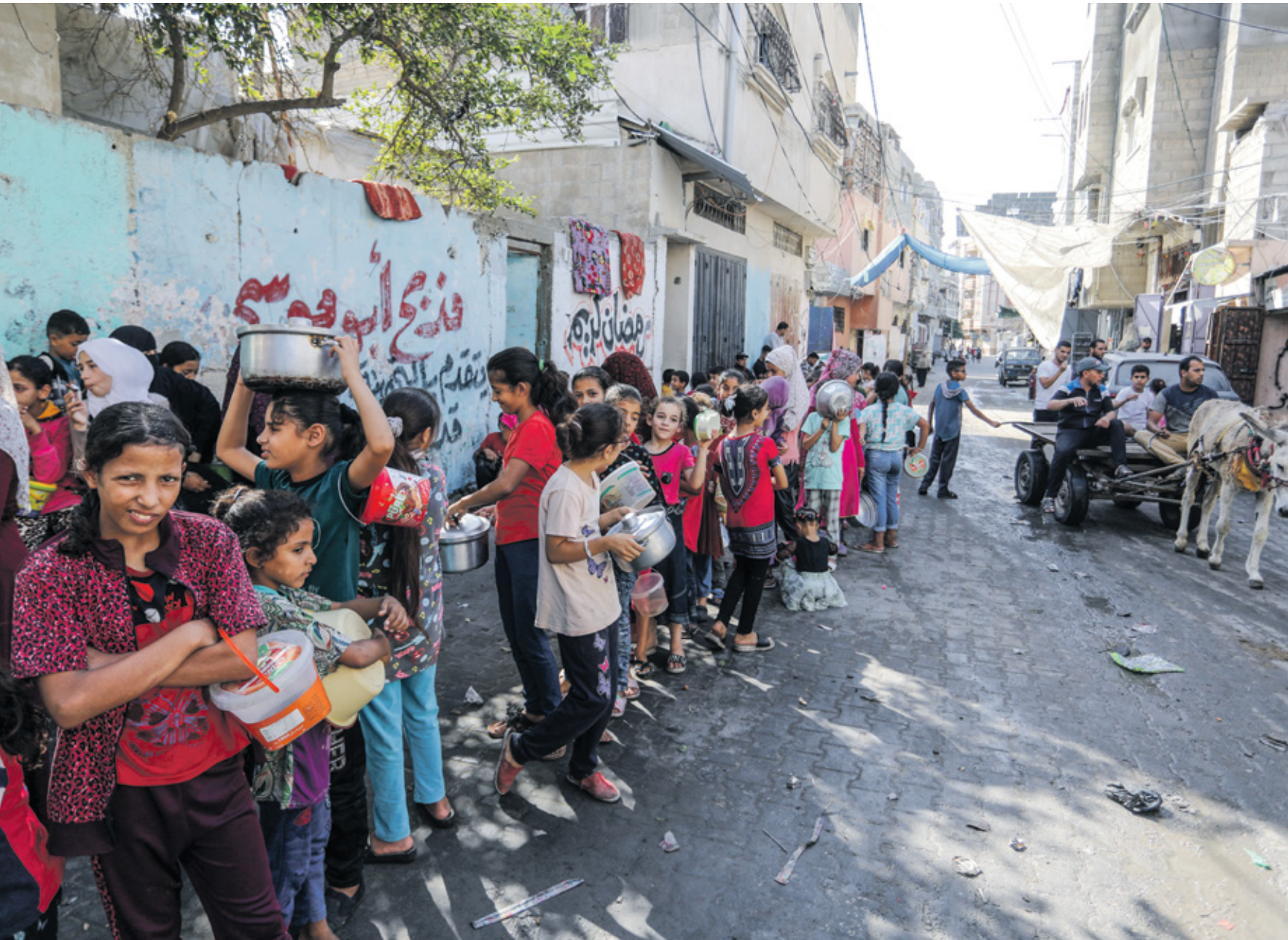
طواير الجوع في غزة عند الرجم الحطيط(الناطوق)

وعلى وفق الضغوط الدولية، عقدت إسرائيل إدخال إمدادات إنسانية من مصر إلى قطاع غزة عبر ممر رفح البري، واقتصرت على نقل 100 شاحنة يوميا، وهي معدلات لا تعادل عن متوسط حمولة 500 شاحنة كانت تدخل لتلبية الاحتياجات الإنسانية إلى القطاع قبل السابع من أكتوبر الماضي.