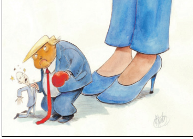
ترامب في وضع حرج الات (جون ماكيني، كار تون موفمنت)

كانت الفزاعة ترتعد خوفاً وهي تدون أمرها الأخير لرهط الأرانب خلف الحدود، بأن عليهم أن يتحركوا قبل فوات الأوان لحمايتهم، وإلا سيخسرون خوفهم المزمّن منها. هذتتهم بأعنف العبارات، كما كانت تفعل سابقاً، عندما توجه إليهم الأوامر واجبة النفاذ: «ضاعفوا الضرائب على شعوبكم ولا تتركوا لهم خياراً غير اللهاث خلف الرغيث». «إياكم أن تفكروا يوماً بالوحدة». «حاذروا من تسلح جيوشكم إلا لغايات الحروب البينية بينكم، أو لقمع المعارضين». «لا تفكروا بالتطوير والتحديث، بل بالتجهيل والتضليل». إلى آخر تلك الأوامر التي لا تملك الأرانب خياراً إلا تنفيذها، حفاظاً على جورها. والأهم أنها كانت تراهن على «الفزاعة» لحماية عروشها الترابية، فقد رأت فيها «قوة جبارة» كقيلة بردع الخارج والداخل معاً، وكثيراً ما خوّفت بها شعوبها كما تخاف هي منها؛ لأنها لم تعتقد يوماً أنها تتلقى أوامرها وتعليماتها من «فزاعة»، بل من غول رهيب قادر على سحق كل شيء أمامه. كان ذلك سابقاً، قبل أن يتغلب سرب عصفائر جريء على خوفه، ويقرر اعتلاء رأس الفزاعة، وراح يمعن فيها نقراً وتكديلاً، على مرأى من أمة الأرانب التي تفاقم رعبها وهي ترى «فزاعتها» تنهار أمامها. شعرت الأرانب بضرورة التحرك، حفاظاً على رعبها، وشعرت أن هناك من يهدد هذا الخوف الذي أدمنته. كان عليها أن «تحمي الفزاعة لكي تحميها الفزاعة». تحت هذا الشعار عقدت الأرانب قمتها.. قمة الخوف.