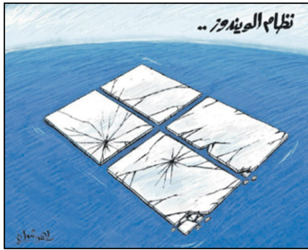
عطل رقمي حطم صورة شركة ويندوز