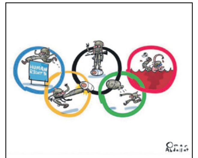
الاحتلال الصهيوني في اولمبياد باريس (عمر العبدالات، فيسوان)