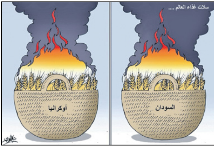
سلات غذاء العالم تحترق (الدرقاوي، موقع الصراة)