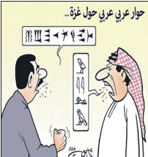
حوار العرب حول غزة هو الاحوار (أيوب، الخبر التونسية)