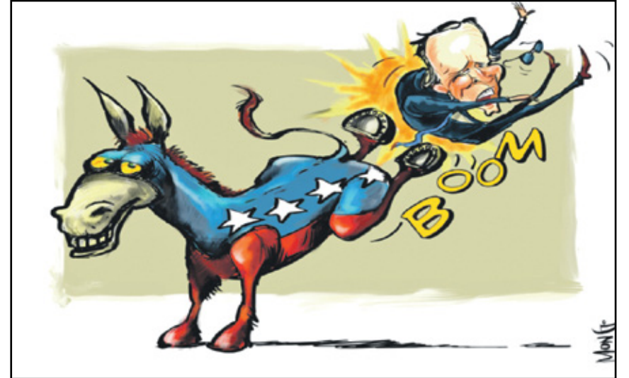
حمار الحزب الديمقراطي يرفس بايدن بعيداً (رامون بايز، كار تون موفمنت)