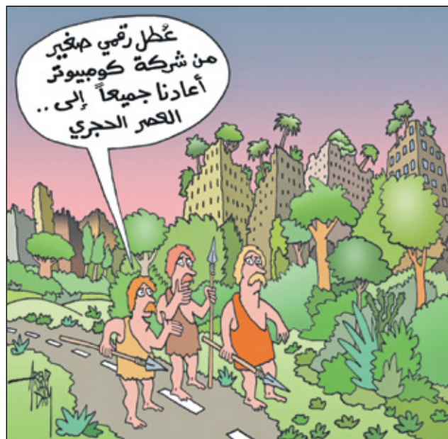
ازد فانداه، كينغ كار تونز