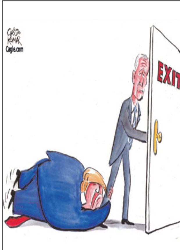
ترامب يتمنى عودة بايدن المنافس الضعيف (كريستو كومانيسكي، كينغ كار تونز)

أخيراً خضع الرئيس الأميركي جو بايدن لضغوط حزبه وأعلن خروجه من السباق الرئاسي، ولعل نائبته كامالا هاريس الأوفر حظاً لخلافته كمرشحة عن الحزب الديمقراطي. هذه الخطوة ستثير بلا شك قلق المرشح الرئاسي الجمهوري دونالد ترامب، الذي اعتاد السخرية من «سليبي جو» أو جو الناثم، إليكم بقية من الكاريكاتير حول تنحي جو بايدن.