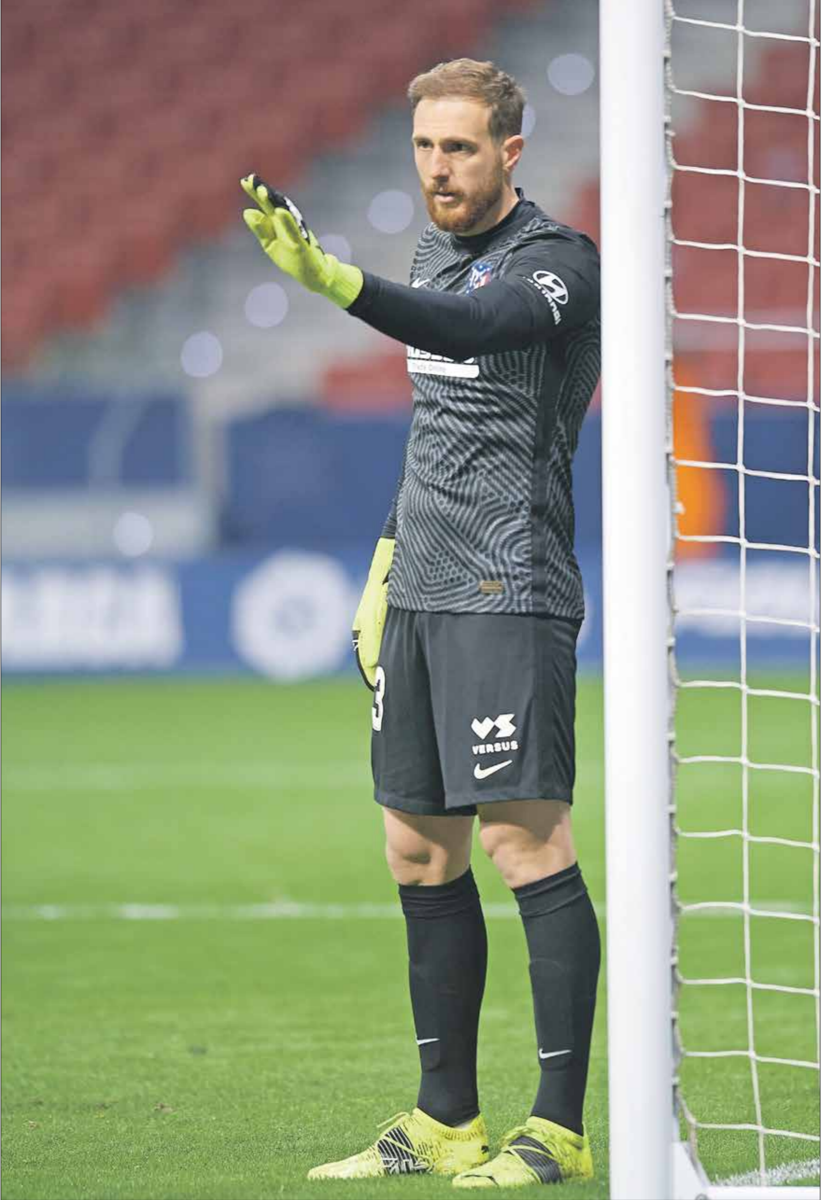
يان اوبلاك يقدم عروضاً قوية مع مرمرى التريكو

وحقق فريق برشلونة في الموسم 19 فوزاً، مع 5 تعادلات و4 انتصارات، وسجل الفريق 67 هدفاً، وهو أقوى خط هجوم حالياً، في وقت تلقت الشباك 24 هدفاً بعد 28 لقاء حتى الآن، وساهم الحارس تير شتيغن في التصدي لفرص خطيرة من المنافسين في «الليغا». وتعرض مرمى الحارس الألماني مارك تير شتيغن، لـ91 تسديدة في جميع المباريات في بطولة الدوري، وتصدى لـ71 تسديدة وفرصة في جميع المباريات، وخرج الحارس الألماني شياك نظيفة في 9 مباريات في 22 لقاء نجبه حتى الآن في الدوري. وساهم تير