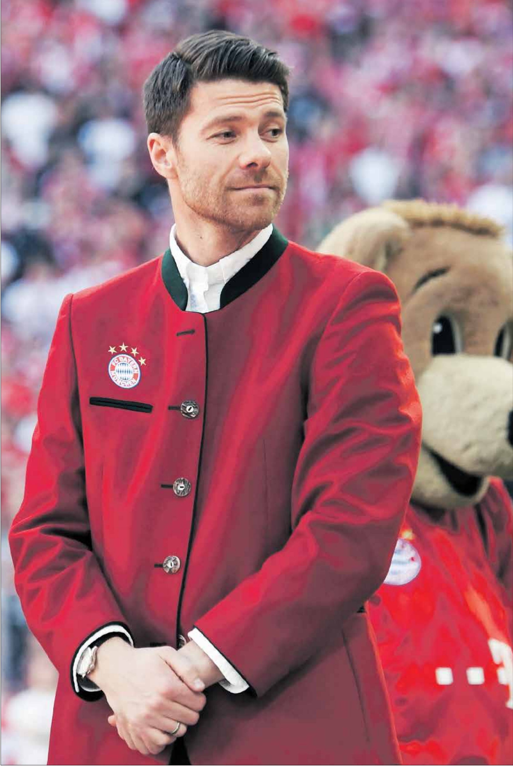
الونسو يبدأ رحلة جديدة انطلاقاً من الموسم المقبل

أكدت تقارير رياضية ألمانية اقتراب الإسباني تشابي الونسو من قيادة فريق بوروسيا مونشنغلادباخ، وذلك وفقاً لما نشرته صحيفتا «سبورت بيلد» و«بيلد» المحليتان. وفي حال توليه المسؤولية، سيكون الونسو، البالغ من العمر 39 سنة، هو ثاني إسباني يقود فريق في منافسات «البوندسليغا»، بعد بيب غوارديولا مع فريق بايرن ميونخ.