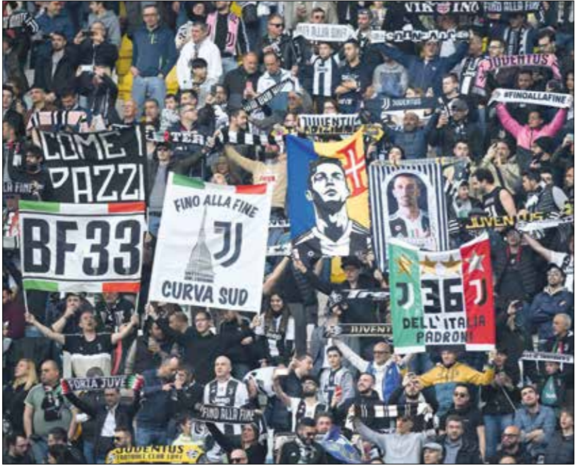
يوفنتوس يطعم إله محمد لقب دوري الابطال

إيجواين مع يوفنتوس لمدة أربع سنوات، لكنه أعير إلى ميلان في 2018-2019، كذلك أمضى جزءا من الموسم الماضي في مهاجم نابولي وريال مدريد ويوفنتوس السابق الخضوع للفحص الطبي. ولعب