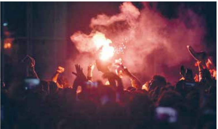
وسائل التواصل الاجتماعي باتت أقوى من المدرجات

وأصبح عالم «السوشال ميديا»، هو الجمهور الحقيقي في كرة القدم، بعدما تحولت المسابقات المحلية إلى مباريات صامتة خالية من المدرجات، وأصبح