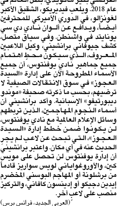
العربي الجديد، فرانس برس)