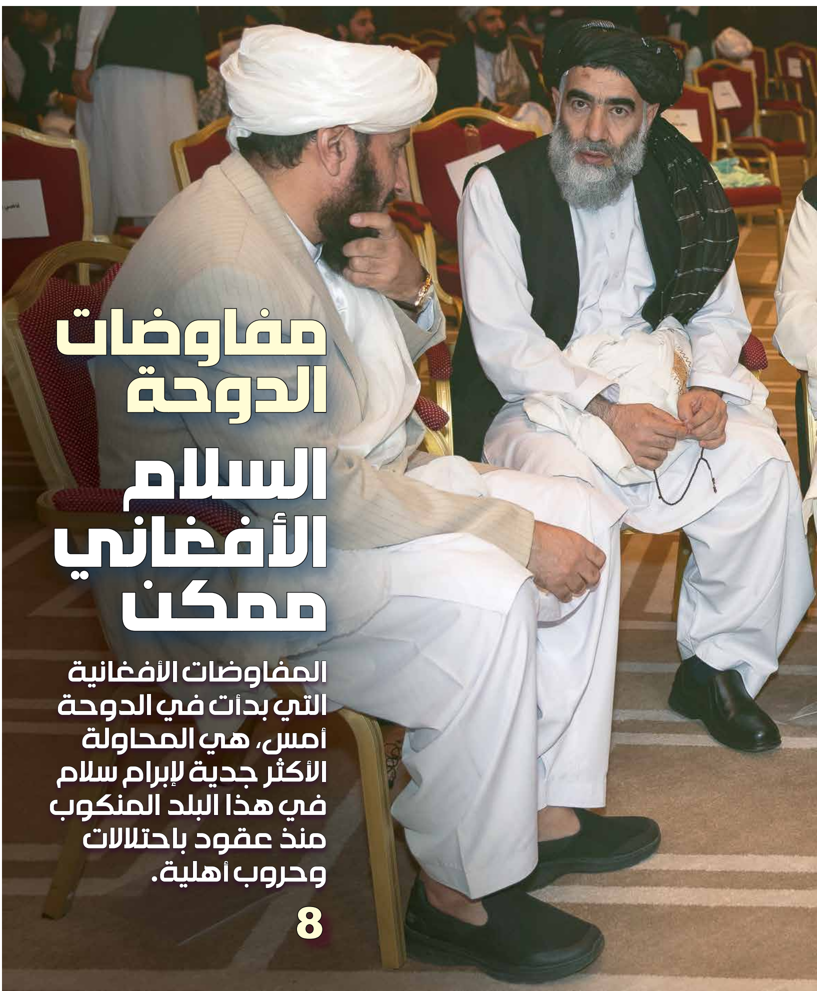
علي هامش الجلسة الافتتاحية في الدوحة أمس (معتصم الناصر)