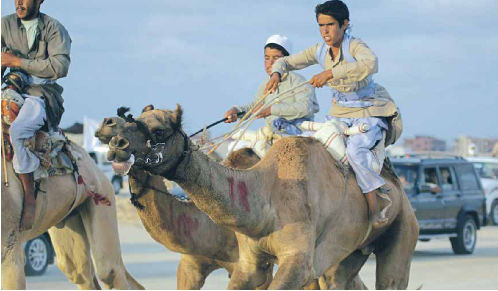
مهدت القبائل البدوية بجهودها الذاتية مضمار السباق واماكن الفعاليات المصاحبة

بين يومي 12 و13 سبتمبر/ أيلول الجاري، تشهد قرية الرملة انطلاق فعاليات «مهرجان سراييط الخادم للهجن والتراث السينائي»، إذ يتنافس فيه حوالي 230 جملاً