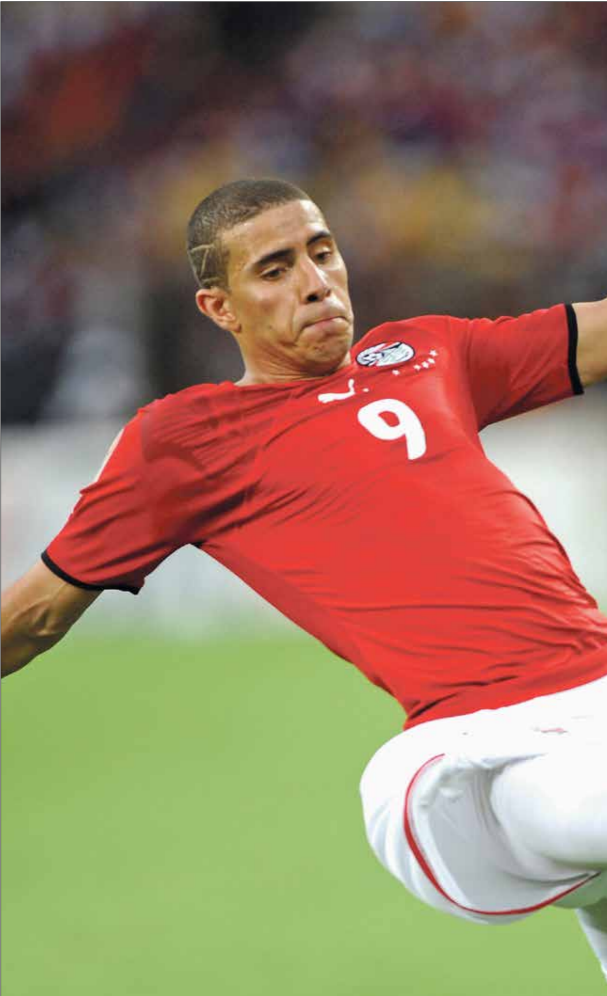
الشك لزمن اذ كانه منتخب مصر عام 2006