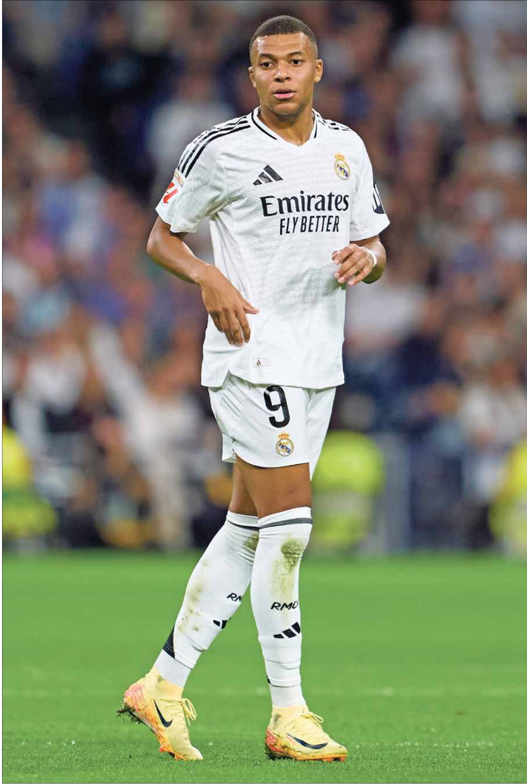
لم يتأقلم مبابي مع طريقة لعب ريال مدريد

تشعر إدارة نادي ريال مدريد الإسباني، بالندم الشديد على إتمام صفقة النجم الفرنسي كيليان مبابي، في الصيف الماضي، بسبب تراجع مستواه الفني والبدني بشكل كبير، بالإضافة إلى دخوله في مشاكل مع عدد من نجوم الفريق الملكي، وفق ما أكدته صحيفة ديلي ميد البريطانية.