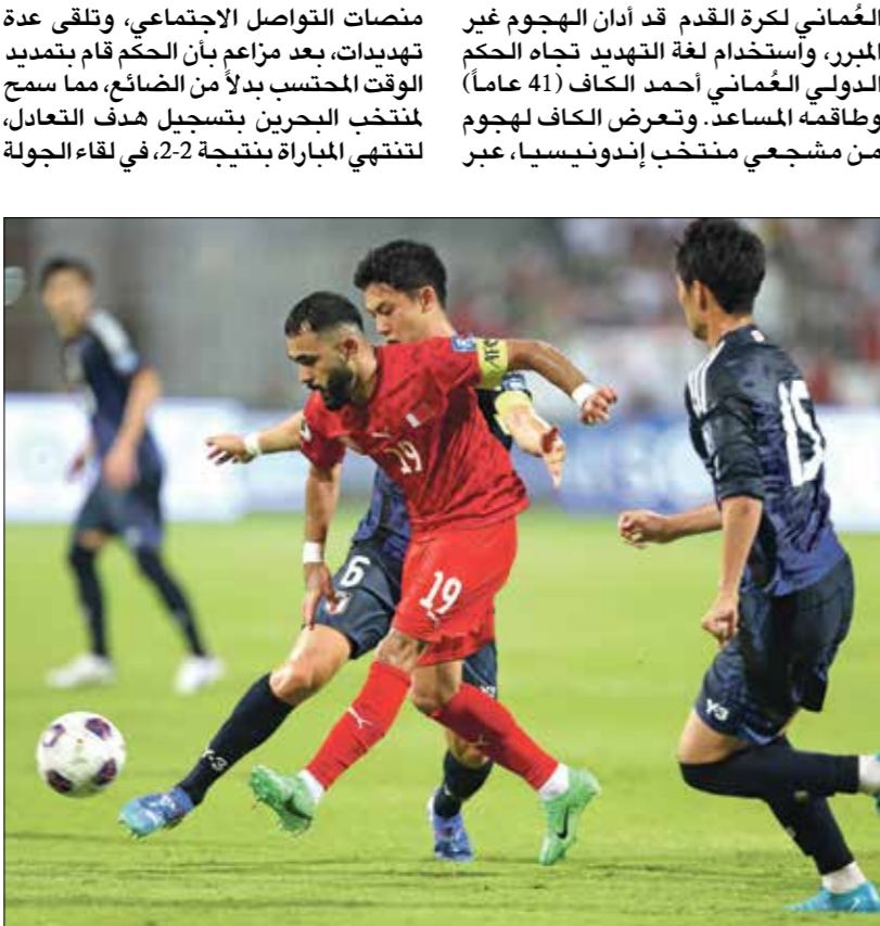
يافع منتخب البحرين في حذر مفعده مونديال 2026