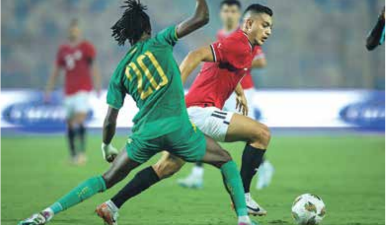
عز مصطفى محمد عن لوجهه من لمرضه للاصابة

اللعب على العشب الصناعي على العمود الفكري للاعب بسبب إصابة سابقة. ولم تتوقف الحالات عند محمد صلاح فقط، بل امتدت لتشمل لاعبا آخر من المحترفين، وهو مصطفى محمد هداف نادي نانت الفرنسي، بداعي تعافيه قبل اسابيع قليلة من إصابة قوية في الركبة، ورغبة فريقه في تجنب مشاركته في لقاء منتخب موريتانيا الثاني، والبتعاد عن العشب الصناعي، فلم يجد المدير الفني للمنتخب المصري، حسام حسن، سوى ورقة الموافقة على طلي لاعبيه، واستبعد الثنائي محمد صلاح ومصطفى محمد من القائمة التي سافرت إلى موريتانيا، وتمكنت من الفوز بهدف دن رد والتاهل مكرراً إلى نهائيات بطولة كأس الأمم الأفريقية لكرة القدم، للمرة رقم 27 في تاريخ الكرة المصرية.