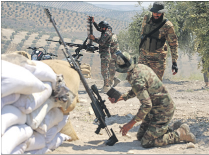
تدريب عناصر الجيش الوطني، عفرين 8 أغسطس 2024

وكانت علاقة «الجبهة الشامية» مدات في التراجع مع الجانب التركي مطلع الشهر