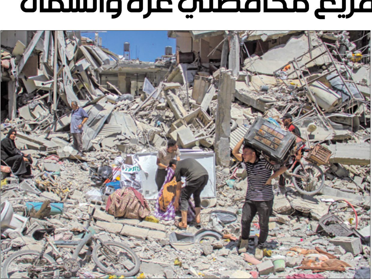
منظر في مخيم جباليا، 31 مايو

غزة)، وتطويق المنطقة التي تجلب المواطنين منها وإعلانها منطقة عسكرية مغلقة، ومنع الإمدادات عنها إلى «طيطهريها وهزيمة الإرهابيين المتخفي في المنطقة المُخلدة»، في موازاة ممارسة ضغط عسكري مكثف، وبعد تنفيذ الخطة في هذه المنطقة، يمكن التوجه وتنفيذها في أجزاء أخرى من القطاع.