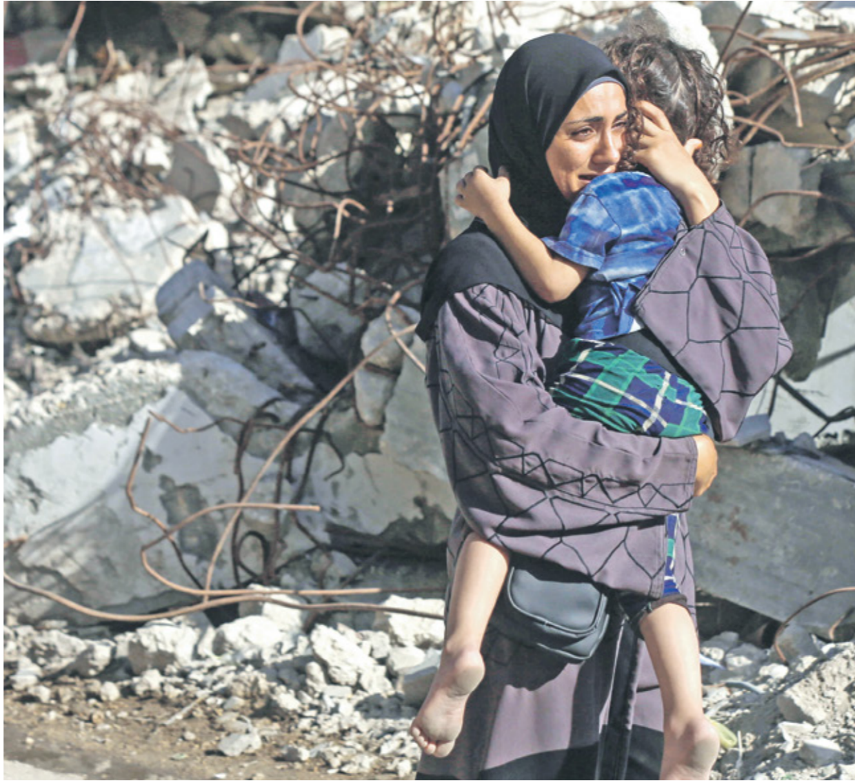
في مخيم البريج بغزة أمس

وفد إسرائيلي العاصمة المصرية الإحد الماضي، بناء على طلب من حكومة تل أبيب ووفقاً للمعلومات «العربي الجديد»، فإن الوفد الإسرائيلي ضم مسؤولين أمنيين واستفسارات من جانب المؤسسة الأمنية الأمتني على الحدود بين مصر وغزة، في دورة الاحتلال، حول حقيقة إقدام مصر على خطوات مخالفة لـ «ما جاء في الاتفاقيات الأمنية المرتبطة بمعاهدة السلام المؤقعة بـ«الاحتكاكات»، جراء العمليات العسكرية الإسرائيلية في محور صلاح الدين (فلالدي)، وبحسب المعلومات، فإن الزيارة التي جاءت، بناء على مطلب إسرائيلي،