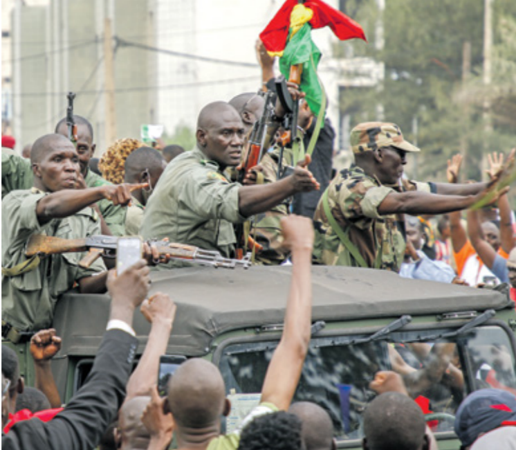
جنود الجيش الفلب في بامباكو، عقب انقلاب 18 أغسطس 2020