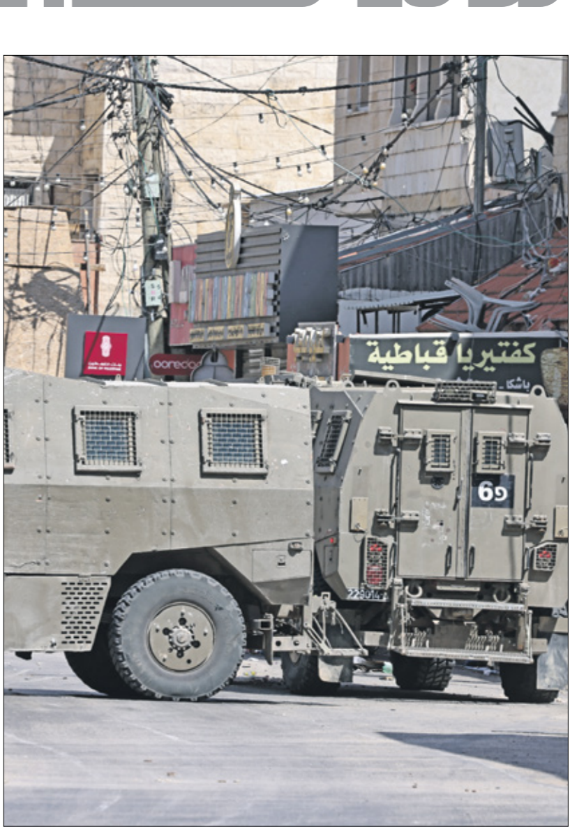
آلات الاحتلال في أحد شوارع قباطية أمس

بأنه «لا شك أننا تعرّضنا لضربة كبيرة لا بـ«متفق» يدعي أنه تائر ضد