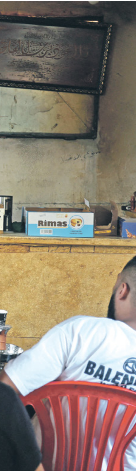
لبلاتيون يسلمون خطاب نصر الله في صيدا أمس