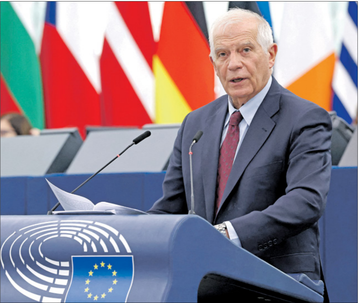
بوريل في مقر البرلمان الأوروبي بستراسبورغ

يفادر الإسباني جوزيب بوريل الشهر المقبل منصبه مفوض السياسة الخارجية، للاتحاد الاوروبي، وقد اضفت الحرب على غزة، صيغة اعتدال نادرة في الضرب من الصراع، علما ان خلفته سيعمل داخل الاتحاد ليية تميل أكثر لليمين واسرائيل