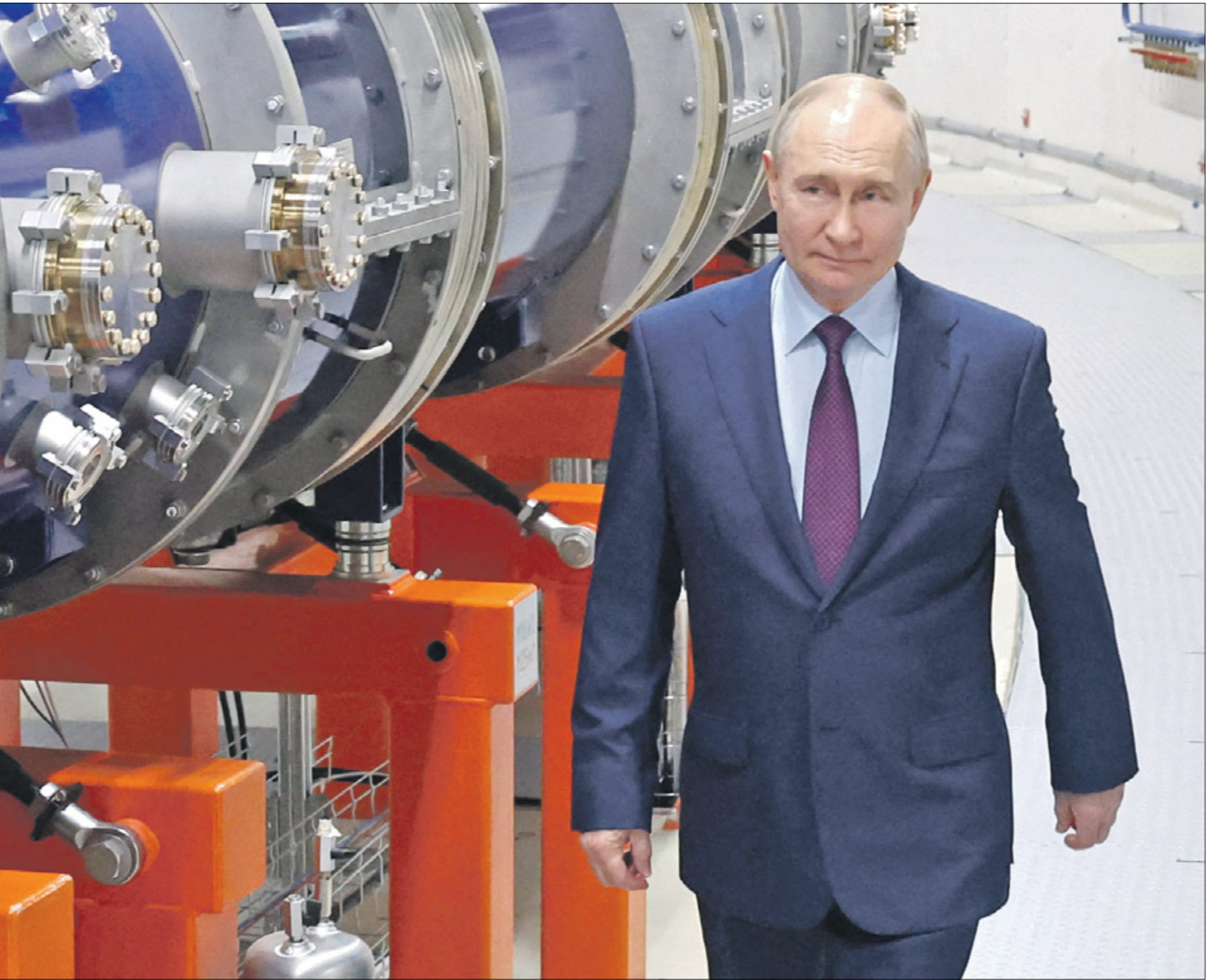
بوتن في المعهد المشترك للبحاث النووية موسكو، 13 يونيو 2024

من جهة أخرى، كان سيرغي كاراغانوف، المحلل السياسي والمختبر الروسي المغرب من الكرملين ورئيس الشرفي لمجلس السياسة الخارجية، أكدكم بأن العضوين