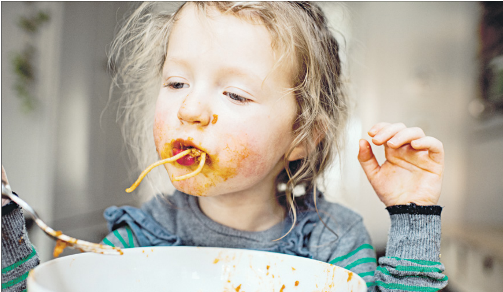
إشراك الأطفال في الطهي يساعدهم على تناول خيارات أكثر صحية

إرساء أنماط غذائية صحية للأطفال ضروري لنموهم وتطورهم بشكل سليم. لذا يُنصح بتقديم تنوع غذائي في كل وجبة، إنشاء روتين ثابت للوجبات، تقليل الأطعمة منخفضة القيمة الغذائية دون منعها