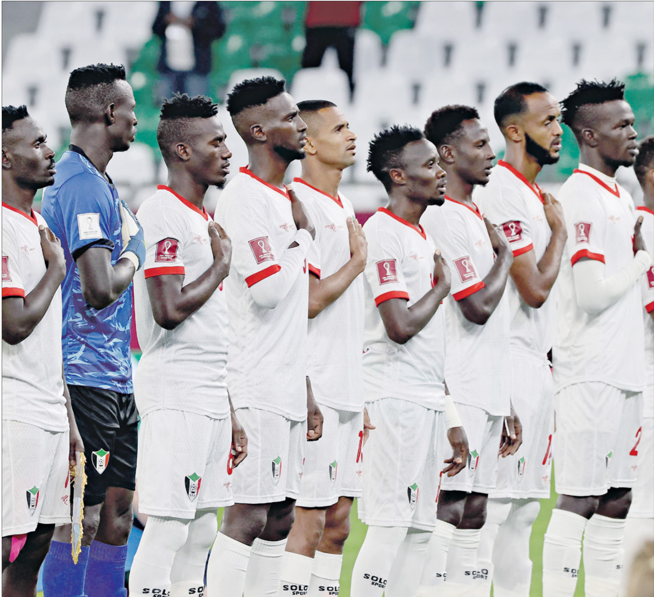
منتخب السودان يواجه الفوز ويسعون لتحقيق الفوز