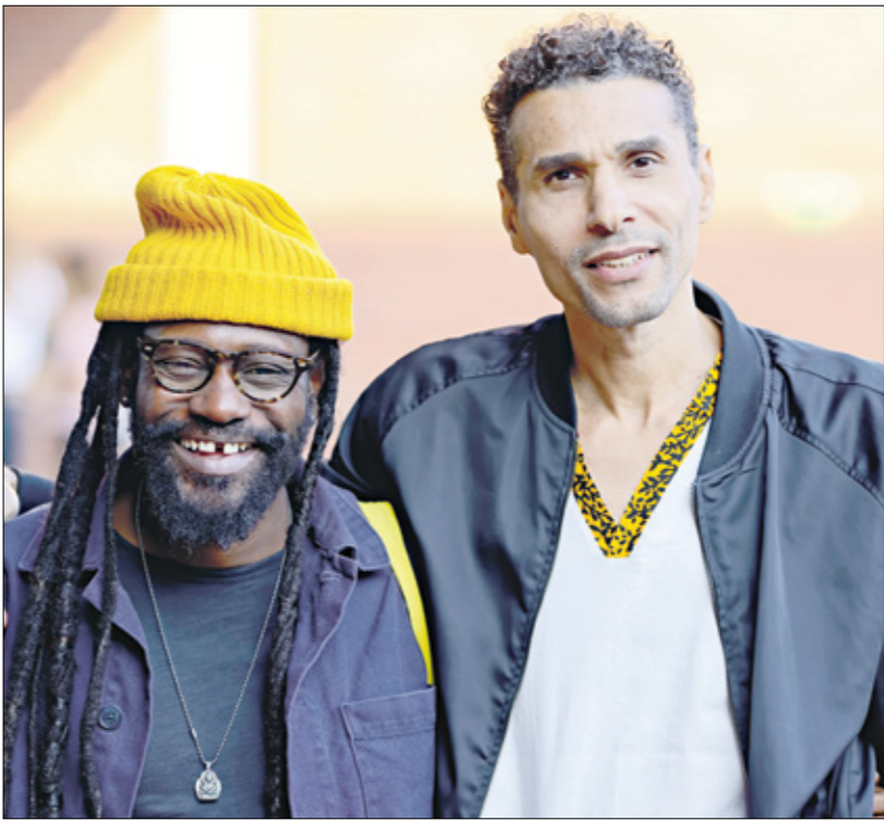
سوينيك والملحن نايضيم غلاسنو، مالدنيا في كولونيا 2024

المخيم مُصوّرة في الأردن)، أم مُكتربة جداً به، تزيده في امان، وتُحدّثه على العيش في برلين (يوهمها أنه هناك)، وتفرّج بخفره عندما تُخبرها بلقائه شاتلة سوريّة تُدعى يارا (السوريّة هالة رجب)، رغم أنّ لا مشاعر حدّ بينهما، بل مجرد معرفة وشيء من الاهتمام