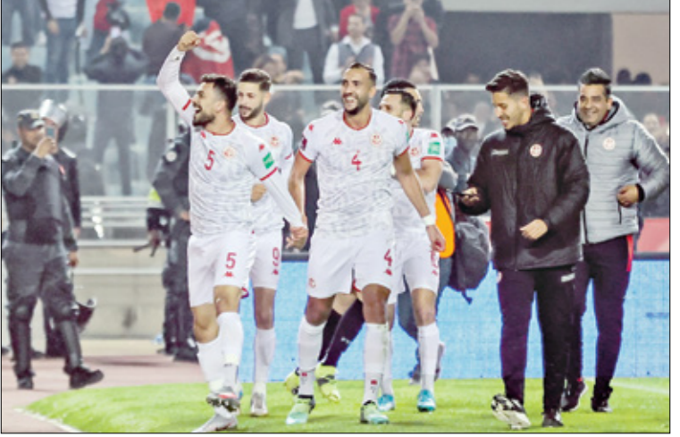
سور قرفاج يسعون للحفاظ على صدارة المجموعة

السابعة، وحسم المواجهة المباشرة مع بنين، وفي الوقت نفسه، خسارة أو تعادل منتخب رواندا صاحب المركز الثالث في الدحل برصيد خمس نقاط مع نظيره في نيجيريا المتصدر. وانتمشت أسام منتخب ليبيا فجأة في التصفيات، بعدما حقق الفوز على رواندا بهدف من دون رد في عقر داره، فيما تعادل منتخب بنين مع نيجيريا في ملعب الأول، ليودون من بعد إلى السباق، ولكنه لا يزال في المركز الأخير، ويخوض منتخب ليبيا المواجهة مع مديره الفني ناصر الحضيري،