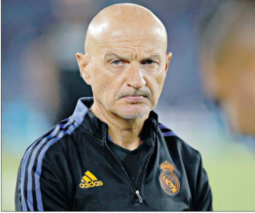
يعالبي بيللوس من أزمة لفة مع بعض لاعبي الريال

ومن جانبهِ، رد بيختوس على الاتقادات قائلاً: «إن الإصابات تعود إلى جدول المباريات المزحم وقد تم تقارب كافة اللاعبين للمخاطر». وهو يرى أن فترات الجبايات بشكل مكثف هو العامل الرئيس وراء تزايد الإصابات، وليس النقص في أساليبه التدريبية. ومع ذلك، يظل الإحساس بعدم اصطلاحه بمسؤولياته بخصوص هذا الموضوع هو السمة التي تميز عالمية الأراء المنقذة له، وفي ظل هذه الأجواء المشدودة، يظل الحديث عن إعادة هيكلة الفريق الإداري والفني في ريال مدريد وأردأ.