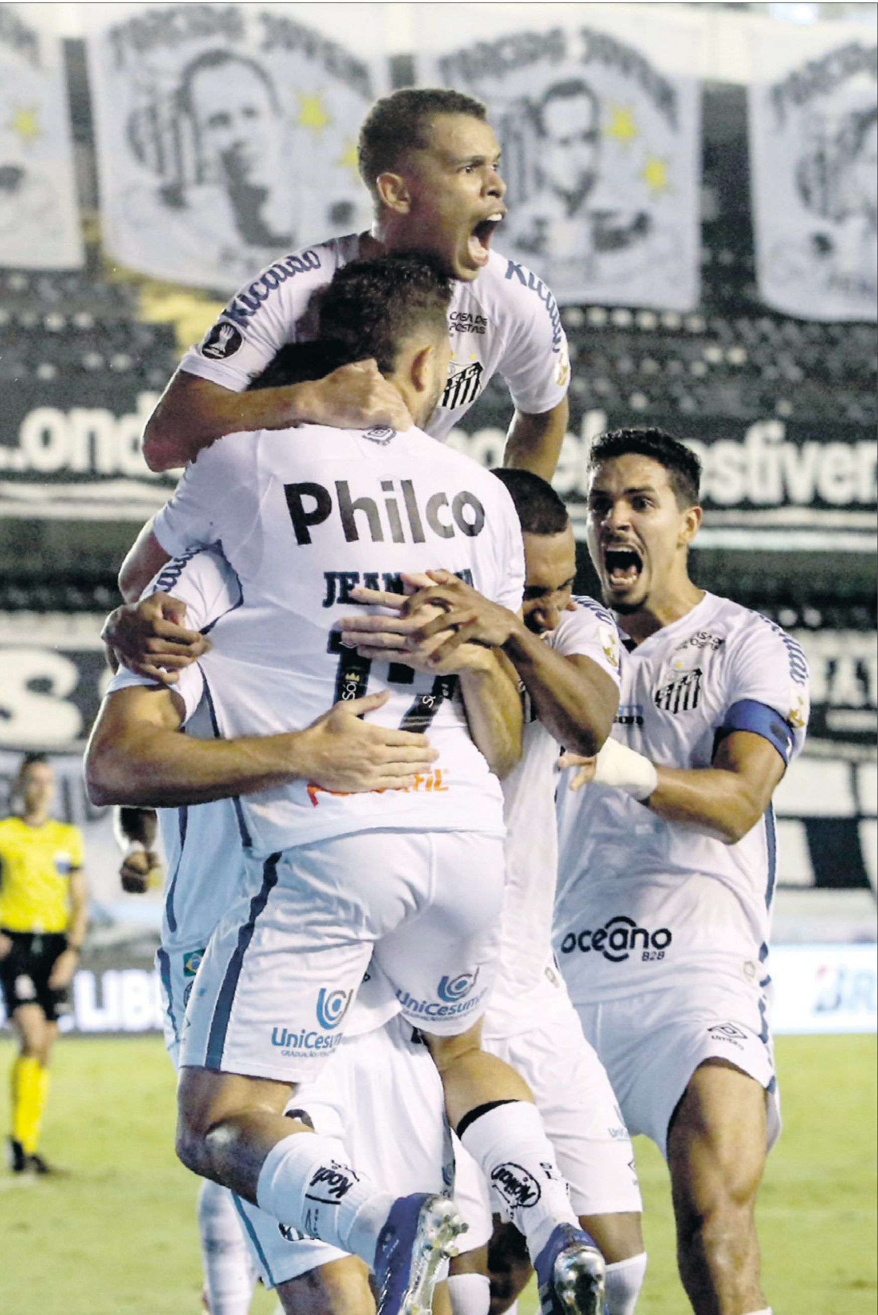
سانتوس اكد احرف الندية في البرازيل