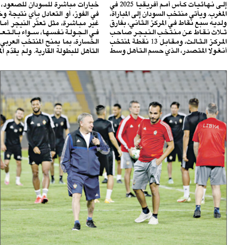
منتخب ليبيا احيا اماله بالتأهل الى امم افريقيا

نتيجة الأنتظار صوب حبل صومالي يتحدد مرة أخرى، وللمرة الأخيرة، حينما يلتقي منتخب «صقور الجديان» نظيره في أنغولا في المجموعة السادسة من التصفيات المؤهلة إلى نهائيات كأس اسم أفريقيا 2025 في المغرب. ويأتي منتخب السودان إلى المباراة، ولديه سبع نقاط في المركز الثاني، بفارق ثلاث نقاط عن منتخب النيجر صاحب المركز الثالث، ومقابل 13 نقطة لمنتخب أنغولا المتصدر، الذي حسم التأهل وسط