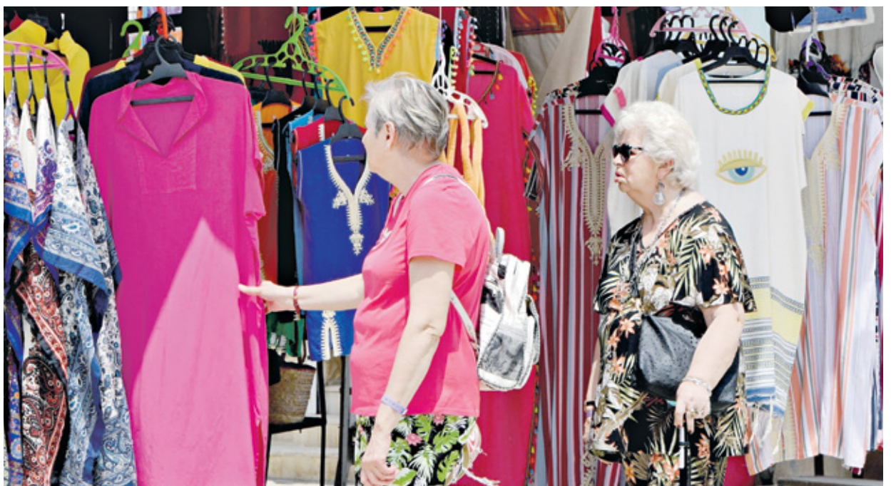
ملجر ملابس في سوق تجزيرة حربة السياحة في تونس، 11 مايو 2023 (تونس برس)

وتتطلب التية تعديل حدود الكربون التابعة للاتحاد الأوروبي، والتي تم إطلاقها رسمياً في أكتوبر/تشرين الأول عام 2023، من المستوردين الإبلاغ عن انبعاثات الغازات الدفيئة المباشرة وغير المباشرة المضمنة في السلع التي يستوردونها. واعتباراً من يناير/كانون الثاني من عام 2026، سيعمل الاتحاد على فرض تعريفات جمركية على الواردات من البلدان التي لا تقوم بتسعير الكربون بسعر السوق في الاتحاد، مما