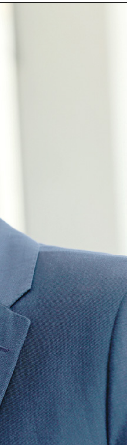
وزير الزراعة اللبناني عباس الحاج حسن

■ ما هي أكثر القطاعات التي تأثرت؟ وكم يبلغ عدد الأراضي المدمّرة بالكامل أو المتضررة جزئياً من جراء القصف الإسرائيلي؟