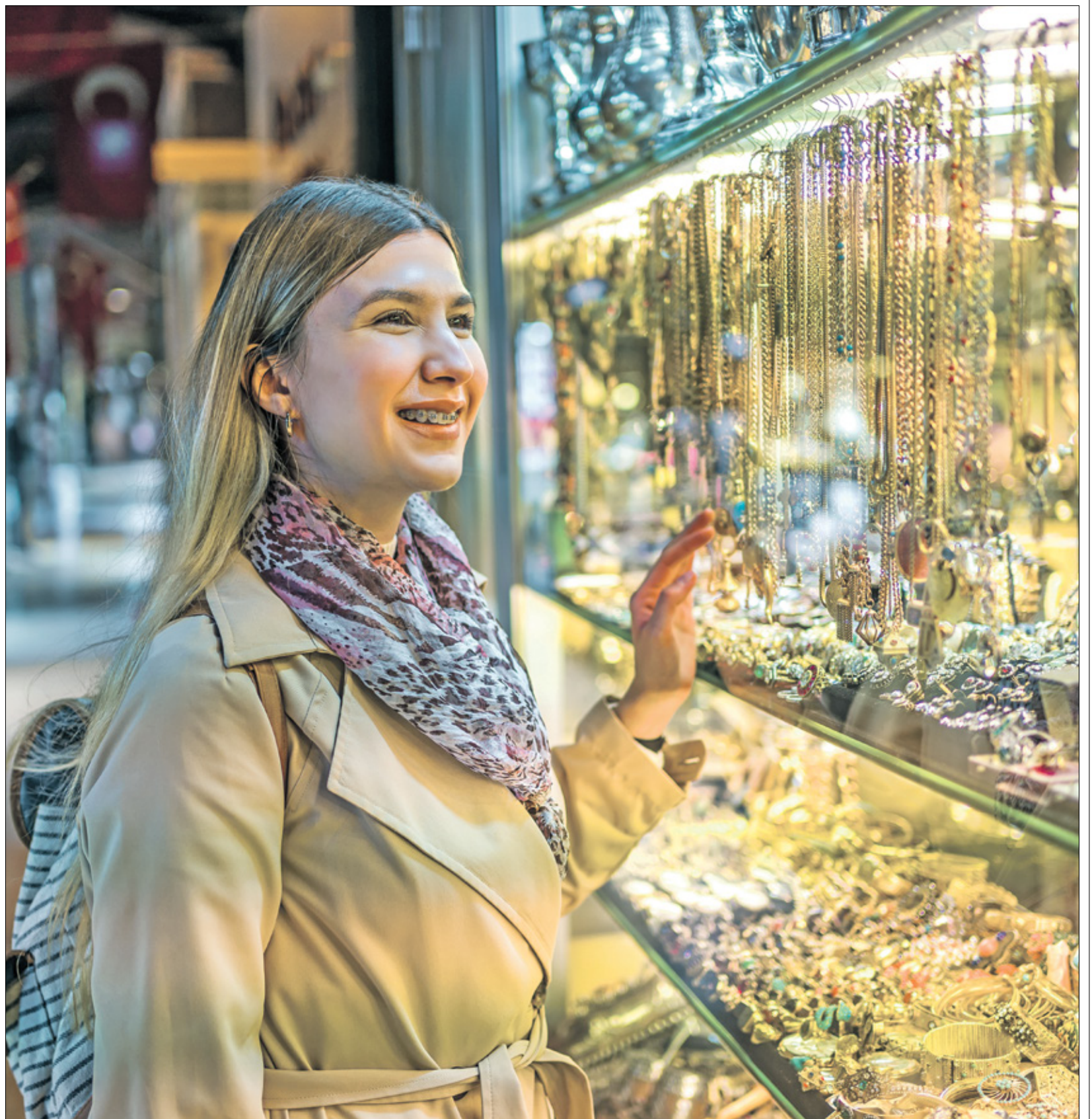
مشغولات ذهبية في متجر مجوهرات بإسطنبول، 5 مايو 2023

أفريقيا لكرة القدم في 2025 وكأس العالم في 2030. وقد ساهم فصل الصيف في دعم عدد السياح الوافدين، حيث بلغ عددهم في يوليو/تموز وأغسطس/آب حوالي 4,4 ملايين سائح، بزيادة بنسبة 21% مقارنة بصيف 2023، وهو ما يفسر بالعودة القوية للمغتربين الذين يقدر عددهم في الصيف بحوالي 3 ملايين شخص. ومنتظر أن يتجاوز عدد السياح في العام الحالي توقعات الحكومة، التي راهنت عبر خارطة الطريق التي كشفت عنها في العام الماضي، على جذب 17,5 مليون سائح في أفق 2026. وكانت إيرادات السياحة قد سجلت، حسب التقرير السنوي لمكتب الصرف الحكومي، ارتفاعاً بنسبة 11,7% في نهاية العام الماضي، لتصل إلى 10,59 مليار دولار، ما يمثل 30% من رصيد المملكة من النقد الأجنبي. ويتوقع بنك المغرب أن تصل إيرادات السياحة إلى 11,2 مليار دولار في 2024، بزيادة 7,1%، علماً