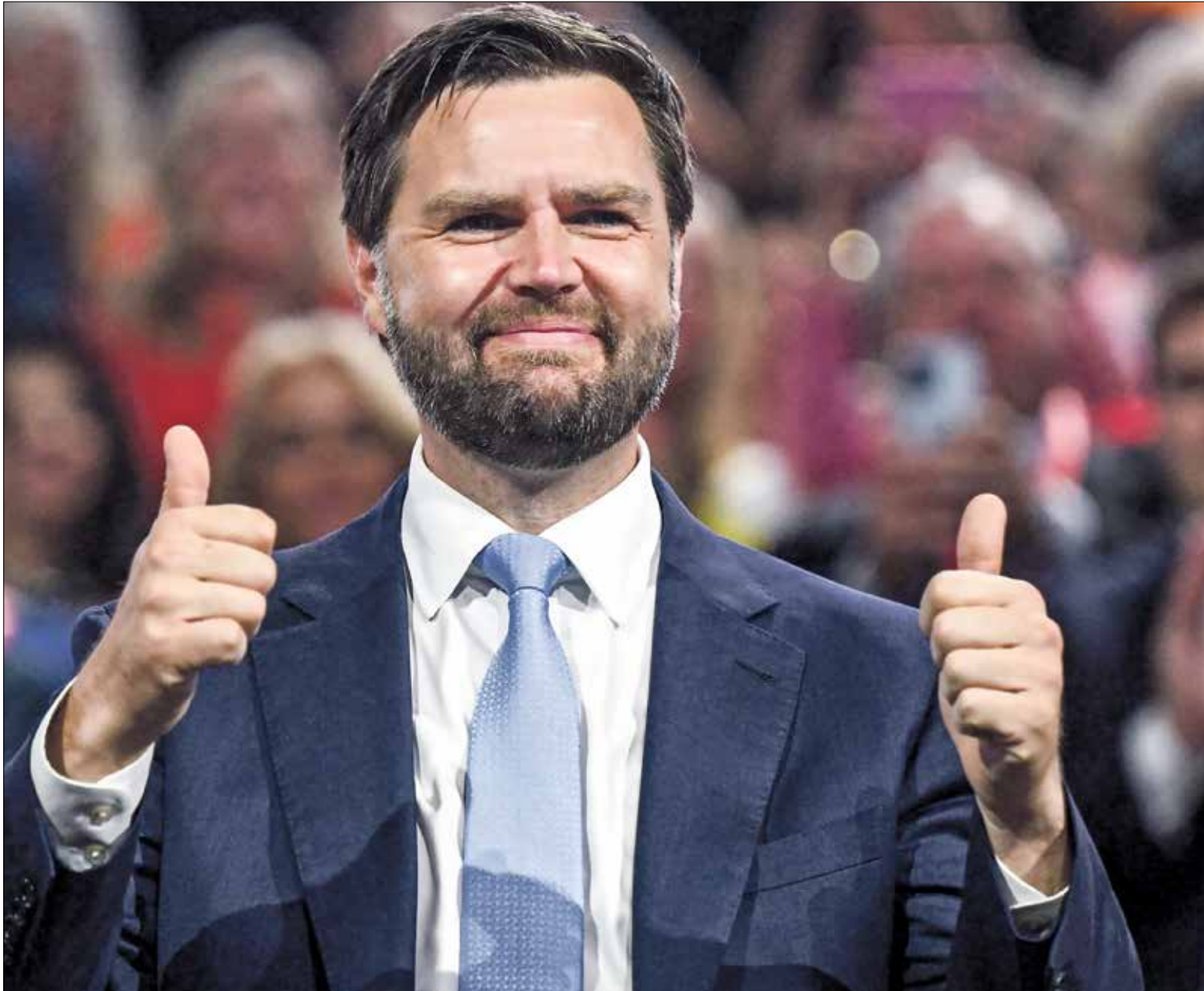
فانس في مؤتمر الحزب الجمهوري، أول من أمس

الخطاب أدى مباشرة إلى محاولة اغتيال الرئيس ترامب». إلا أن آراءه المحافظة قد تغرر الناخبين المعتدلين، والناخبين من النساء، إذ يعارض الإجهاض حتى لو كان نتاج اغتصاب، كما واجه انتقادات خلال ترشحه لمجلس الشيوخ بعدما