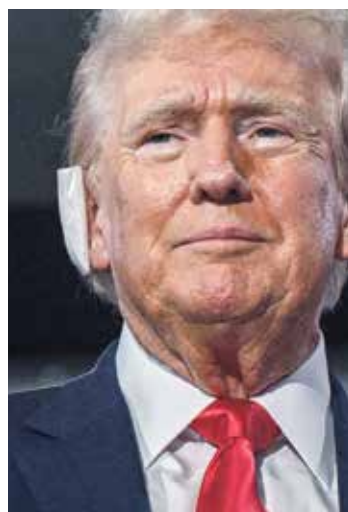
ترامب خلال مؤتمر الجمهوريين أمس الأول

فوزه بالرئاسة، جيمس ديفيد فانس، السيناتور عن ولاية أوهايو البالغ 39 عاماً والذي وقف إلى جانبه خلال المؤتمر. وسيقبل ترامب تفويض الحزب له رسمياً خلال أمسية تنظم غداً الخميس. وأقنعت نجاة ترامب من الموت بأعجوبة مؤيديه الإنجلييين بأنه شخص ينعم ببركة الله، ما عزز الظلال المسيحية التي ترسمها له حملته الرئاسية الشعبية. وفي مقابلات أجريت مع 18 من مندوبي الانتخابات، عبّروا جميعاً، باستثناء