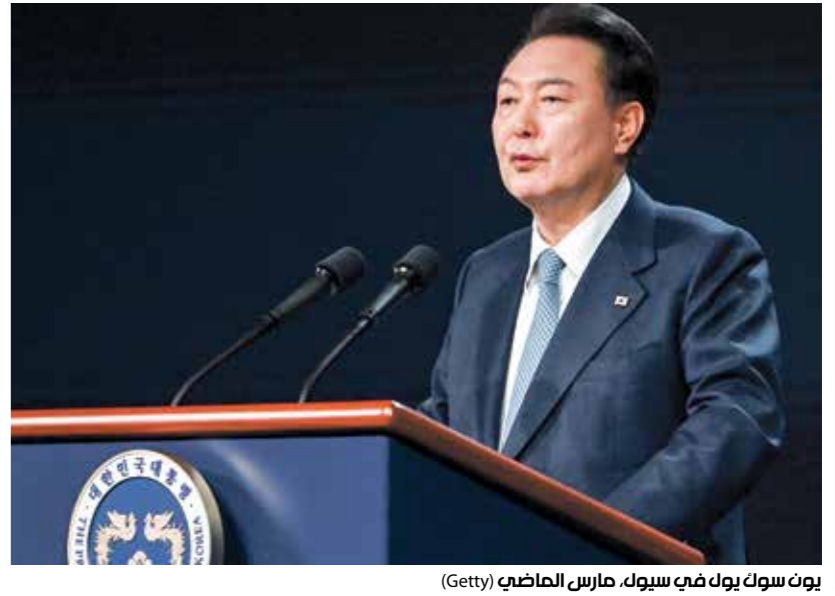
يون سوك يون يوك سيول، مارس الماضي

ونقلت وكالة الأنباء الكورية الشمالية، أمس الثلاثاء، عن كيم يو جونج قولها، في بيان، إنه تم العثور على 29 بالونا كبيرا تحمل مشروبات مراهضة لبونجغ