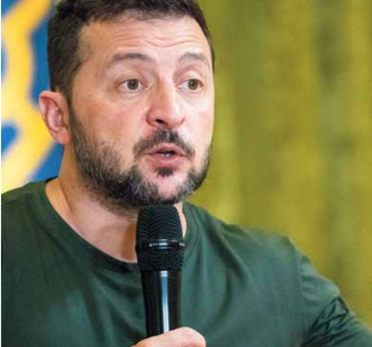
زيلينسكي خلال مؤتمر صحافي في كييف، أوله من أمس