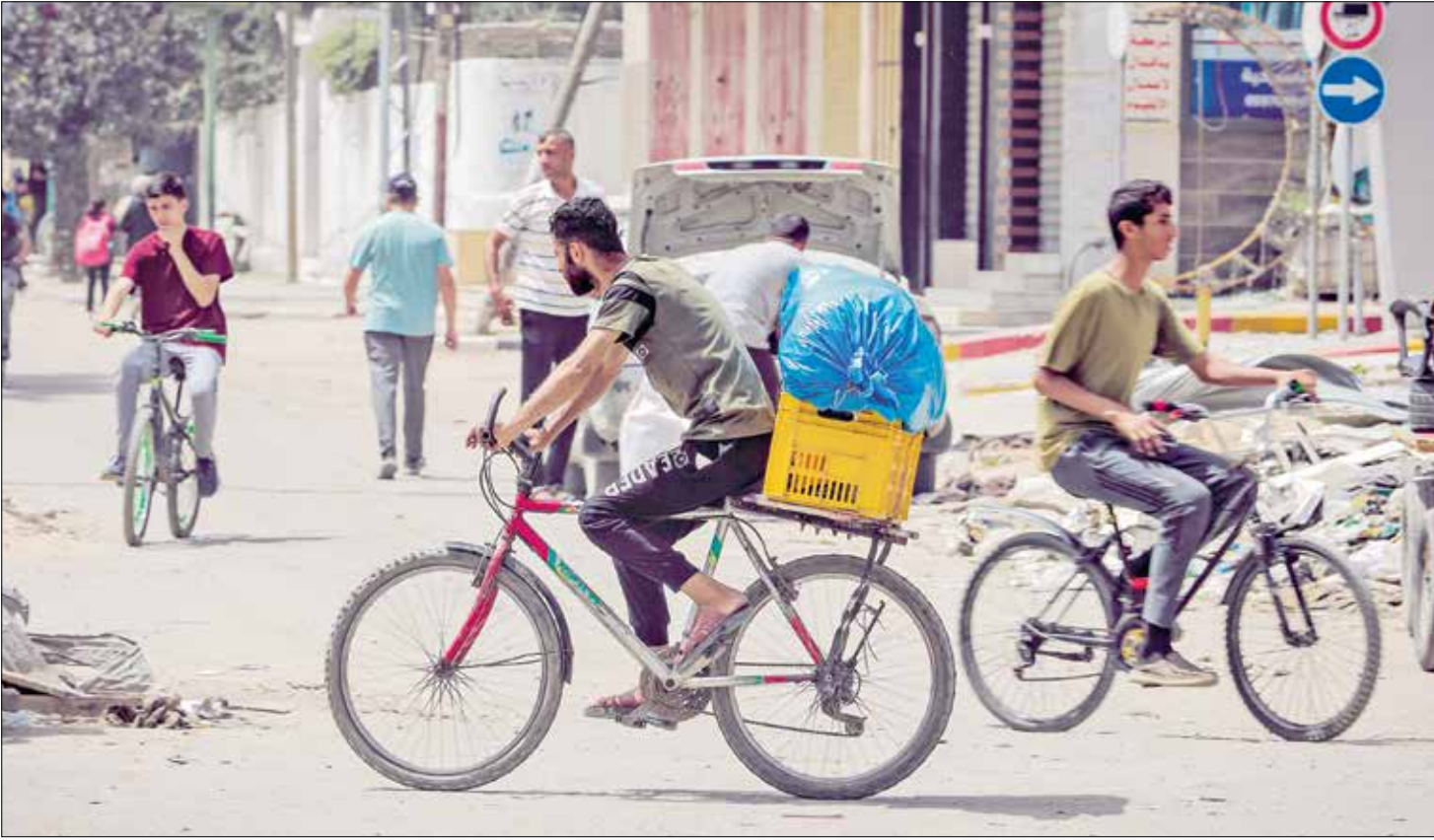
حركة متلصقة على عجلتين