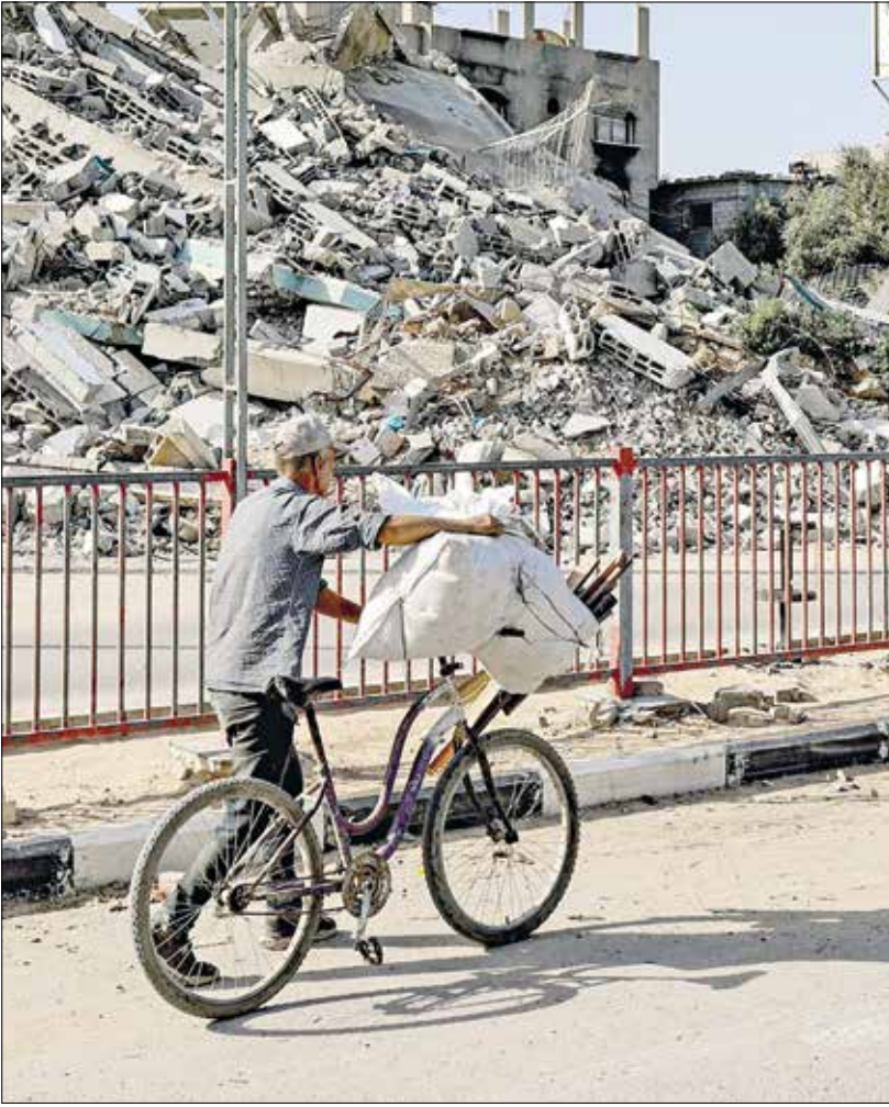
ينقله أكياساً في دير البلح