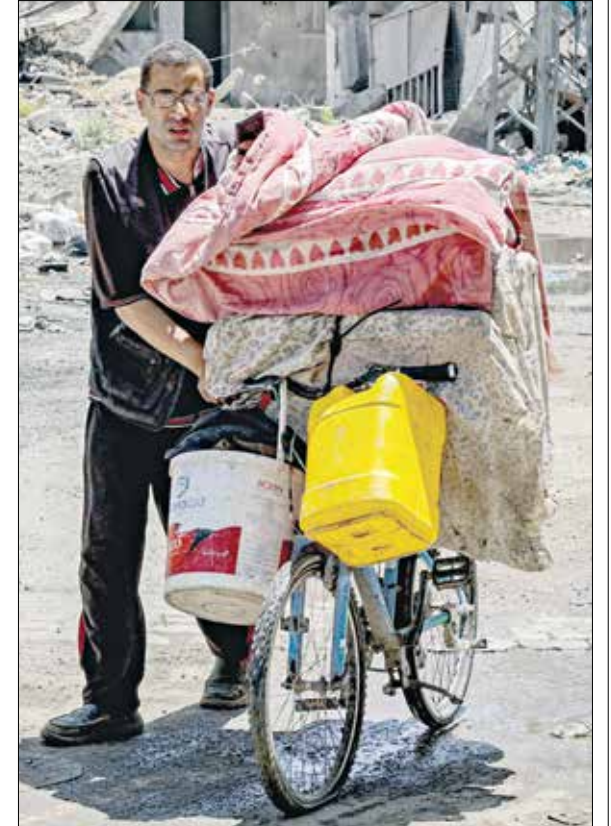
في حب الزيتون