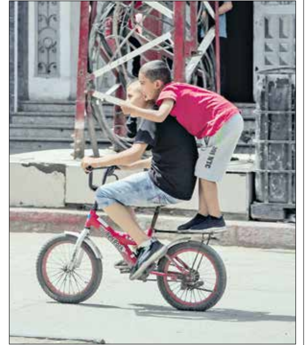
لا يزال الله ممكنًا (هاني بطنجي/ الاناضول)

استعادت مهنة تصليح الدراجات زخمها (هاني بطنجي/ الاناضول)