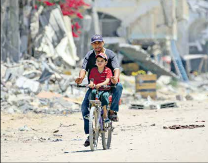
يعبران وسط الدمار في خانونس (أباد البايا/ فرانس برس)

يحمله دراجته ضوء الانقراض (أباد البايا/ فرانس برس)