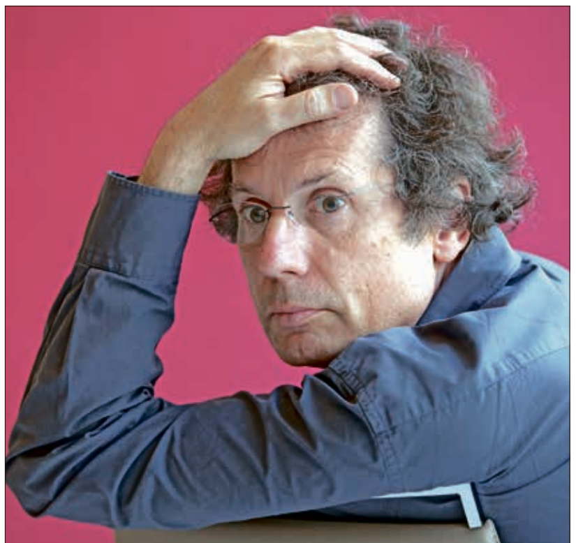
المؤلف في 2013

يدرس شروط القدرة على إنتاج الأثر وتحريره في الزمن