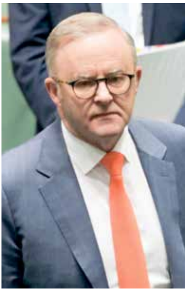
التونج البانيز

علوم الكمبيوتر وتكنولوجيا المعلومات في جامعة ميلبورن، ليس من المؤكد حتى إن الوسائل التقنية لفرض مثل هذا الحد موجودة في الوقت الراهن. قال: «تختبر الحكومة تكنولوجيا التحقق من العمر، ولكننا نعلم بالفعل أن الأساليب الحالية غير موثوقة، ومن السهل جداً التحايل عليها، أو أنها تشكل خطورة على خصوصية المستخدمين».