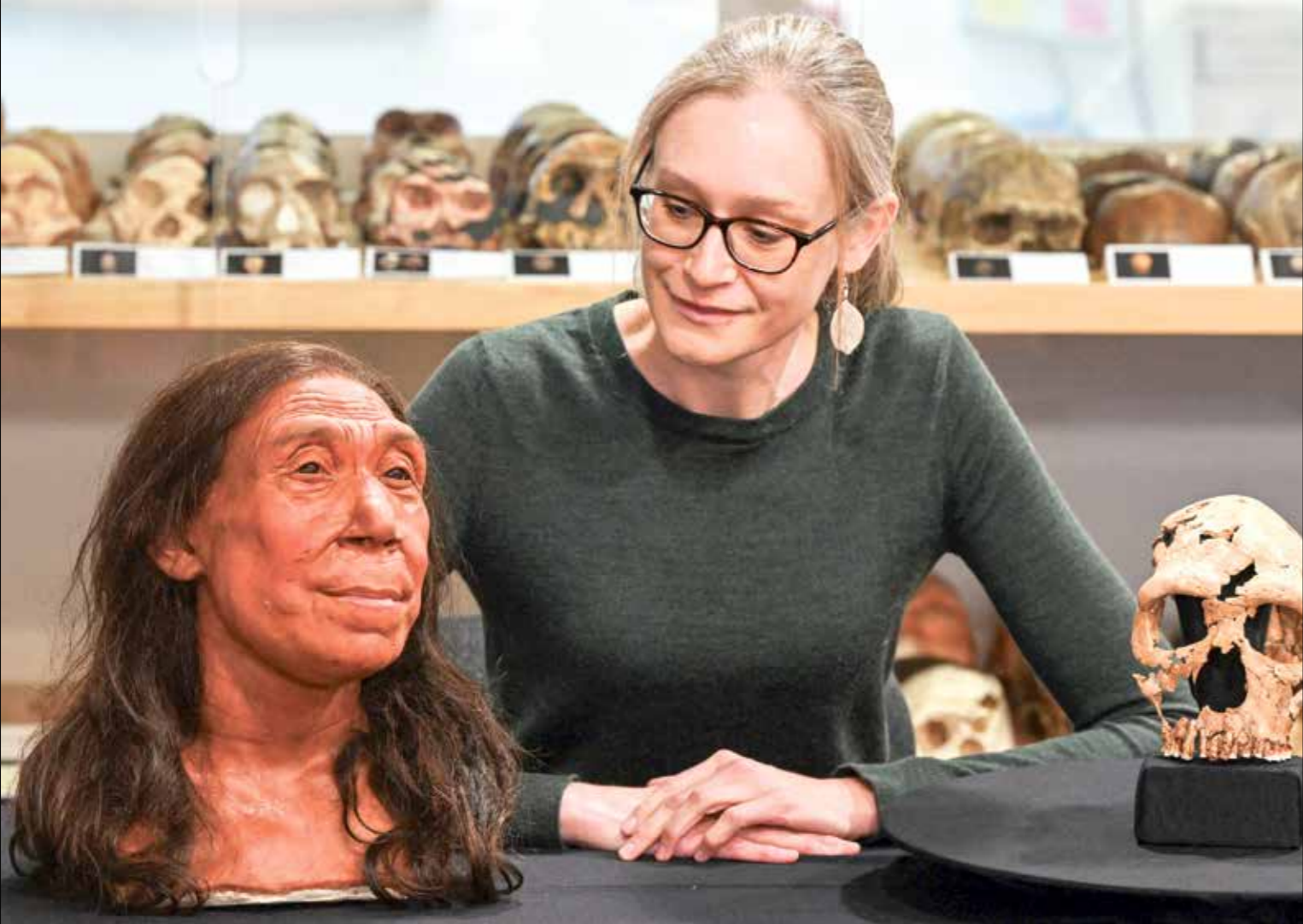
سكت اسكان نياندرتال (أوراسيا ختم قرابة 40 ألف سنة قبل الحاضر) في المتاحف الجاسنت