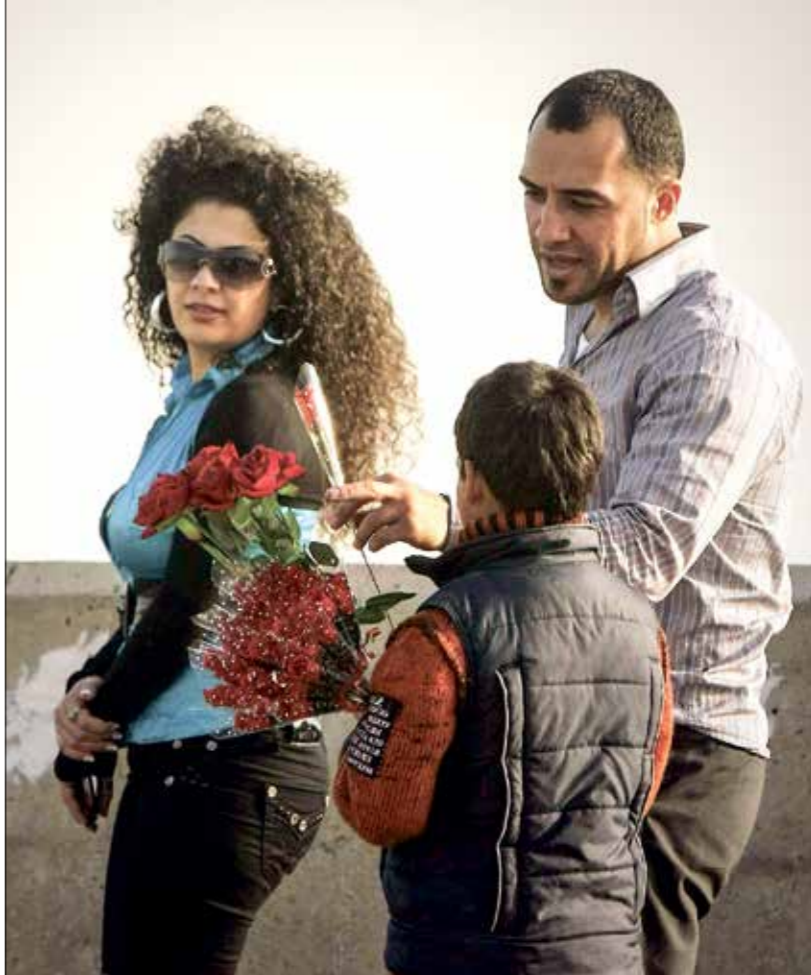
يتحلق الحب الهل محرز سلعة

تداول نشطاء على مواقع التواصل الاجتماعي معلومات عن عمليات نهب واسعة طاولت عدداً من المتاحف السودانية، وهذا ما تؤكده السلطات في البلاد، وتسعى إلى إيقافه