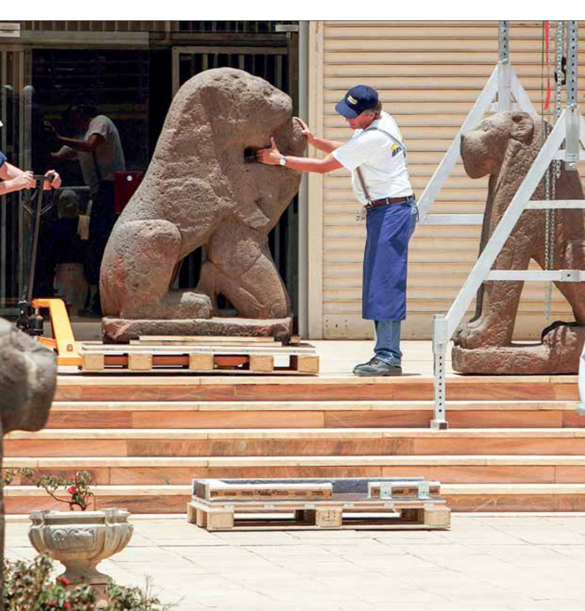
خلال وضع تماثيل الربة عند مدخل المتحف الوطني في الخرطوم. 2008

كانون الثاني 1885. يحتوي متحف السودان القومي على أكثر من 150 ألف قطعة أثرية، تمثل كل الحقب التاريخية في السودان، منذ أقدم العصور الحجرية في تسلسل تاريخي حتى الفترة الإسلامية. يُورخ المتحف الذي افتتح في مطلع القرن الماضي، وأعيد افتتاحه في عام 1971، لأقدم الحضارات السودانية، بداية من العصر الحجري القديم، كما يضم آثارا من حضارات كوش، وكردية، ورومي وتبتا، تتكون تلك الآثار الحجرية والتماثيل الضخمة. يحوي المتحف كذلك مجموعة من اللوحات الجدارية التي تعود إلى الفترة المسيحية. وفي فناء المتحف، ضُمّ عرض مفتوح فيه العديد من المعابد والأعمدة، كانت قد رحلت من شمال السودان ضمن حملة إنقاذ آثار النوبة، وركّبت في حديقة المتحف. تؤكّد مديرية إدارة المتاحف لوزارة الثقافة، غالبية جدار النبي لـ«العربي الجديد»، أن متحف