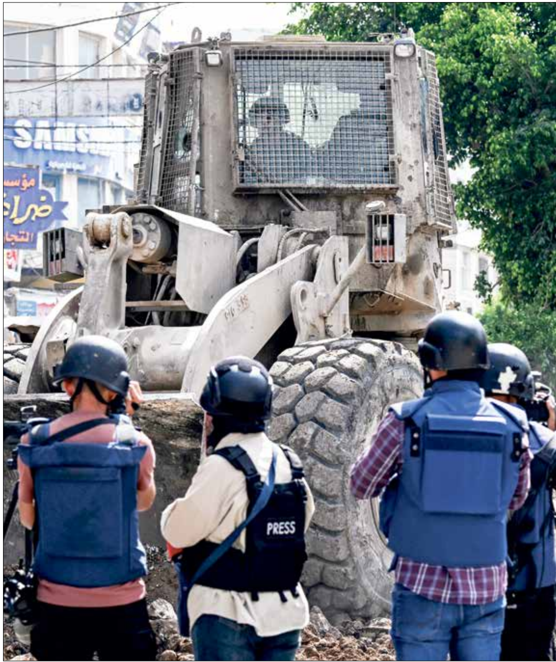
خلال اقتحام قوات الاحتلال لحديقة جنين، 1 سبتمبر 2024