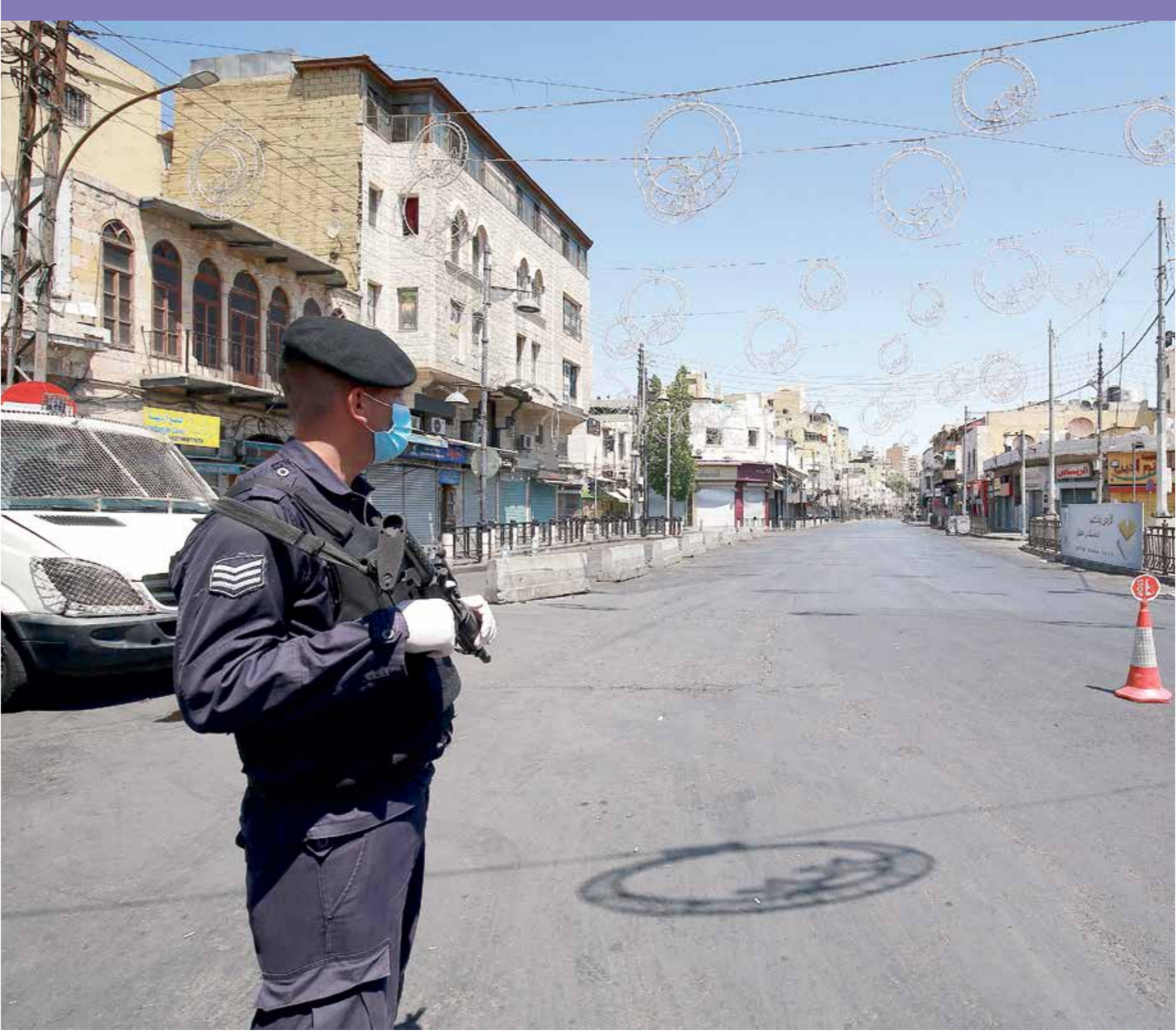
لتدابير كورونا عفت الأزمة الاقتصادية

إطار شفوي موحد. وقال الخبير الاقتصادي حسام عايش لـ «العربي الجديد» إنه تم التحذير في