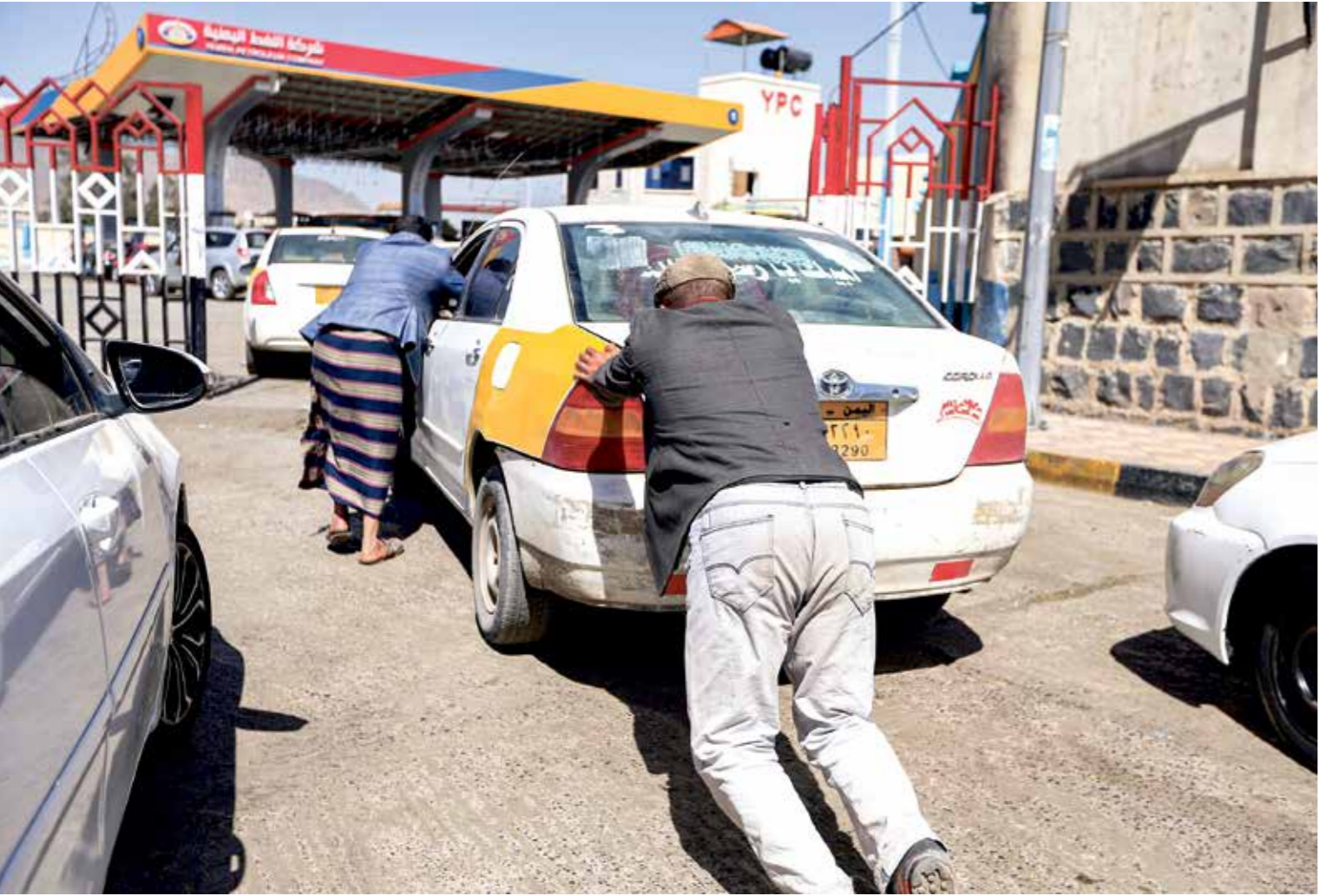
ينصكس تراجع لواقع الوقود

■ خط لزيادة الإنتاج النفطي إلى 150 ألف برميل يوميا