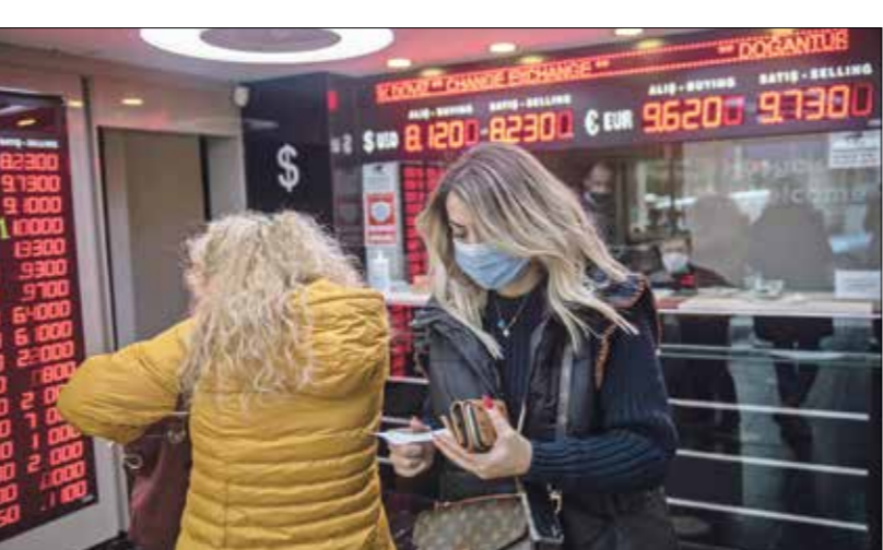
محل زيارة في استنبول

واصلت الليرة التركية صعودها، أمس الأربعاء، أمام الدولار الأميركي، لتعود إلى مستويات ما فوق 8 ليرات للدولار التي كانت قد بلغت أقل من أسبوعين، وذلك بعد إعلان الرئيس رجب طيب أردوغان عن سياسة قرضارية جديدة تمنح فرصاً كبيرة للمستثمرين الأجانب، وبلغ سعر صرف العملة التركية 7,89 ليرات للدولار الواحد، منتصف نهار الأربعاء، بينما لماتت فايزر من تراجع أرباحها بنسبة 71% في الربع الثالث من العام الجاري، كذلك انخفضت الإيرادات بأكثر من التوقعات، مع استمرار الضغوطات التي تسببها جائحة كورونا. وتراجع صافي أرباح شركة الأدوية الأكبر حسب بيانات سوق «ول ستريت» إلى 2,19 مليار دولار في الربع الثالث من مستوى 7,68 مليارات دولار خلال ذات الفترة من العام الماضي. فيما بلغ نصيب السهم من الأرباح المعدلة 72 سنتاً، وهو أقل من مستوى 75 سنتاً للشهم المسجل خلال فترة الارتفاع، ومقابل توقعات بدأ 71 سنتاً. وتراجعت الإيرادات إلى 12,13 مليار دولار خلال فترة الأشهر الثلاثة المنتهية في سبتمبر/ أيلول، مقابل 12,68 مليار دولار خلال الفترة نفسها من 2019. أما التوقعات، فاشارت إلى هبوط في الإيرادات عند مستوى 12,31 مليار دولار. يذكر أن هناك العديد من شركات الأدوية العالمية التي تعمل على تطوير لقاحات وأدوية لكورونا من بينها شركة «جونسون أند جونسون» الأميركية المنافسة لشركة فايزر وشركة «استرا زانديكا» للبحان تعملان على تطوير عقار لفيروس كوفيد 19 بالتعاون مع جامعة أوكسفورد البريطانية. وتعهدت العديد من شركات الأدوية على عدم الترويج من عقاراتها ولقاحاتها.