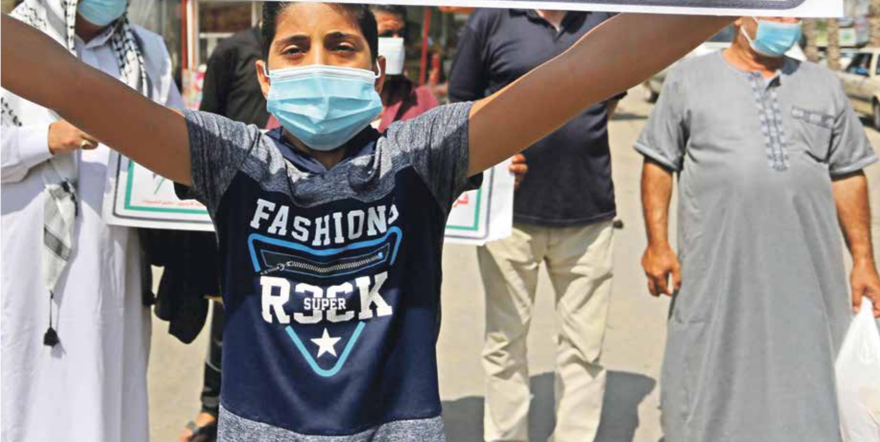
احتجاجات في فلسطين ومدن من الدول العربية ضد التطبيع مع الاحتلال (الفرنسية)

إقامة منطقة صناعية جديدة هي الأكبر في الضفة الغربية المحتلة تسمى «منطقة شاعر هشورون- نأحال ريهام، أي بوابة السامرة وادي ريهام، تمتد على مساحة مليوني متر مربع من المباني البنية للمصانع وشركات الهابت ومكاتب الخدمات المختلفة. وكانت أولوية قد مهدت الطريق القانوني لاستيراد البضائع الإسرائيلية بهدف استهلاكها في السوق المحلية أو منتقلت من أراضيها إلى بلدان أخرى من خلال إلغاء