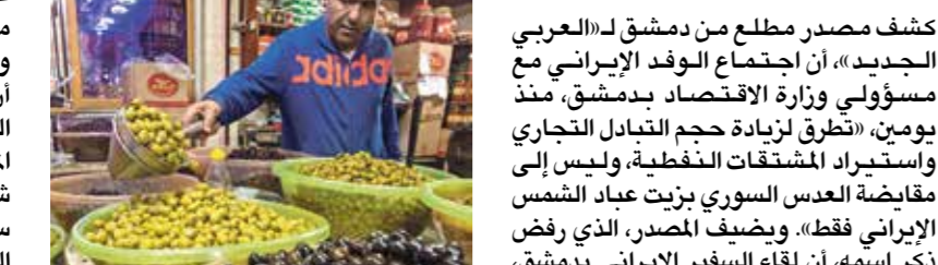
ارتفاع أسعار الزيتون في سورية

المقبل بتصدير الفكي طن من زيت الزيتون والف طن من العدس إلى إيران مقابل استيراد كميات من زيت عباد الشمس تعادل في ثمنها الكميات المحصرة من زيت الزيتون والعدس، مشيرة إلى أن الاجتماع الموسع بين الجانبين تخلته، مناقشة واستعراض سبل تعزيز وتطوير علاقات التعاون الاقتصادي لتوفير احتياجات أسواق البلدين من المواد والسلع الغذائية.