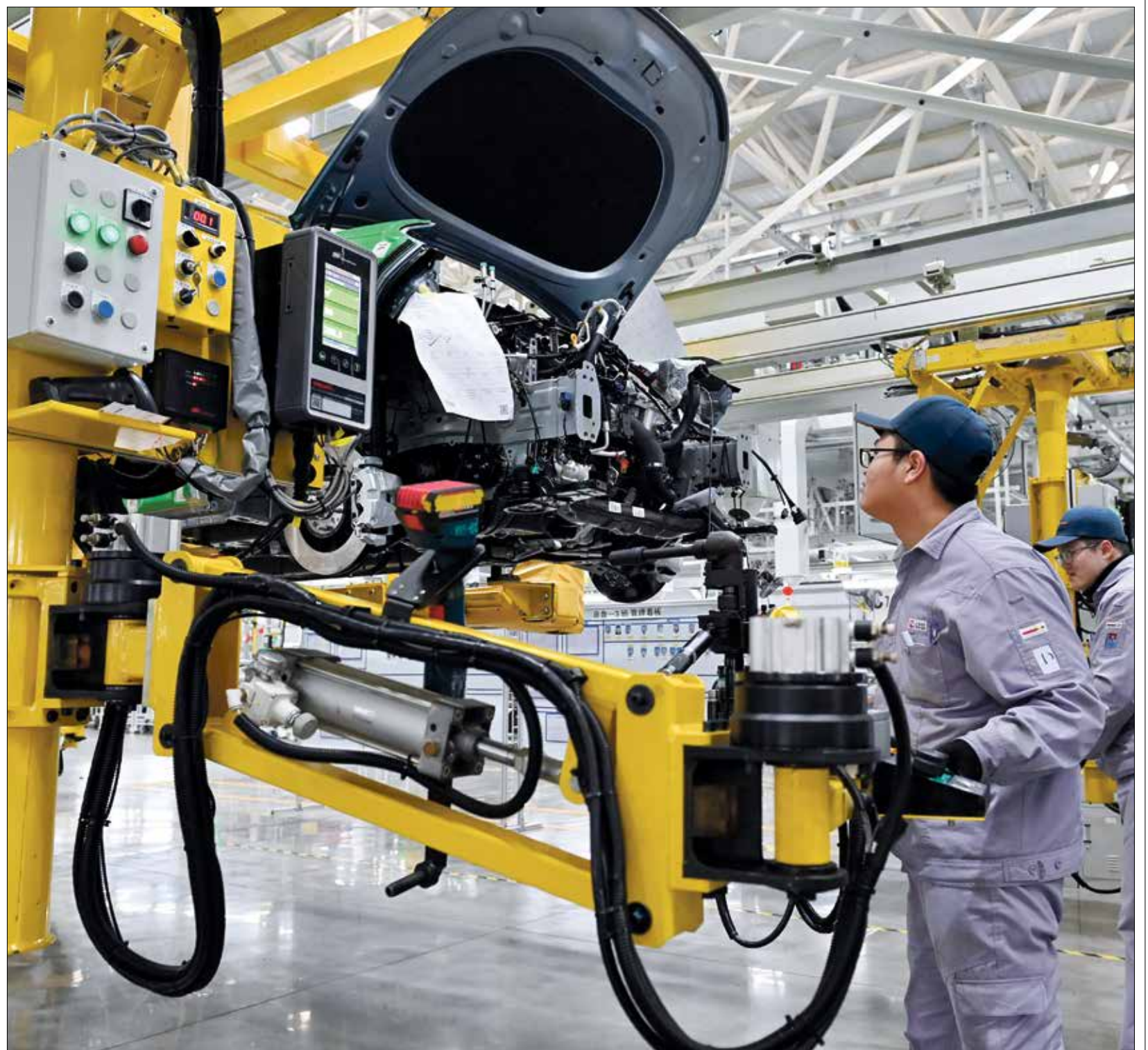
مصنع سيارات هواوي الكهربائية في مدينة تشونغتشينغ الصينية

ومن المقرر أن تنطلق أول رحلة تجارية من محطة برشلونة في العاصمة التونسية، باتجاه مدينة عنابة شرقي الجزائر، وسيتم برمجة رحلة يومية بين البلدين، في مرحلة أولى، كل أيام الأحد والثلاثاء والخميس، انطلاقاً من محطة عنابة شرقي الجزائر، مروراً بكل من سوق أهراس الجزائرية، ثم مدن غار الدماء وجندوبة وباجة التونسية، قبل الوصول إلى العاصمة تونس. وتعدت الشركة الجزائرية بإمكانية الرفع التدريجي لعدد الرحلات وزيادة عدد المقاعد بحسب الطلب المسجل من طرف المسافرين. كما تقرر أن تكون الرحلات انطلاقاً من محطة تونس