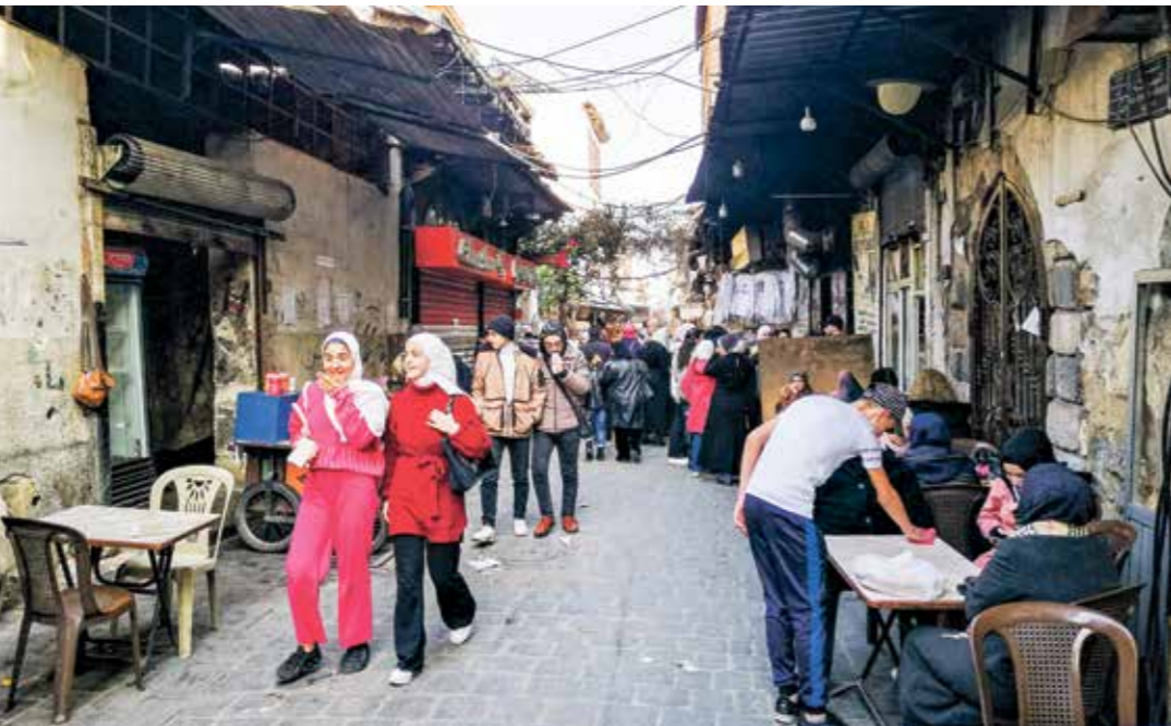
سوق في مصطفا، 10 فبراير 2024