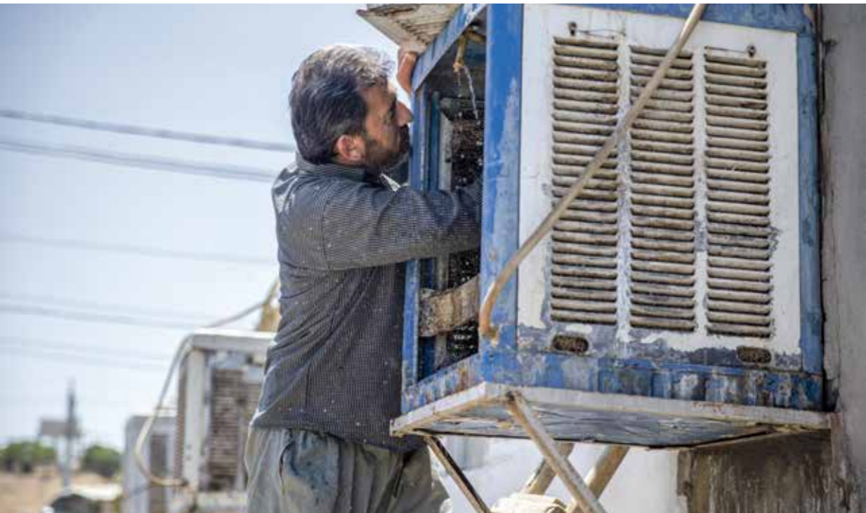
رجل يصلح مكيف هوا، لتصلح بعد موجة حر شديدة ضربت اربيل شمال العراق، 13 يوليو 2023 (الناجون)

تقارير حريرية العراق تكييف من الصين 2,4 مليون في النصف الأول