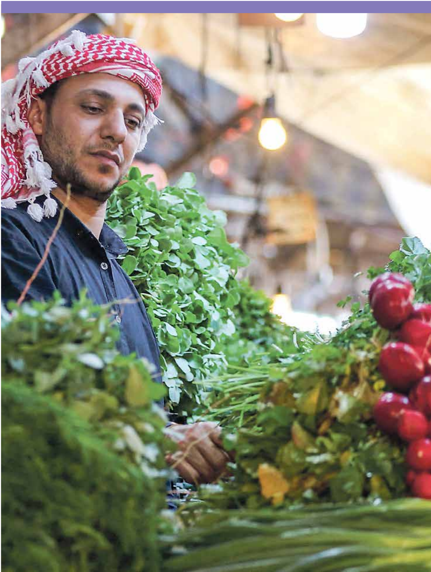
سوق خضروات وسط عمان، 4 يونيو 2018

وكان وقف التصدير، خاصة الخضروات والفاكهة إلى الاحتلال الإسرائيلي منذ بدء العدوان على قطاع غزة نحو عشرة أشهر أحد أبرز مطالب الحراك الأردني المستمر للتحديد بالاحتلال والحرب الإجرامية على قطاع غزة، إضافة إلى مطالب أخرى تصب في معارضة التطبيع الاقتصادي مع الاحتلال بكل أشكاله، لكن الحكومة الأردنية علقت حينها على تصدير الخضروات إلى إسرائيل بأنها تعود إلى تعاقبات من قبل القطاع الخاص وبعض المنتجين مع جهات نظيرة في الجانب الإسرائيلي.