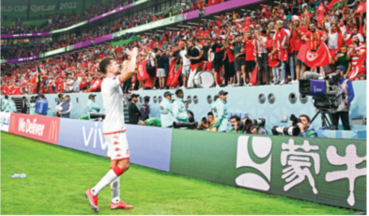
العقويبي اسلم عن عهد النجوم ابراهيم المسالكين

فرقياً متماسكاً لكنه قادر أيضاً على تغيير مجريات كل مباراة.