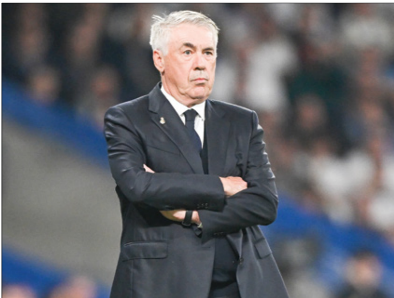
يعرض أنشيلوتي على وضع العديد من الانتقادات في المرة الأخيرة

وكان أنشيلوتي قد أبدى فهمه لاتقادات الواسعة التي تعرض لها في الفترة الأخيرة، عند ظهوره في المؤتمر الصحافي الأخير، حيث قال: «لا أتعرض للظلم حين ألتقى الانتقادات، بل يبدو هذا طبيعيا، فعدمتا لا يلعب الفريق بشكل جيد فنقول الجميع أن مسؤولية التراجع تعود إلى المدرب، فيما قسّم المشايخون تصريحاته بأنه تهذب من المسؤوليّة، ولوم لاعبيه بأنه لا يقدمون المطلوب.