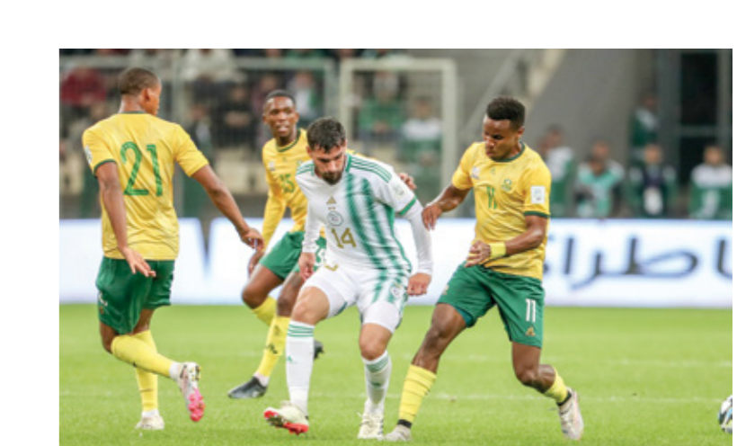
شهدت قائمة الخضر غياب عوار للصاحبة (بالأبيض بليم/Getty)

المعنيين بخوض معسكر نوفمبر/ تشرين الثاني الحالي، الذي ستخلله مباراتان ضد غينيا الاستوائية في ملابو وليبيريا باستاد حسين ايت أحمد بمدينة تيزي وزو الجزائرية يومي 14 و17 من الشهر نفسه توالياً، ضمن آخر جولتين من تصفيات كأس امم افريقيا 2025 المقررة في المغرب، وضمن الخضر التاهل لها سلفاً عبر المجموعة الخامسة التي تضم أيضاً منتخب توغو. وظهر بينكوفيتش في حين مؤتمر صحافي بالمركز التابع