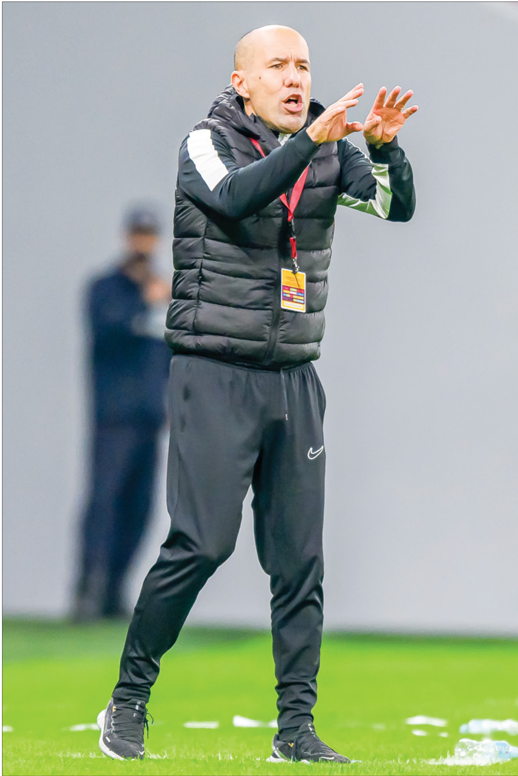
درب غارديم عددا من الاندية الكبيرة في مسيرته

أعلن نادي العين الإماراتي، في بيان رسمي، تعاقدته مع المدرب البرتغالي ليوناردو غارديم (50 عاماً)، لكي يتولى مسؤولية الجهاز الفني للفريق خلفاً للارجنطيني المقال هرنان كريسبو، الذي وجد نفسه خارج أسوار بطل دوري أبطال آسيا عقب النتائج السلبية هذا الموسم.