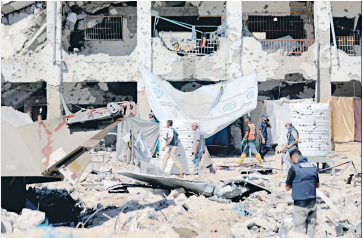
مدار فيه مدرسة الزهراء شرقية مدينة غزة أمس

صباح أمس الخـميس. وأضاف أن 39 ألفاً و699 فلسطينياً استشهدوا وأصيب 91 ألفاً و722 منذ بداية العدوان. وطالب جيش الاحتلال الإسرائيلي، أسس الخـميس، سكان أحياء جديدة في مدينة خانيونس، جنوبي القطاع، بإجلائها قسرا، تمهيدا لنسح هجوم جديد عليها، بإدعاء إطلاق حركة حماس صواريخ استهدفت 22 شهيدا و77 مصابيا خلال الـ24 ساعة الماضية، حتى