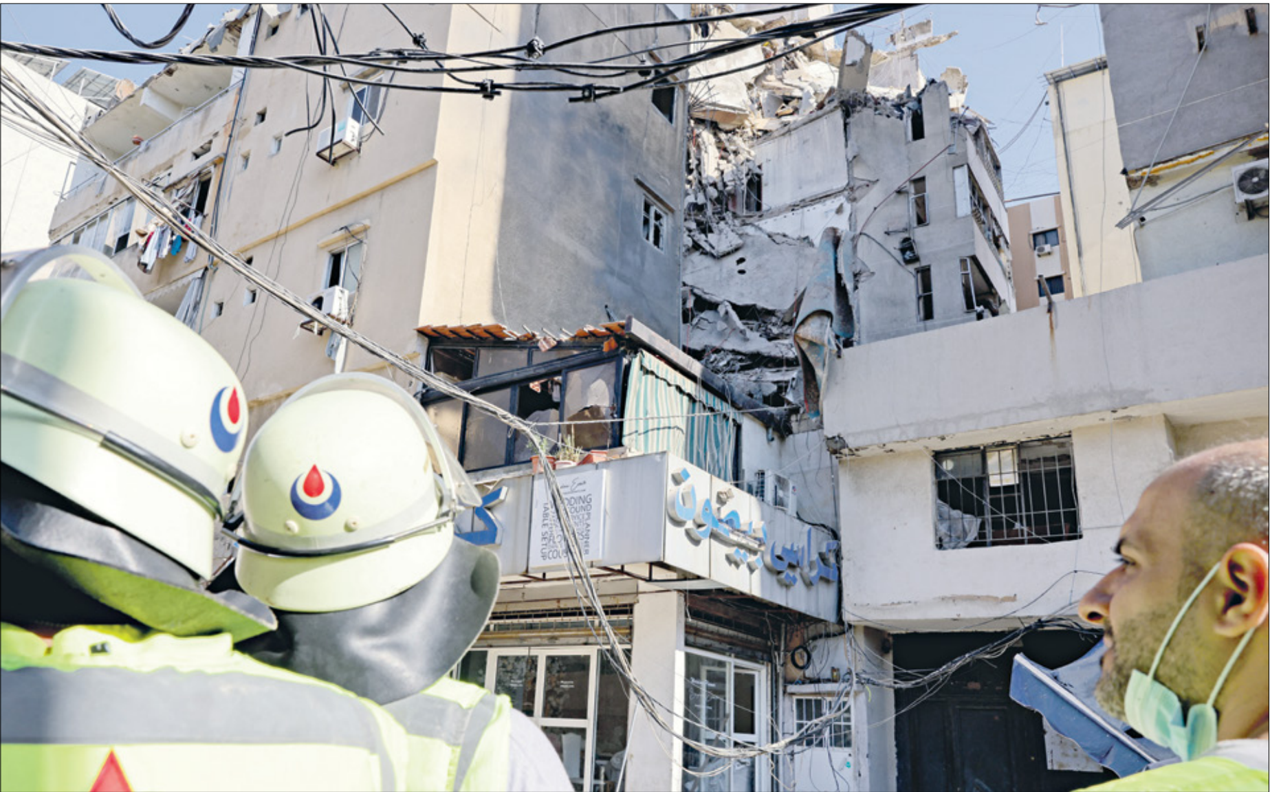
المدني الذي دك، مئة فيه شمر في الضاحية الجنوبية لبيروت 31 يوليو الماضي

وتتوقع التقديرات الإسرائيلية، بحسب الفعالة، أن حزب الله سيجاول الهدف واستهداف مواقع عسكرية «بسلاح لم يستخدمه ضد إسرائيل حتى اليوم»، وتكرت الفعالة أن استعداداتها للهجوم المحتل منذ نهاية الأسبوع الماضي، فيما تستغل الوقت الحالي للتحسين وتعزيز التسنيق مع حلفائها في المنطقة، وعلى رأسهم أميركا، متوقعه أن تحظى هذه المرح أيضاً بتغطية جوية وعمق استراتيجي يتيح لها التصدي لرد المتظر. وتكرت صحيفة يديعوت اخرونوت، أسس الخـميس، أن السيناريو الأمسا بالنسبة