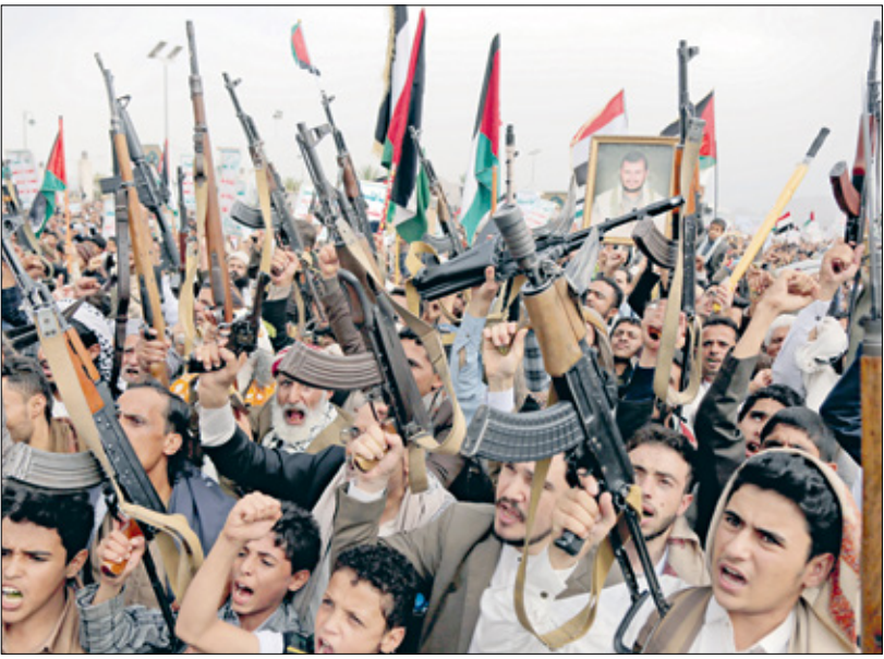
من تطاهرة للحوثيين 26 يوليو الماضي

الحوثيين «يدول وفصائل محور الجهاد والمقاومة علاقة متمينة قوية بمثانة وقوة القضية المركزية الفلسطينية التي تجمعنا جميعا»، مضيفا أن «العلاقة بالجمهورية الإسلامية في إيران علاقة أخوية ودية، حيث نتلقى في إطار القضايا المشتركة على رأسها القضية الفلسطينية، ومواجهة وعلى الاستكبار العالمي المتمثل بأميركا ودول الغرب الداعمة للكيان الإسرائيلي، كما نتلقى في تطعات شعبية الشقيقين اليمنى والإيراني، وتبني المصالح المشتركة لكلا الشعبين، ودون مساس بالسيادة أو تدخل في الشؤون الداخلية من أي بلد على البلد الآخر»، وأشار الأسد إلى أنه بالنسبة للتسنيق المشترك بين دول وفصائل محور الجهاد والمقاومة في مسار إسناد ونصرة أهلنا في غزة فهو مستمر ومتواصل، وبالنسبة للرد اليمني على الكيان الإسرائيلي لاستهدافه الجديدة (20 يوليو/ تموز الماضي) فهو ات لا محالة، وسكوت قويا إن شاء الله، وكذلك الرد من قبل إخواننا بين جماعة الحوثيين والنظام في إيران، ساهمت في بناء علاقة متمينة بين الطرفين، انعكست في الدعم السياسي والعسكري الذي تقدمه طهران للحوثيين ويخيني الحوثيون السياسة الإيرانية في المنطقة في موقفها من إسرائيل، ومن الولايات المتحدة والغرب، وكذلك من الأنظمة الحاكمة في المنطقة العربية، وعلى رأسها السعودية.