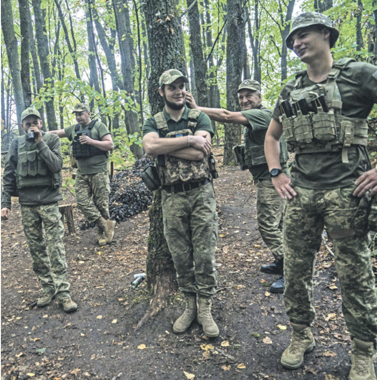
جنود أوكرانو على جبهة خاركيف، أغسطس الحالي

حاولت واشنطن إبعاد نفسها عن أكبر توغل تقوم به القوات الأوكرانية داخل الأراضي الروسية والذي تواصل لليوم الثالث على التوالي، وفي حين أعلنت وزارة الدفاع الروسية أنها استطاعت وقف التقدم الأوكراني في منطقة كورسك، أشار مدونون عسكريون روس إلى ان الوضع يتدهور، مشيرين إلى أن القوات الأوكرانية سيطرت على قرية في المنطقة