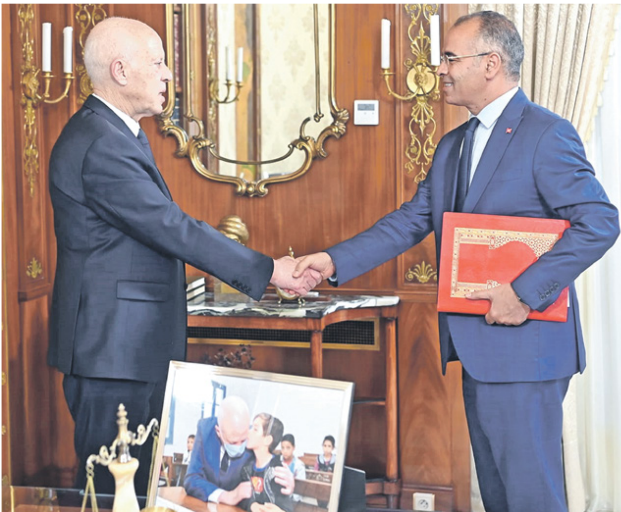
سعيد مستقبلاً المدوري مساء الأربعاء

وسيكون المدوري الرئيس الخامس للحكومة خلال عهد سعيد، بعد إلياس الفخفاج، وهشام المشيشي، ونجلاء بودن، وأحمد الحشاني. ويرى متابعون أن سعيد يريد بوضوح القول إنه لا يتحمل مسؤولية