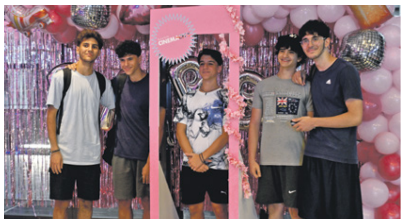
هوسّ لبناني بـ«راري»، في غياب سينما محلية جادة