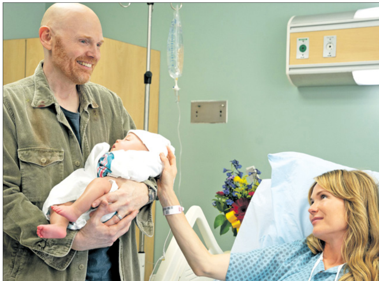
«الآباء العجائز» لبك برّ: اللقطة أمام الحدث

أنّ كلام جاك للمديرة (إنّها بدينية) إهانةٌ شخصية له، وإذلالٌ لأسرته، ما يؤثر بشكل تدميري على الكيان الاجتماعي، فيتحوّل الاعتذار من المديرية إلى اعتذار من المجتمع برمّته، الذي ربما يقبل الاعتذار، أو لا. ربما كان استخدام كلمة تربية، في هذا المقام، تلطيفاً لحالة من الترويض القسري الهادئ والمتوالي، بمتابعة حثيثة لا تنتهي، بحيث لا يتبقى للإنسان إلا الرضوخ برمّته، الذي ربما يقبل الاعتذار، أو لا. ربما كان استخدام كلمة تربية، في هذا المقام، تلطيفاً لحالة من الترويض القسري الهادئ والمتوالي، بمتابعة حثيثة لا تنتهي، بحيث لا يتبقى للإنسان إلا الرضوخ برمّته، الذي ربما يقبل الاعتذار، أو لا.