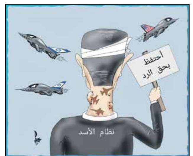
... وما زال الأسد يحتفظ بحق الرد