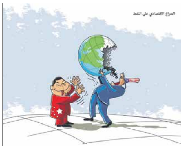
صراع بين اميركا والصين على النفط (صحيفة الرياض السعودية)