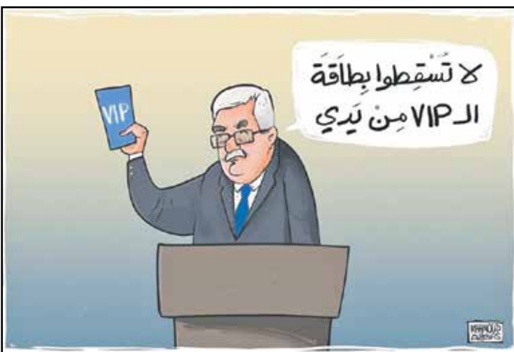
زيارة محمود عباس لبيني غانتس