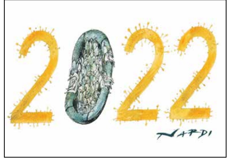
سيكون عام كورونا والمهاجرين أيضاً (ماريلينا ناردي، كارتون موفمنت)