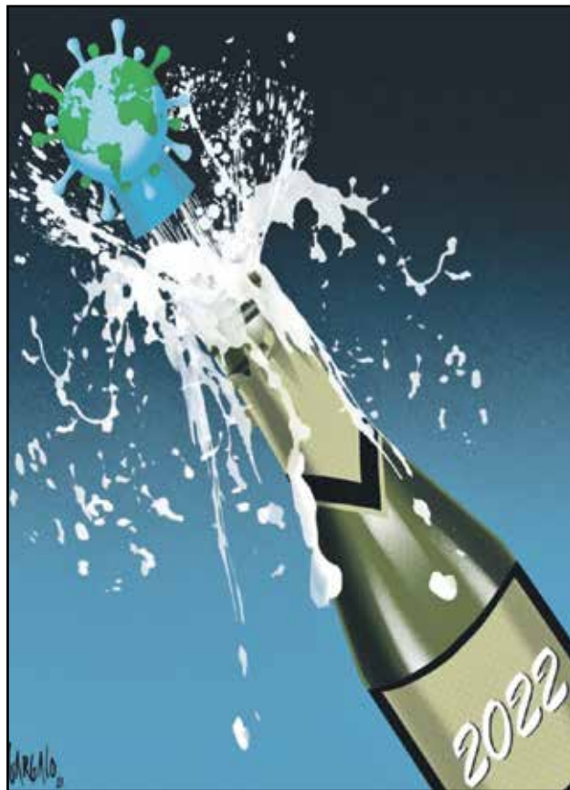
العام الجديد عام الخلاص من كورونا (فاسكو غارغالو، ذات المصدر)

مع إطلاقة هذا العام الجديد وتباين أمزجة البشر حوله بين متفائل وممتشائم، يبقى القادم الجديد مجهولاً غامضاً أسيراً لتوقعات منجمي الأبراج ومحلي الاقتصاد والسياسة، ولا يصير هنا أن نلقي نظرة ساخرة على هذا العام بعيون الرسامين الساخرين حول العالم، كل من زاويته وحسب مزاجه، عسى أن يكون عام خير ورخاء للبشرية جمعاء.