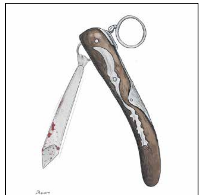
ياقات العنف البرلماني في الاردن (رافعت الخطيب، تويتر)