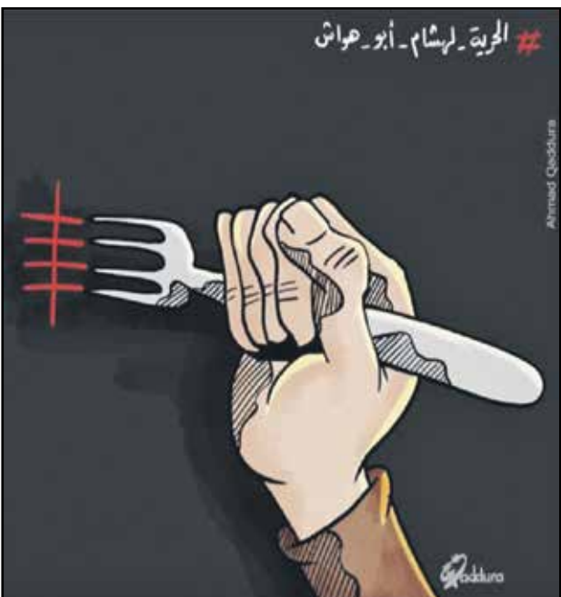
الاسير يحضر ايام نضاله وصوره (احمد قدورة، فيسبوك)