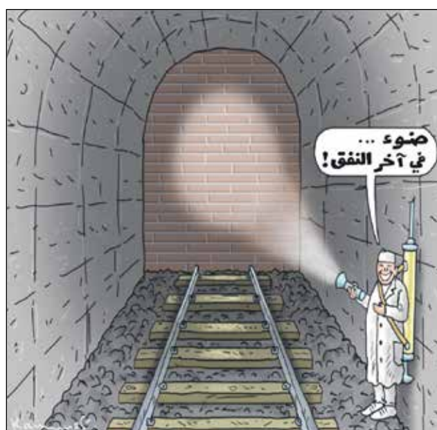
(ماريان كمنسكي، كيغل كار تونز)