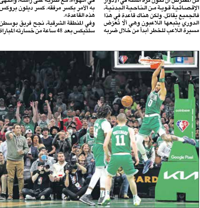
يعض بوسطن سلتيكس للاسمرار في المنافسة على اللقب

الأولى في استعادة المباراة أمام ضيفه حامل اللقب باكس بفضل الثاني جايلن براون وجايسون أنتونومو الذي سجل 59 نقطة معاً، فحقق الأول 30 نقطة والثاني 29 ورة. بوسطن اضرب على خسارته المؤلمة وذلك رغم غياب أفضل مدافع في صفوفه ماركوس سمارت جراء تعرضه لإصابة في فخذه، بفضل دفاع محكم للحذّ باقصي درجات ممكنة من خطورة «العقلان» اليوناني يانيس أنتينوكونومو الذي فقطح نجح في رميتين فقط من أصل 12، في حين تقدم بوسطن بفارق 25 نقطة (65-40)، ورغم عودة أنتينوكونومو إلى أجواء اللقاء في الربع الثالث بتسجيله 18 نقطة (أنهى المباراة مع 28 نقطة و9 متابعات و7 تمريرات حاسمة)، لم يجد المساندة من رفاقه إذ اكتفى جرو هوليداي بـ 19 نقطة و7 تمريرات حاسمة، وتزامناً مع دفاعه الصلب، ارتقى بوسطن بتسجيله جوسميا وعكس براون نجاحته مع تسجيحه 25 نقطة من إجمالي حصاده في الشوط الأول إضافة إلى 9 تسديدات ناجحة من أصل 10، ولعب تايوم دورا حاسماً في مساندة زميله في الربعين الأخيرين، مصيفا إلى 14 نقطة 8 تمريرات حاسمة، في وقت أضاف غرانت وليامز من مقاعد البدلاء 21 نقطة، منها 6 ميات ثلاثية من أصل 9.