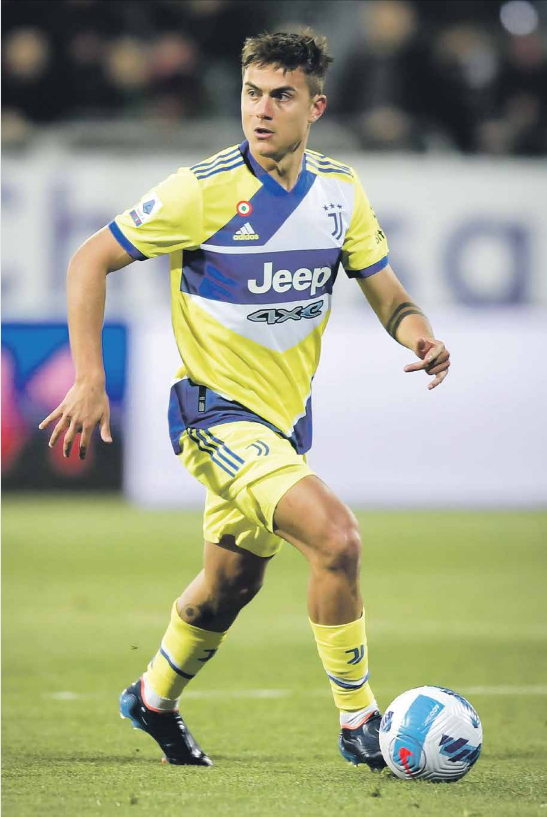
ديبالا سيشكل صفقة مميزة للإنتر إن حصلت هذا الصيف

قرر الأرجنتيني، باولو ديبالا، وفريق يوفنتوس إنهاء علاقتهما اعتباراً من الصيف المقبل، حين ينتهي العقد الذي يربطهما، في وقت يظهر إنتر ميلان في صدارة الأندية المهتمة بالحصول على توقيع المهاجم الأرجنتيني مجاناً. وأشارت صحيفة غازيتا ديلو سبورت إلى الرغبة عدة أندية في الظفر بخدمات ديبالا مثل برشلونة وأتلتيكو مدريد وتوتنهام ومانشستر يونايتد، لكن اللاعب يفضل الانتقال إلى إنتر.