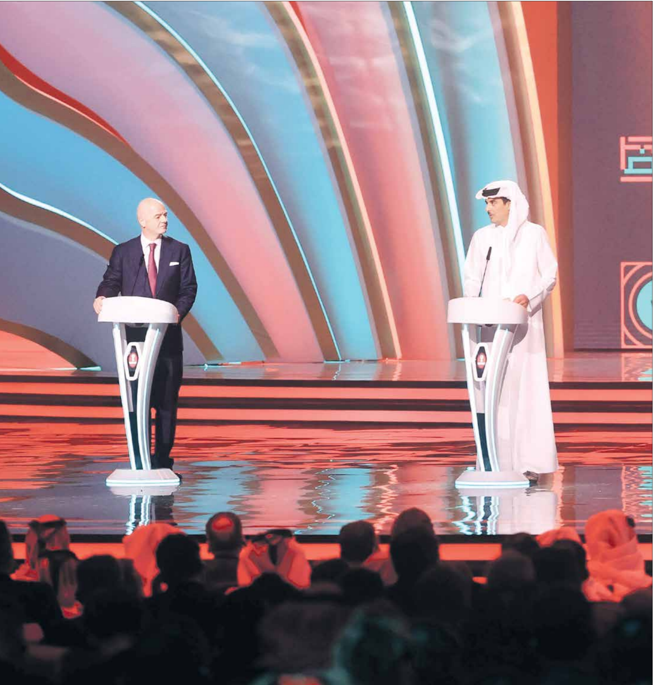
التوقيع نسخة الجماهير للمونديال في قطر (الناصون)

القطري، أعلن الاتحاد عن احتضان ملعب أحمد بن علي مباريات بطولة كأس العالم 2022، إذ إن المباراتين الفاصلتين الأخيرتين المؤهلتين للمونديال ستجمعان بين الفائز من الملحق الآسيوي (بين الإمارات وأستراليا) ومنخب بيرو، في حين أنّ المواجهة الثانية ستكون بين منتخب