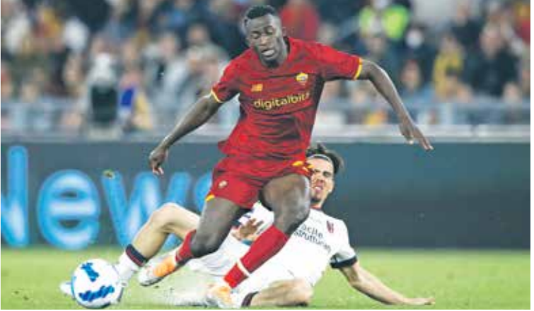
المهبة الواحدة فيلكس جيان