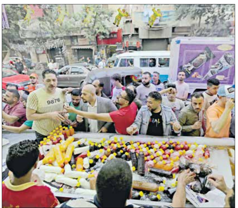
غلاء أسعار الأغذية يهبط سكات الشهارة

الصادر أول من أمس، أن انعدام الأمن الغذائي تضاعف تقريبا في السنوات الست الماضية منذ عام 2016 عندما بدأت في تصد، ونكر غذائية بمقدار الخمس إلى 19٩ مليونا العام الماضي، وإن التوقعات ستتفاقم ما لم تتخذ إجراءات عاجلة «على نطاق واسع».