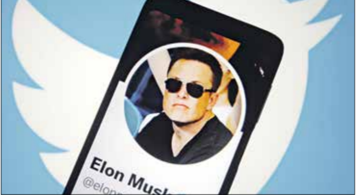
ماسك يرفض رسوم على استخدام تويتر

بعترمه المستثمر الأميركي، إيلون ماسك، إعادة شركة «تويت» إلى الملكية العامة بعد جمع سنوات فقط من تحويلها لكيان خاص. بحسب تقرير أميركي، وذكرت صحيفة «وول ستريت جورنال» أمس الأربعاء، أن «ماسك» أخبر مستثمرين محتملين بأنه يخطط لتقديم طرح عام أولى لشركة «تويت» وكان «ماسك» قد توصل إلى اتفاق مع مجلس إدارة الشركة لموقع التوصل الإجتماعي لشراء كامل أسهم «تويت» مقابل 44 مليار دولار وتحويلها لكيان غير مدرج في سوق الأسهم وتحدث الرئيس التنفيذي لشركة «تويت» إيلون ماسك، إلى مستثمرين مثل شركات الأسهم الخاصة، في مسمى للمشاركة في