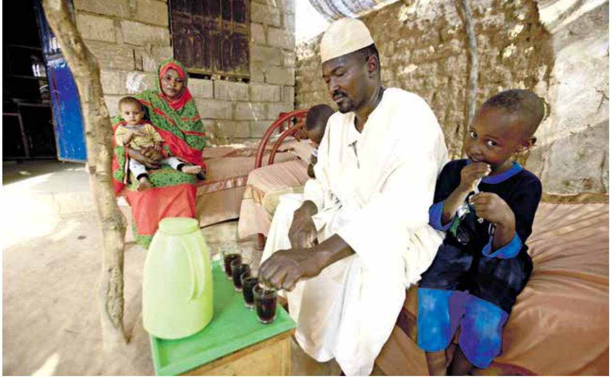
أزمة جديدة يتحملها المواطنون الأفارقة الثلاثة فيخراس برنن

وقال الديباني، أمس الأربعاء، في تصريح لإذاعة محلية، توجد مؤشرات تدل على أن الحرائق التي اندلعت متزامنة يوم العيد أخيرا إلى أن 60% من السودانيين أضحوأ خارج نطاق الشبكة القومية للكهرباء، بقابس، كان خبايا أبعاد إجرامية لها أهداف