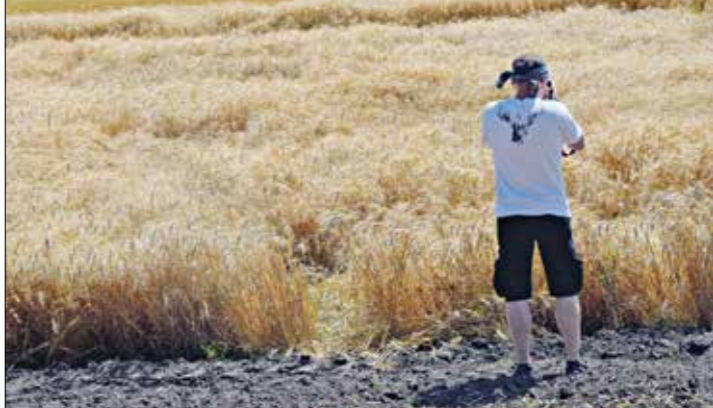
صادرات الحبوب تراجعت إلى ألف طن في إبريل

قالت شركة الإستثمارات الزراعية «إيه بي كيه إنفورم» أمس الأربعاء، إن صادرات أوكرانيا من الحبوب تراجعت إلى حوالي ٩23 ألف طن في إبريل/ نيسان من 2,8 مليون طن في نفس الشهر من العام الماضي وذلك بسبب الغزى الروسي، وأضافت الشركة في تقريرها أن صادرات البلاد تضمنت 768486 طناً من الزرقة و127130 طناً من الفصح، وصدرت أوكرانيا أيضاً 151529 1698٦١ من زيت دوار الشمس و16٩8٦١ طناً من البنزور الزيتية معظمها بذور دوار الشمس، وفي ذات الصدد، قالت شركة «إيه بي كيه إنفورم» إنه من المتوقع أن تعانى أوكرانيا من نقص كبير في منصات التخزين في موسم التصدير على البحر الأسود.