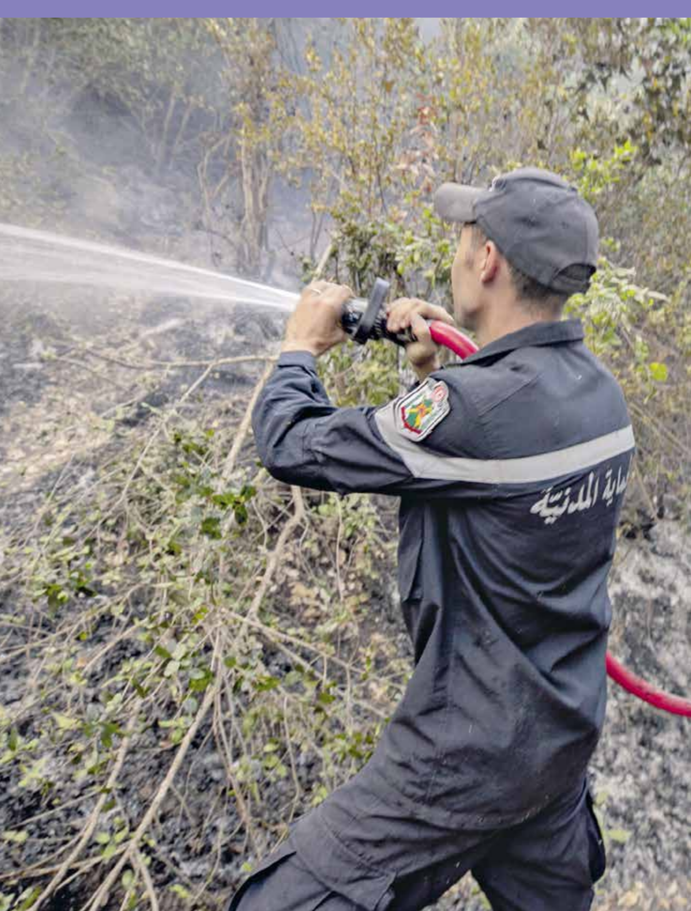
محافظ من مركز سريانو جرف المبات والارض الزراعية (يسار) فيجدة الناظور)

وقال الديباني، أمس الأربعاء، في تصريح لإذاعة محلية، توجد مؤشرات تدل على أن الحرائق التي اندلعت متزامنة يوم العيد أخيرا إلى أن 60% من السودانيين أضحوأ خارج نطاق الشبكة القومية للكهرباء، بقابس، كان خبايا أبعاد إجرامية لها أهداف