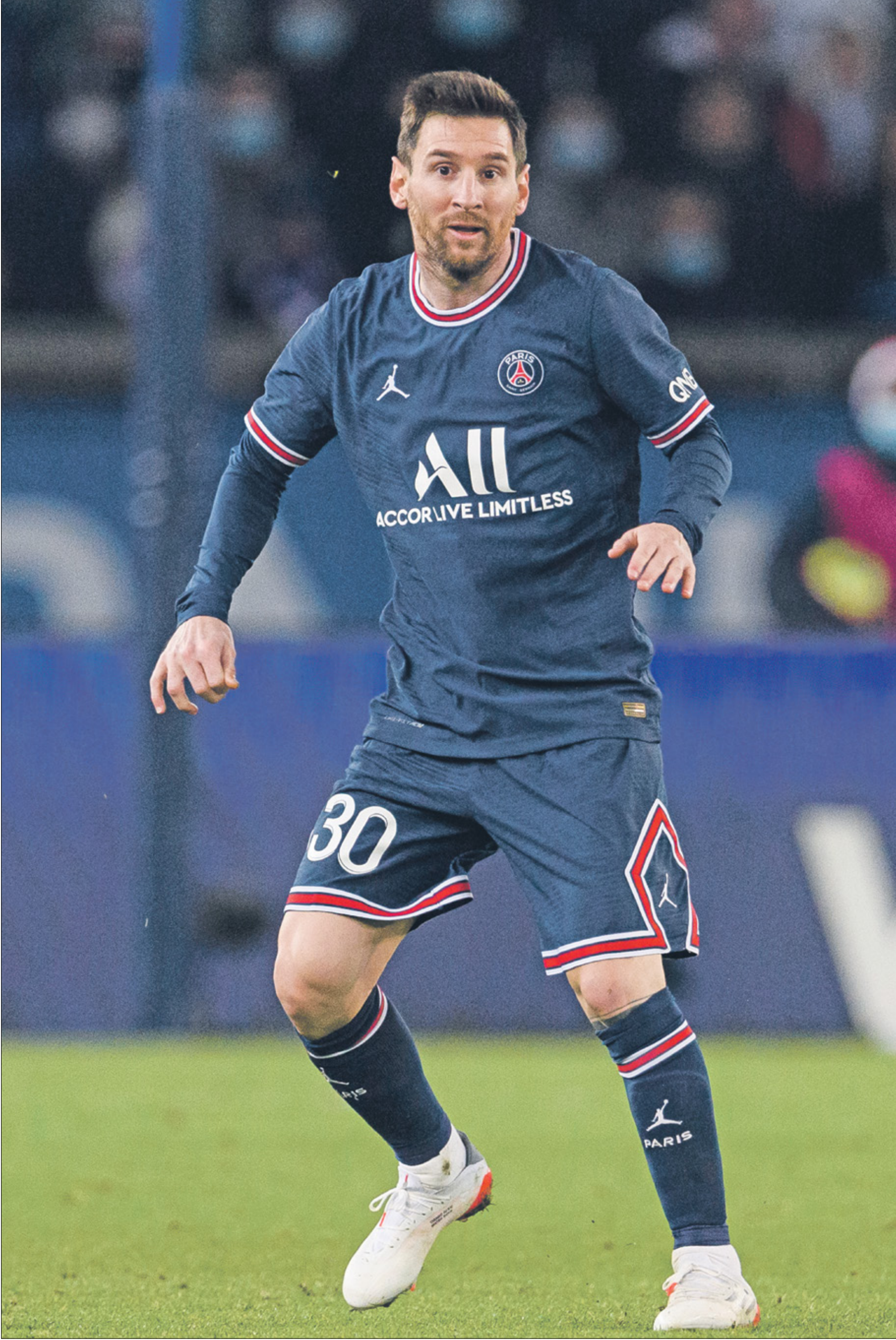
ليونيل ميسي لث يلعب اول مباراة اثبت في عام 2022

اعلن فريق باريس سان جيرمان في بيان نشره عبر موقعه الإلكتروني الرسمي عن إصابة 4 لاعبين بفيروس «كورونا» بعدما جاءت نتائج تحاليلهم الطبية موجبة، وهم: الأرجنتيني ليونيل ميسي، والإسباني خوان بيرنات، والإسباني سيرجيو ريكو والفرنسي ناثان بيتومازالا. وعليه، من المتوقع ان يخسر النادي «الباريسي» جهود نجمه الأرجنتيني ليونيل ميسي، لأسبوعين على الأقل أو إلى حين أن تصبح نتيجة مسحته سالبة.