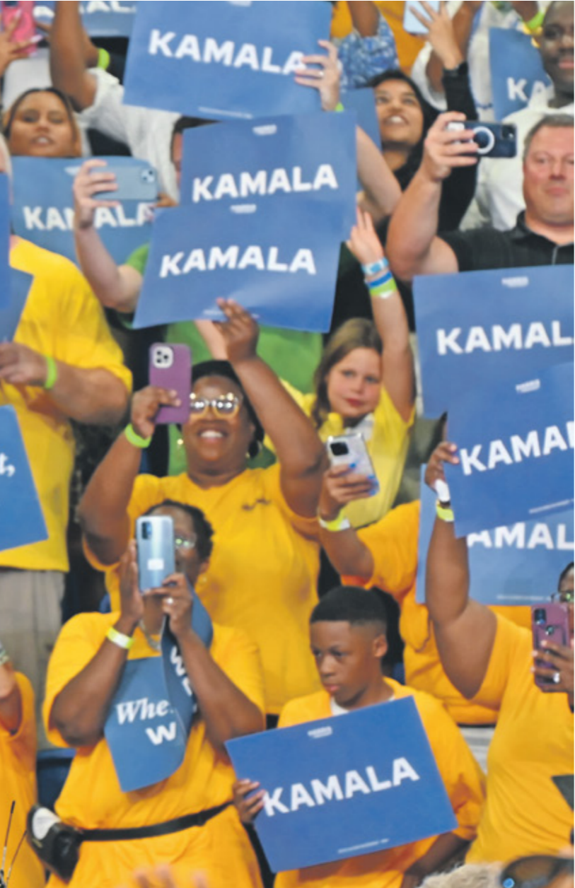
هاريس في الثالثاء الماضي مع كبار المناضلين

كشف الدبلوماسي الكوري الشمالي المشفق ري إيل غيو، أن كوريا الشمالية رابغة في إعادة فتح المباحثات النووية مع الولايات المتحدة، إذا أُعيد انتخاب دونالد ترامب رئيساً، وأوضح ري، الذي فر أخيراً إلى كوريا الجنوبية، لوكالة رويترز، أن بيونغ يانغ «تعمل على وضع استراتيجية النووية إذا فاز ترامب...» (في الانتخابات كوري شمالي اشفق عن النظام، منذ انشقاق نائب سفير كوريا الشمالي، بيونغ يانغ بضعون استراتيجيه لهذا الشهر، وقال ري إن «دبلوماسي واشنطن مقابلة ري، أمس الخميس، وهي أول مقابلة إعلامية منذ الإعلان في يونيو/حزيران الماضي عن استئناف في نوفمبر/تشرين الثاني الماضي خلال وجوده في سفارة بلاده في كوبا، قبل