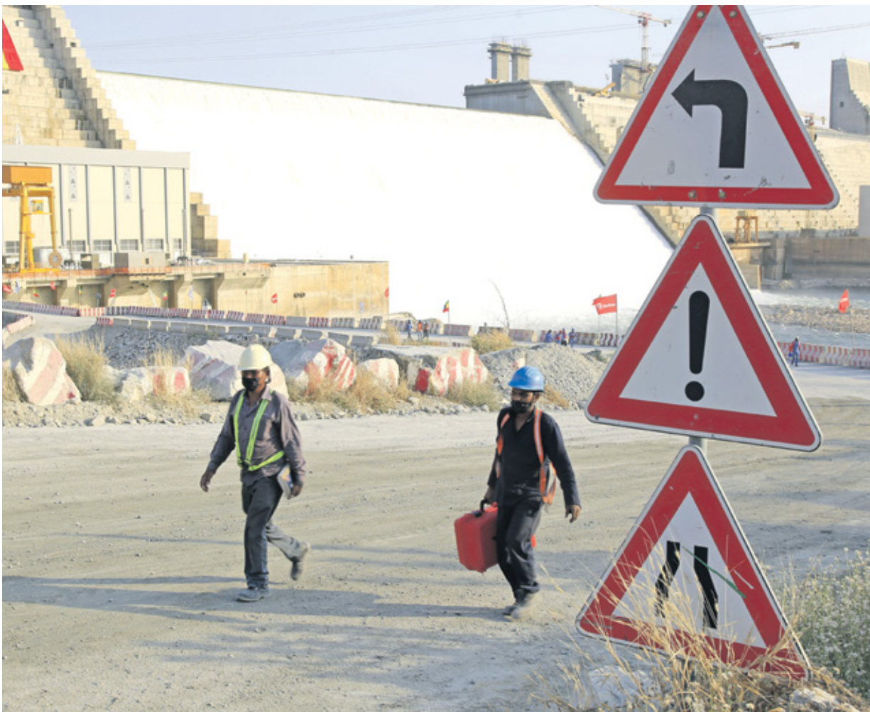
عمالان في موقع سد النهضة الإثيوبي، فبراير 2022

تلك الأحداث، وهو أن محادثات أبي أحمد مع البرهان، كانت تتضمن إخباره بنيتها دولة جنوب السودان التوقيع على اتفاقية عنيتيبي، وعليه ألا يعترض على هذا الأمر، لأنه في كل الأحوال أي خسائر تقع نتيجة هذه الاتفاقية لن تمس مقدرات السودان المائية لكونها دولة مصر، وأن الدولة المصرية هي من ستتحمل كافة الخسائر». وأشار حافظ إلى أن «دخول الإمارات بشكل قوي في اقتصاد جنوب السودان، كافٍ جداً لإقناع جوبا بالتصديق على اتفاقية عنيتيبي، لكونها في نهاية الأمر ستصعب في مصلحة مطلب إثيوبيا بالحصول على حصة مائية من النيل الأزرق عند موقع سد النهضة». وأوضح أن «هذا أمر تستفيد منه الدولة الإثيوبية بشكل مباشر، عن طريق توكيل الصندوق الاستثماري بابوظيبي، في استثمار حصة إثيوبيا من المياه في مشاريع زراعية لزراعة قصب السكر، وتصدير السكر لدول العالم من أكبر مركز لزراعة وتصنيع السكر في المنطقة الحدودية بين سد السرج الإثيوبي وولايات شرق النيل الأزرق (في السودان) والتي خضعت أخيراً للمليشيات الدعم السريع». وقال حافظ إنه «من باب الخداع، تم تشغيل أحد التوربينات العلوية لسد النهضة لمنع أي شكوى مصرية بشأن قلة تدفق النيل الأزرق وتأثير ذلك على بحيرة ناصر»، مشيراً إلى أن «إثيوبيا تساهم بقرابة 86% من تدفقات نهر النيل من حيث حجم المياه السطحية، بينما تساهم مصر بنسبة 0,0% في تدفقات النيل». واعتبر أنه «من المفهوم أن كل دولة تستفيد من تدفقات النيل بنسبة تتناسب مع مساهمتها، وستتمكن إثيوبيا من البدء سريعاً في بناء السدود العلوية فوق سد النهضة، وتحويل النيل الأزرق والسوبات وعطيرة إلى أنهار داخلية محلية تماماً وليس أنهاراً دولية تشاركها مع دول مثل السودان ومصر».