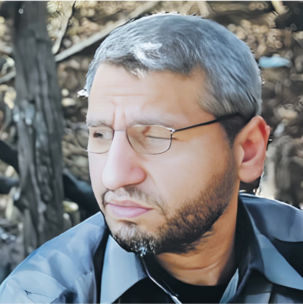
صورة نشرها الاحتلال لاحقا انها لمحمد الضيف (يسار)

سير تبط اسم القائد العام لـ«كتائب القسام»، محمد الضيف او «بي خالد»، الذي اعلن الاحتلال امس الخميس قتله بعد سنوات من ملاحقته، بعمركة «طوفان الأقصى»، علما ان دوره كان حيويا في مراكمة قدرات «حماس» العسكرية خلال الاعوام الماضية