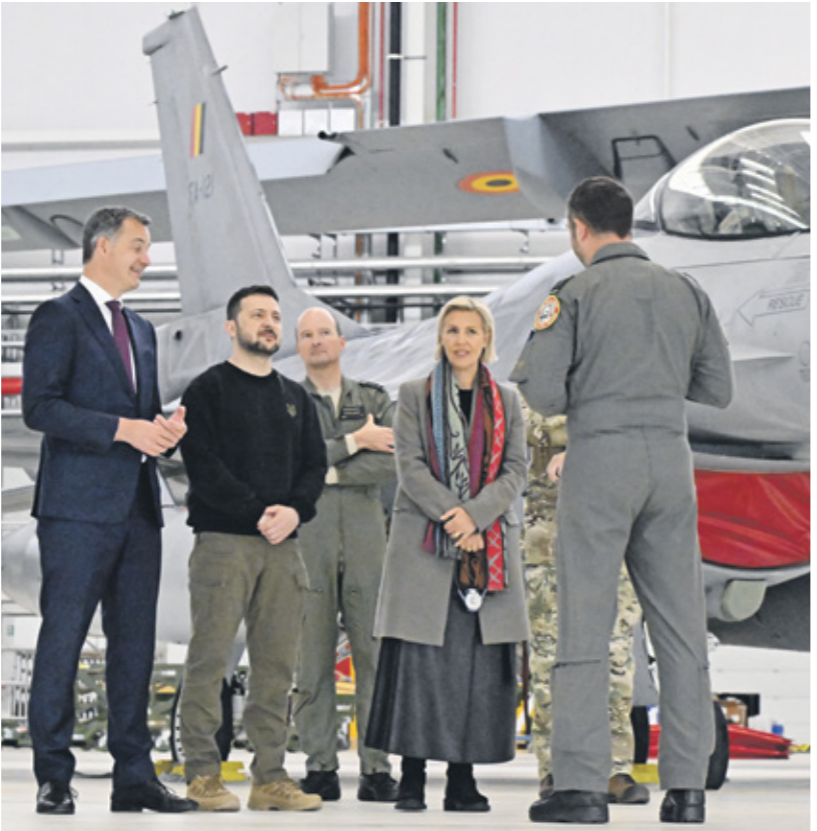
يلباسي في حظيرة لطائرات اف 16 في ضواحي بروكسل، مايو 2023

يعد فترة طويلة من الانتظار، تم الإعلان أخيراً عن وصول أول دفعة من طائرات اف 16، امريكية الصنع، إلى أوكرانيا، رغم الحديت عن أنها لم تستخدم أصبحت في أوكرانيا. ما كان مستحلاً في السابق بات ممكناً، كما أكد مسؤول امريكي، طلب عدم نشر اسمه، لوكالة رويترز، أمس الخميس، أن الدفعة الأولى من طائرات اف 16، التي سلمت لـ 177 شخصاً، فيما هناك 111 حالة إخضاع قسري» في جهته للمدعي العام، طارق وليام صبر، 749 شخصاً أوقفوا خلال الاحتجاجات، وقد يواجه بعضهم اتهامات بالارهاب، فيما أعلن الجيش صفات شخص وإصابة 23 في صفوفه خلال القتال.