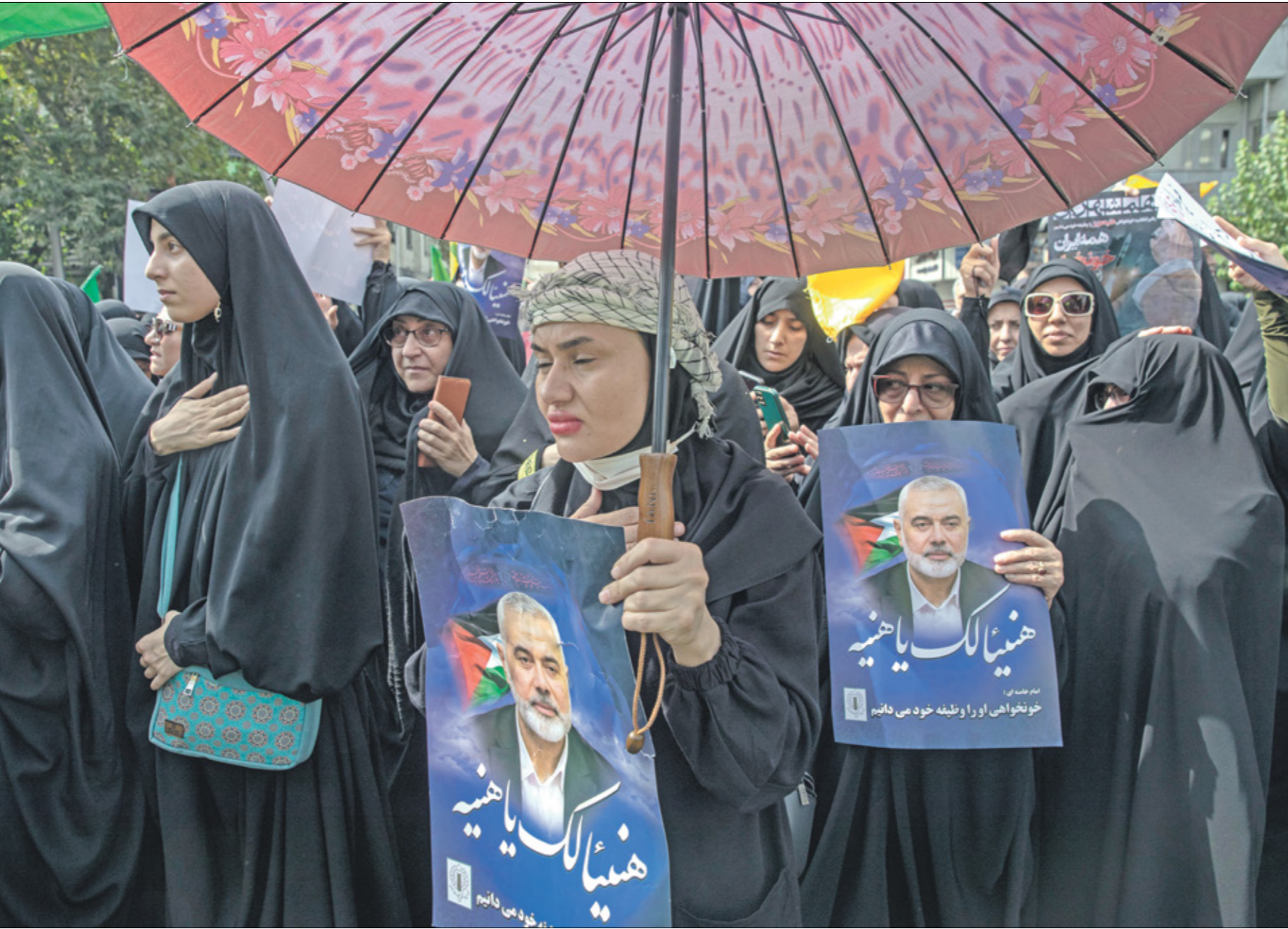
من تشييع هنية في طهران امس

في طهران، جرت امس مراسم تشييع جنمان هنية ومرافقه وسيم أبو شعبان في جامعة طهران بحضور جماهيري حاشد وكبار مسؤولو إيرانيي