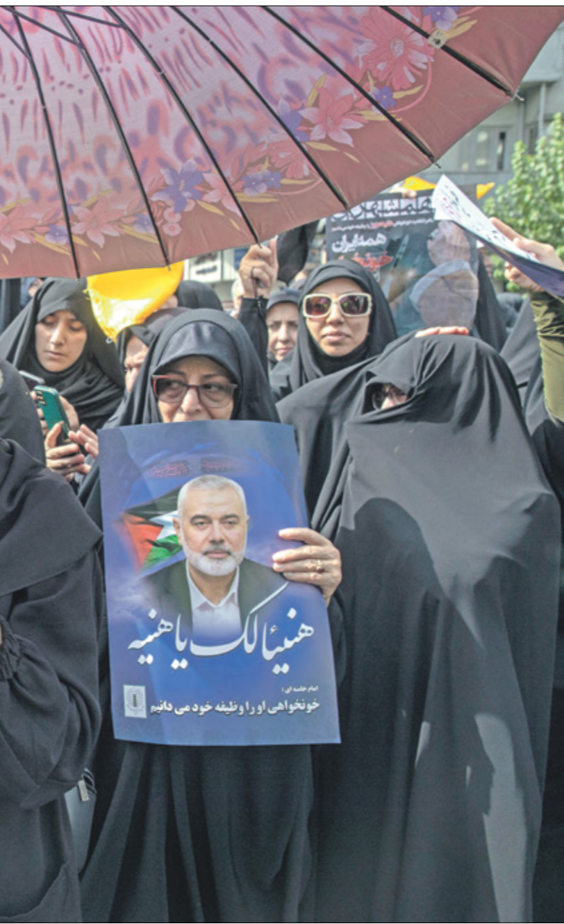
من تشييع هنية في طهران امس

والرغبات والرؤى الصهيونية الدموية بداعية الاميركيين. وبوسط تخالط عربي غير مسروق في علقته، ليستأ قدراً محتمواً ليظن البعض ان مسألة الوحدة على برنامج التمسوتيه، أمر مشترك لحقوق وطنية تاريخية ترف. فإن ما يجري هو مواجهة استكمال الإبادة وتخر وتفكيك حركة التحرير، لحصرها في المطالبة بخدمات حياتية تحت حراپ المستعمر وارهاب متمسوتيه، أمام منظمة التحرير الفلسطينية فرصة كبيرة. مع كل تلك الدماء والتضحيات، لتستعيد مرة أخرى زمام المبادرة. ثملاً أم معظم الشهداء، وتשמها الكنازح والمضي صلابه. لم تعد تكفي بيانات التوايي الطيبة، وهنا الكيان الصهيوني التوحد فرحاً على دماء الفلسطينيين. لا يقابل بتفكك، بل بوحدة تعيد حتى صدق مقولة، «العهد بعد العهد». فما المانع ان تستعيد المنظمة بنا، نفسها على أسس وطنية جامعة. وفي ظورها لشركه تضحيات مئات آلاف الشهداء والرجعي تضحيات وتحديات جسام، على مذبح حرية فلسطين؟