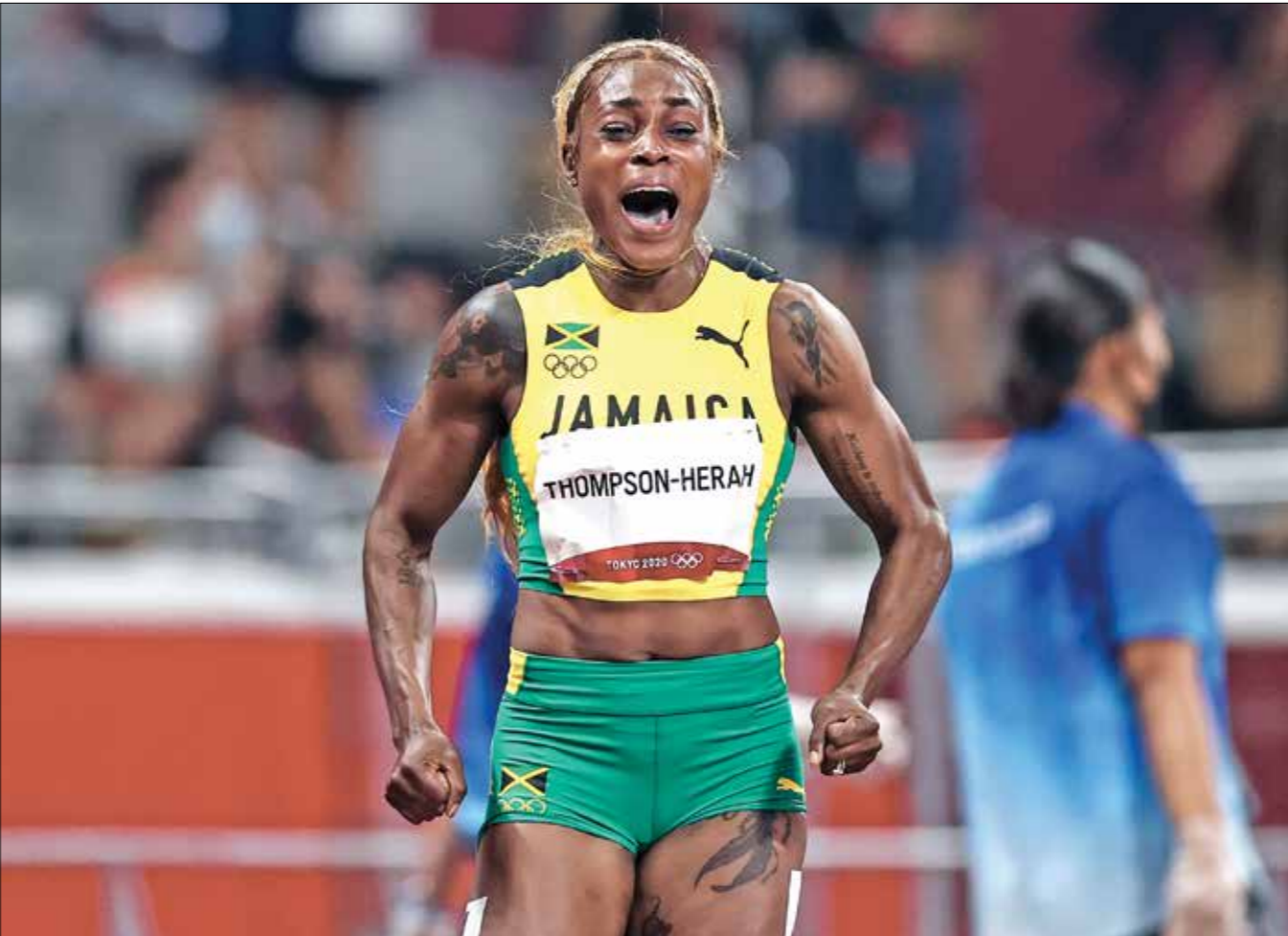
احتفظت العدة بلقبها الأولمبي في سباق 100 م

وسجلت تومسون-هيراه، البالغة 29 عاماً، رقماً أولمبياً قدره 10,61 ثوان، محققة ثاني أسرع رقم في التاريخ ومضطمة الرقم الأولمبي المسجل باسم الراحلة الأميركية، فلورينث غريفيت جونسون، التي تحمل أيضاً الرقم العالمي (10,49 ثوان) منذ عام