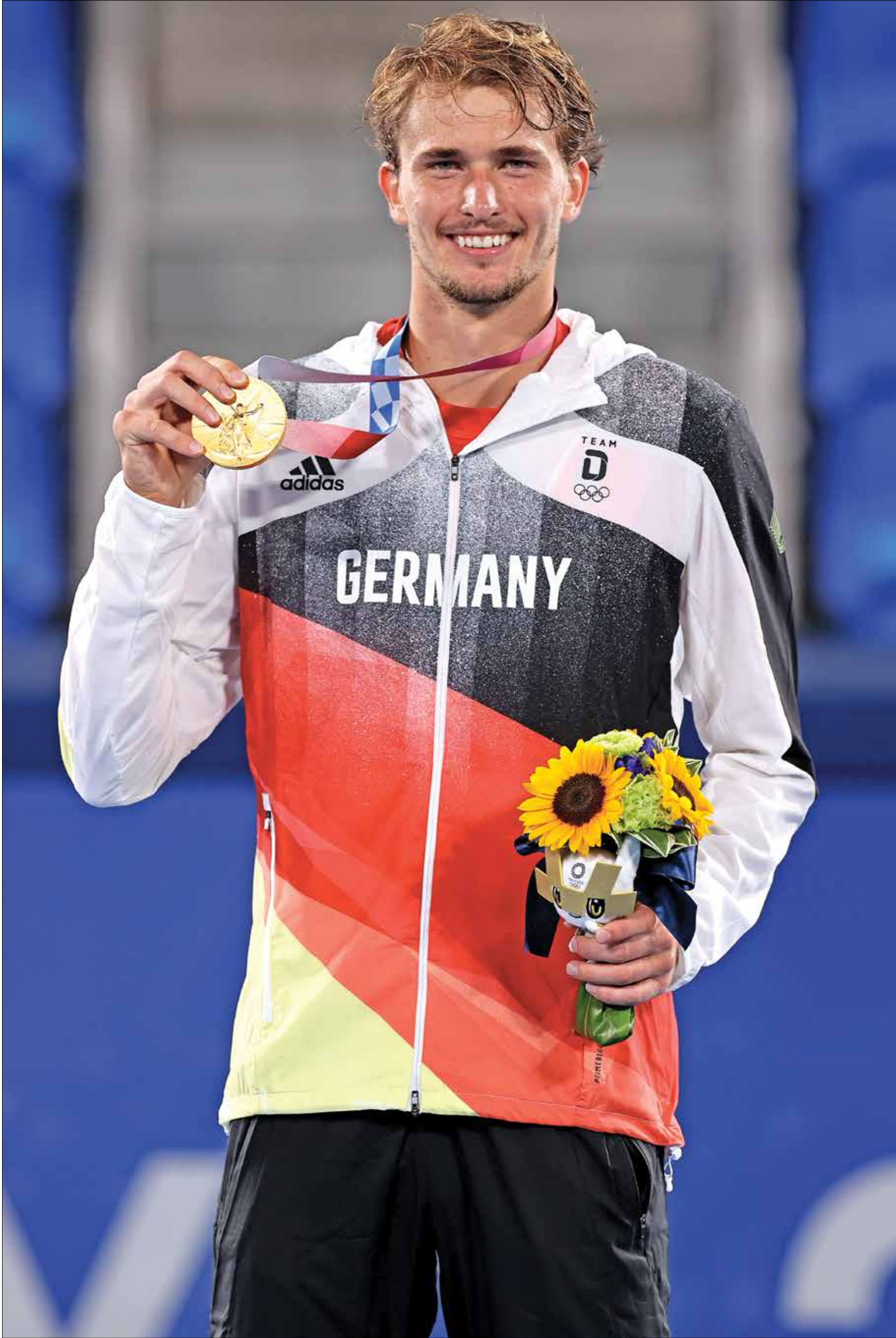
زفيريف يحصد أول ميدالية ذهبية له في تنس «الأولمبياد»

وصل النجم الألماني الكسندر زفيريف، إلى مراده في منافسات التنس في أولمبياد طوكيو 2020، وذلك بعد فوزه في المباراة النهائية على الروسي كارن خاتشانوف (6-3) و(6-1)، ليُحقق الميدالية الذهبية الأولى في تاريخ مشاركته في الألعاب الأولمبية. وامسح زفيريف ثاني ألماني يُتوج بالذهب بعد إنجاز النجمة شتيفي غراف، التي حققت الميدالية في أولمبياد سيول عام 1988.