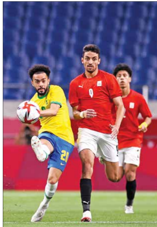
ملك الصبيات شباب أحرار قادري علي ترحيم الإضافة

رغم أن الفائز في المباراة هو المنتخب البرازيلي، المرشح الأول للفوز بالميدالية الذهبية، فإن الخسارة فحرت بركان الأحرار، خصوصاً أن المنتخب المصري كان يمني النفس بالفوز بميدالية أولمبية، إلى جانب فوزه قبل أشهر قليلة على البرازيل (2 - 1) وبدأ في القاهرة خلال تجربة قوية بكامل نجوم