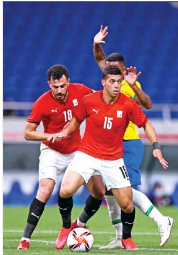
ملك الصبيات مصر فشك في تحفيق الفوز

منتخب «أقصى الساميا» وقتها، بالإضافة إلى أمثال منتخب «الراعة» لجويل يشارك لاعوه بشكل أساسي في الدوري المصري والتصريحات الوردية التي أطلقها شوقي غريب المدير الفني للمنتخب قبل الدورة عن حصد ميدالية.