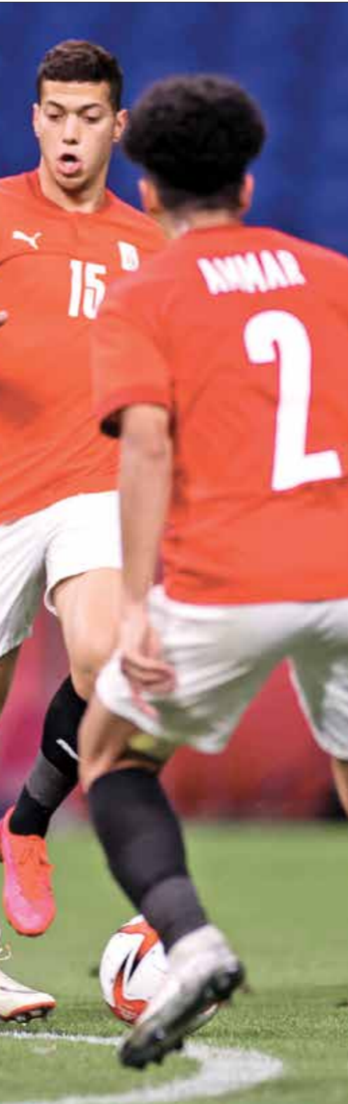
لا يملك منتخب مصر الأولمبي المهاجم الهادف