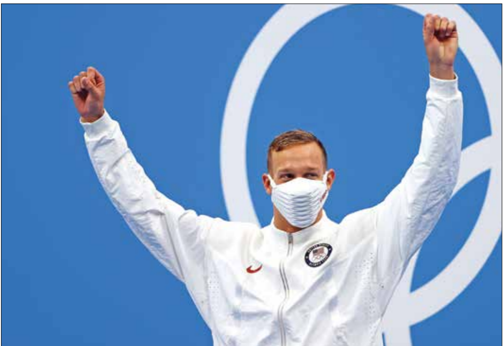
كاليب دريسك، احد ابرز نجوم اولمبياد طوكيو 2020 (Getty)

أربع مرات متنوعة، في الرمق الأخير على الولايات المتحدة. وأصبحت ماكينون، أيضاً، ثاني رياضية تتألق سبع ميداليات في دورة واحدة بعد الروسية ماريا غوروخوفسكايا، في الجمباز الفني عام 1952، ورفعت حوزة، ونزلت ماكينون البالغة 27 سنة تحت حاجز 24 ثانية (23,81 ثانية)، وهو رقم أولمبي جديد، متقدمة على حاملة الرقم العالمي السويدية سارة سوستروم (24,07 ثانية)، (فرانس برس)