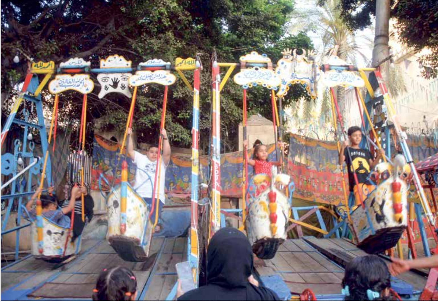
معرض رزم الخطر