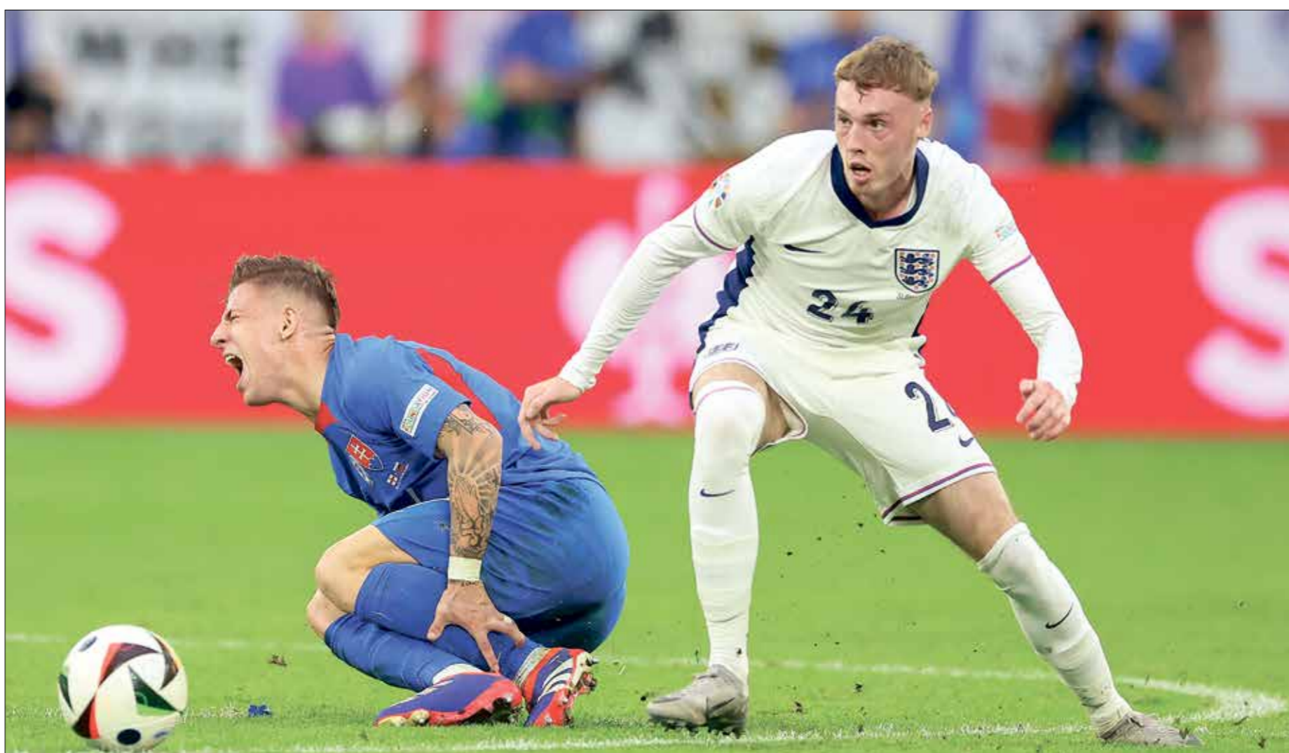
بالمر كان ورقة مهمة في صفوف إنكلترا ومهد لهضيء ببلشهام وكين

في ألمانيا، وتستمر حتى 14 يوليو/ تموز المقبل. وتوسع النمسا في ثاني محاولة لها في دور الـ16 أن تذهب إلى ربع النهائي لأول مرة في تاريخها، بعدما ودعت نسخة 2021 من هذه المرحلة أيضاً بعد الهزيمة بنتيجة 1-2 على يد إيطاليا، التي تابعت طريقها حسباً نحو النهائي وحققت اللقب على حساب إنكلترا في النهائي على ملعب رالف رانغنغيك، شقوا طريقهم إلى القمة ويميلو الشهير في العاصمة البريطانية لندن برحلات الترجيح. وكانت النمسا قد اكتسحت تركيا في مباراة ودية في شهر مارس/ آذار الماضي بنتيجة 1-0، لكن في المقابل هذا الأمر لن يكون مهماً