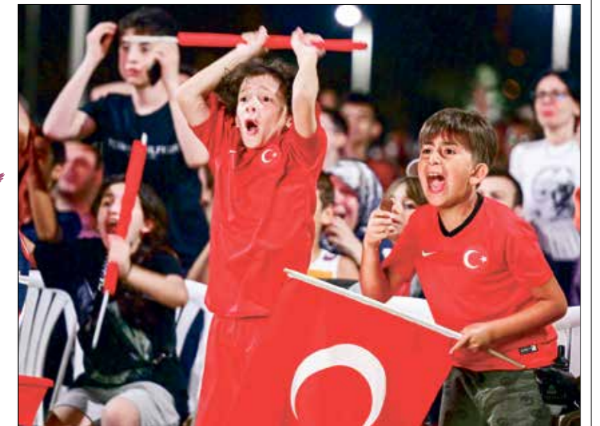
الزغاريط تلحظون الذهاب بعيداً في هذه البطولة