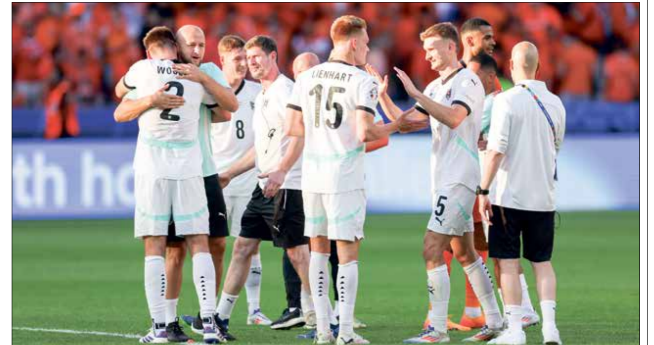
منتخب النمسا تصدّر مجموعة كانت تصغر فرنسا وهولندا